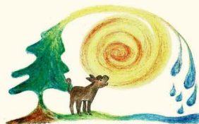
Wald- und Wiesenkindergarten Pfullendorf

Zur Wolfgrube • 88630 Pfullendorf/Großstadelhofen Telefon: 07552-928173 www.waldundwiesenkindergarten.de Leitung: Neeske Kühner • Träger: Freies Forum e.V. Gruppen: 1 + Spielgruppe „Zwergengruppe“ mit 4 Plätzen