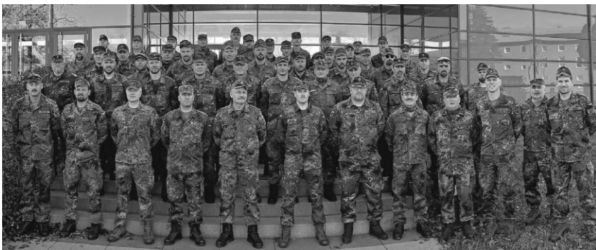
Die Soldaten der Heimatschutzkompanie Linzgau hatten ein erstes Treffen in der Staufer-Kaserne.