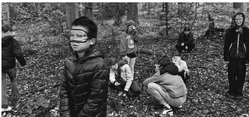
Die Fünftklässler der Sechslinden-Schule erlebten einen lehrreichen Vormittag im Wald.

Pfullendorf/pa - Der Ortsverband Pfullendorf im Sozialverband VdK veranstaltet am Donnerstag, 9. Januar, eine Fahrt zur Johann-Strauß-Gala im Kongresszentrum in Ulm. Das Konzert ist ein Garant für frisches Lebensgefühl, Vitalität und Sinneslust. Der Ortsverband hat 50 Tickets der Kategorie 2 reservieren lassen und auch bereits den Bus bestellt. Abfahrt ist um 16.30 am Stadtgartenvorplatz. Mitglieder zahlen 90 Euro für Ticket und Fahrt, Nichtmitglieder müssen 100 Euro pro Person bezahlen. Anmeldungen mit Angabe von Name, Telefon und Mailadresse nimmt Karlheinz Fahlbusch unter Telefon 07552/9367240, E-Mail: info@apm-pfullendorf.de oder WhatsApp 0171/3834967 entgegen.