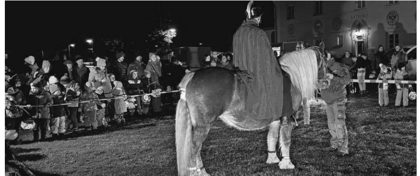
Die Aach-Linzer Kinder erlebten einen schönen Martinsumzug, bei dem auch der Heilige Martin auf dem Pferd und der frierende Bettler nicht fehlten.

Pfullendorf/pa - Die Skatburg Pfullendorf hält am Freitag, 6. Dezember, im Gasthaus „Mohren“ eine