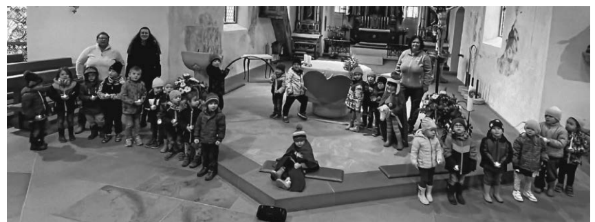
Die Kinder des Denkinger Kindergarten führten bei der Martinsfeier das Martinsspiel auf.