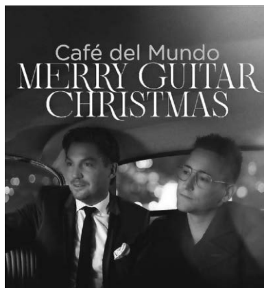
Das Gitarrenduo Café del Mundo präsentiert im Alten E-Werk sein Programm „Merry Guitar Christmas“.