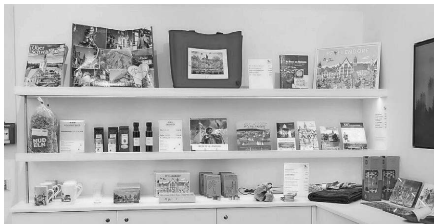
Im Shop der Tourist-Information sind viele schöne Geschenkideen erhältlich.

Pfullendorf/hsg - Bei der Volkshochschule Pfullendorf beginnen in Kürze die folgenden Kurse.