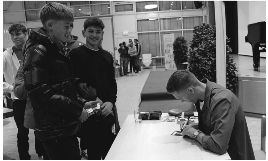
Noch lange nach dem offiziellen Teil der Sportlerehrung unterschrieb Nils Petersen Autogrammkarten für seine vielen Fans.