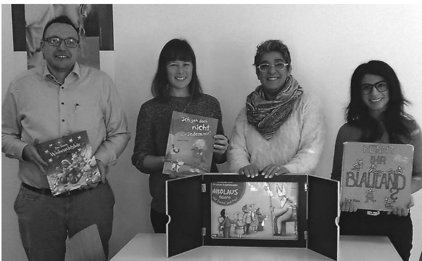
Beim Vorlesetag im Familienzentrum Sonnenschein lasen die Angehörigen den Kindern aus einem vorher ausgewählten Buch vor.

Dienstags, 16 Uhr Kunterbunte Farbenwelt Mittwochs, 15.30 Uhr Mal- und Experimentieratelier ab 6 Jahren Mittwochs, 17 Uhr Mal- und Experimentieratelier ab 9 J. Donnerstags, 17 Uhr Offenes Atelier, Jugendl. u. Erwachs. Samstags, 10 Uhr Dance for Kids I ab 4 Jahren Samstags, 11 Uhr Dance for kids II ab 8 Jahren