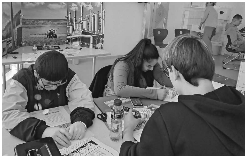
Die Schüler der Klassen acht bis zehn erhielten spannende Einblicke in die MINT-Berufe.

Pfullendorf/pa - Der Sportclub Pfullendorf hält seine Jahreshauptver-