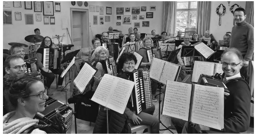
Das Akkordeon-Orchester Aach-Linz feiert in diesem Jahr sein 50-jähriges Bestehen. Aus diesem besonderen Anlass laden die Musiker am 23. November zu einem Jubiläumskonzert ein.

Aach-Linz/pa - Das Akkordeon-Orchester Aach-Linz feiert in diesem Jahr sein 50-jähriges Bestehen. Aus diesem besonderen Anlass lädt das Orchester am Samstag, 23. November, zu einem Jubiläumskonzert ins