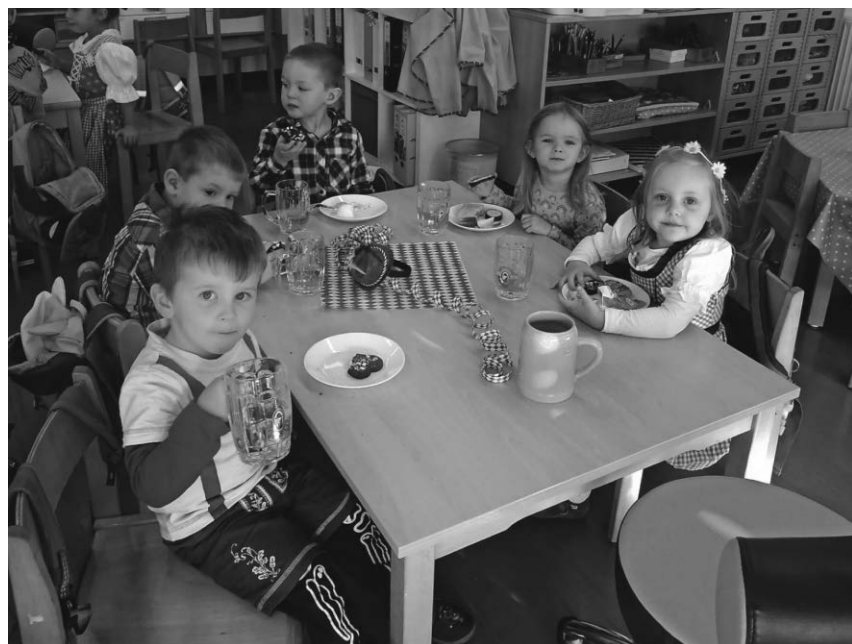
Der Kindergarten St. Johann hat ein fröhliches Oktoberfest gefeiert.

Denkingen/pa - Der Kindergarten St. Johann hat ein fröhliches Oktoberfest gefeiert. Im Vorfeld des Fests haben fünf Mütter mit den Kindern Lebkuchenherzen gebacken und dekoriert. Die Kinder haben sich sehr darüber gefreut und die Zeit beim gemeinsamen Backen genossen. Diese Lebkuchen haben die Kinder dann bei der Feier verspeist und ein weiterer Lebkuchen durfte mit nach Hause genommen werden. Fast alle Kinder waren passend zum Motto mit Lederhose und Dirndl gekleidet. Zum Frühstück gab es Weißwürste und Brezeln mit süßem Senf. Dazu wurde ein leckeres Apfelschorle im Bierkrug getrunken. Alle Kinder und die Erzieherinnen hatten viel Spaß bei den lustigen Spielen mit Musik und Salzbrezelschnappen.