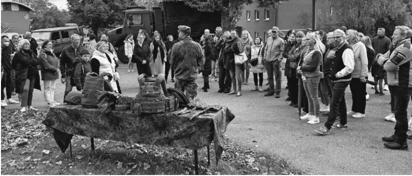
Die Angehörigen der jungen Rekruten lernten beim Familientag die Stauferkaserne kennen.

zahlreiche Aus- und Fortbildungsmaßnahmen, deren Teilnahme den Rekruten freigestellt wird. Über 30 junge Frauen und Männer durchlaufen derzeit die Basisausbildung und erleben hautnah die Höhen und Tiefen einer solchen Ausbildung. Um auch ihre Angehörigen mitzunehmen wurden sie zu einem Familientag in die Stauferkaserne eingeladen. Hier erhielten sie nach einem Lagevortrag einen breiten Überblick über das Ausbildungszentrum und den Ablauf einer Grundausbildung. Später konnten sich die Angehörigen mit den Ausbildern austauschen. Der Eintopf aus einer Bundeswehr-Gulaschkanne war für viele Besucher einer der Höhepunkte des Tages. Die Bevölkerung ist herzlich zum öffentlichen Gelöbnis am 28. November in Krauchenwies eingeladen. Die Pfullendorfer Rekrutinnen und Rekruten des Ausbildungszentrums Spezielle Operationen legen an diesem Tag gemeinsam mit ihren Kameradinnen und Kameraden des Artilleriebataillons 295 ihr feierliches Gelöbnis ab.