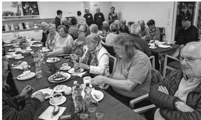
Der Bürgerhilfeverein lud zu einem informativen Weißwurstfrühstück ein.