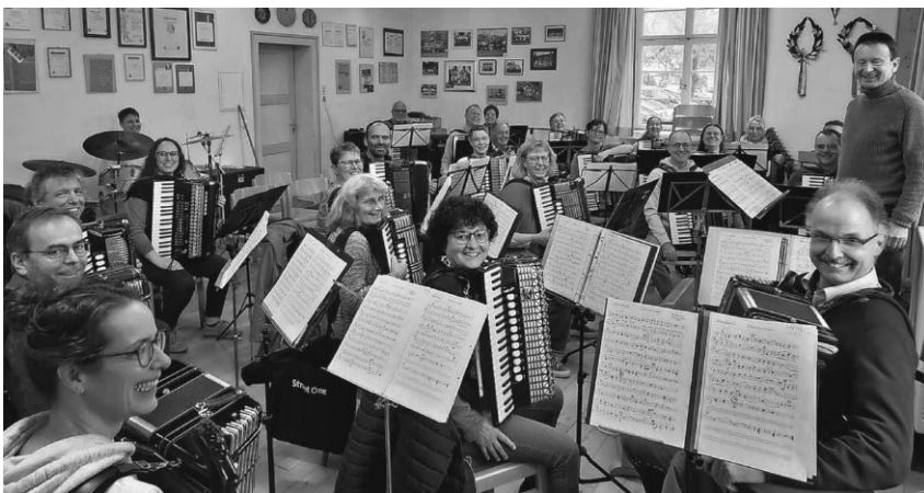
Das Akkordeon-Orchester Aach-Linz feiert in diesem Jahr sein 50-jähriges Bestehen. Aus diesem besonderen Anlass laden die Musiker am 23. November zu einem Jubiläumskonzert ein.