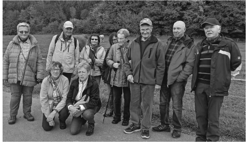
Der Schwäbische Albverein hat die Wandersaison mit einer Wanderung in der näheren Umgebung von Pfullendorf beendet.

Pfullendorf/pa - Die Sektion Pfullendorf im Deutschen Alpenverein