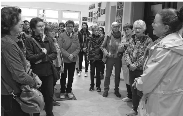
Die Mitglieder der Katholischen Frauengemeinschaft besuchten den Lehenhof im Deggenhauser-tal.