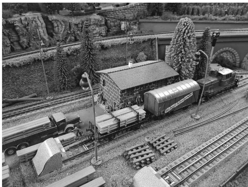
Der Modelleisenbahnclub lädt an diesem Wochenende zur großen Modellbahnausstellung in die Stadthalle ein.

Pfullendorf/pa - Der Modelleisenbahnclub lädt am Wochenende vom 16. und 17. November wieder zur großen Modellbahnausstellung in die Stadthalle ein. Die Ausstellung ist an beiden Tagen von 10 bis 17 Uhr geöffnet. Die Vereinsmitglieder, darunter viele Jugendliche, wollen den Besuchern ihre Modelleisenbahn-Anlagen zeigen und informieren, was sich in den letzten Monaten weiterentwickelt hat. Wie in jedem Jahr werden die Gäste wieder