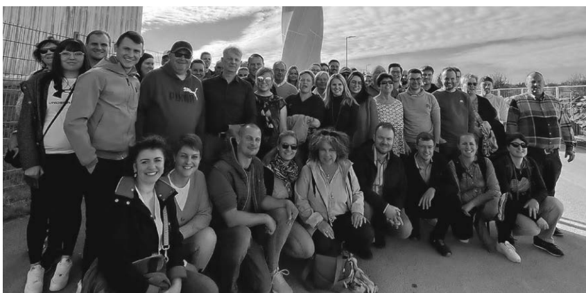
Die Stadtmusik hat bei ihrem zweitägigen Ausflug Straßburg, Kehl und den Aufzugsturm in Rottweil besucht.

Pfullendorf/pa - Die Stadtmusik hat bei ihrem diesjährigen Ausflug die Städte Straßburg und Kehl besucht. Mit dem Bus ging es in Richtung Kehl, wobei unterwegs eine Frühstückspause in der Nähe des „Balzer Herrgotts“ bei Gütenbach eingelegt wurde und die Gelegenheit zu einem Besuch der Pilgerstätte bestand. Nach der Ankunft in Kehl ging es mit der Straßenbahn weiter nach Straßburg, wo eine Stadtführung auf den Kanälen mit einem Boot auf dem Programm stand. Den Abend verbrachte man mit einem gemeinsamen Essen in Kehl. Danach blieb Zeit für einen Ausflug ins Kehler Nachtleben oder ein paar gemeinsame Stunden im Hotel. Am zweiten Tag teilte sich die Gruppe. Die einen fuhren nochmals nach Straßburg, die andere besuchte das ehemalige Gartenschau Gelände in Kehl. Auf der Rückfahrt wurde eine Pause in Rottweil eingelegt, um den 246 Meter hohe Aufzugsturm bei einer Führung und einem Besuch der Plattform zu besichtigen. Zum Ausklang des gelungenen Ausflugs wurde dann noch gemeinsam in Pfullendorf eingekehrt. Die Vereinsmitglieder danken dem Planungsteam für die Organisation und die Auswahl der Ziele.