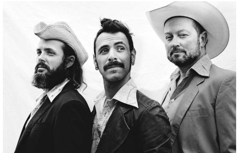
Die Band „Yonder Boys“ ist am 14. April bei einem Konzert im Biergarten des Café Moccafloor zu Gast.

Spenden für die Musiker wird gebeten. Yonder Boys sind eine Band, die sich an der Grenze von Americana/Bluegrass/Newgrass und Folk aufhält. Während sie auf traditionellen Bluegrass-Instrumenten wie Banjo, Dobro, Mandoline, Gitarre oder Kontrabass spielen, konzentrieren sich ihr Songwriting und ihre Auftritte auf Raum für Experimente und auch auf ihre Liebe zum Kreieren und Singen wunderschöner dreistimmiger Gesangsharmonien.