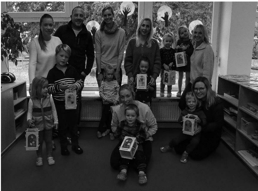
Im Kindergarten Denkingen wurden Laternen gebastelt.

Mächtig stolz sind alle nun auf ihre in verschiedenen Farben leuchtende Laternen. Es war ein gelungener Nachmittag. Vielen Dank an alle Familien die teilgenommen haben.