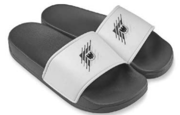
Die perfekte Geschenkidee für sportliche Pfullendorferinnen und Pfullendorfer: die Pfulli-Lette.

Pfullendorf/hsg - Anlässlich der diesjährigen Sportlerehrung wurde ein Geschenk der besonderen Art entwickelt - die original Pfulli-Letten. Sie sind noch auf der Suche nach einem exklusiven Weihnachtsgeschenk, einem originellen und einzigartigen Geschenk? Dann haben wir genau das Richtige für Sie! Anlässlich der Sportlerehrung wurden original Pfulli-Letten gestaltet und in großer Anzahl bestellt. Diese Badeschlappen mit Stadt-Logo können ab jetzt für 15 € in der Tourist-Info erworben werden. Die Pfulli-Letten sind eine einmalige Aktion und sind nur so lange der Vorrat reicht erhältlich.