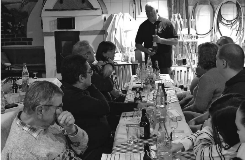
Die Likör und Schnapsprobe bei Schradolfs Hofbrennerei stand unter dem Motto „regional genießen“, der Abend fand im Rahmen der Veranstaltungsreihe „Hofwelten“ statt.

in Ostrach, Meßkirch und weiteren umliegenden Gemeinden. Ein weiterer Vertriebsweg steckt bereits in der Pipeline.