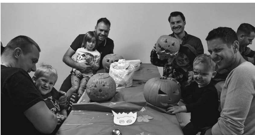
Beim diesjährigen Papa-Tag im Familienzentrum Sonnenschein hatten alle viel Spaß.

Wer Lust darauf hat, das gesamte Sortiment oder zumindest Auszüge davon zu probieren, bucht am besten einen Termin für eine Gruppe. Erhältlich sind die Produkte aber nicht nur vor Ort, sondern inzwischen auch auf dem ein oder anderen Markt, wie dem Herbstmarkt in Wald oder den Weihnachtsmärkten