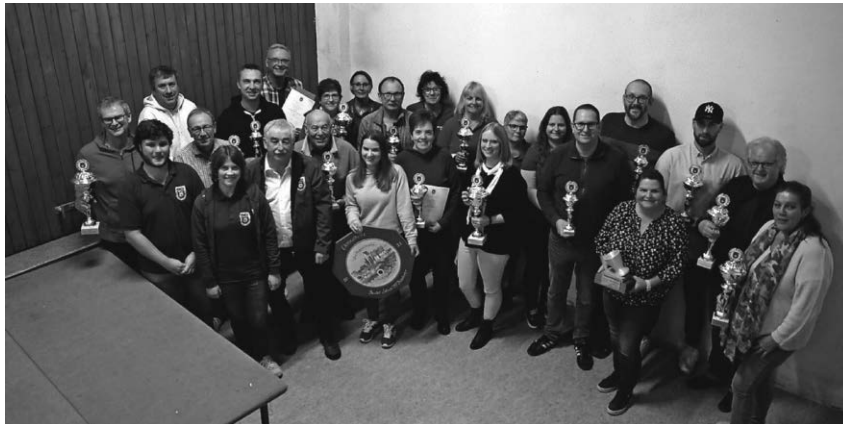
Die glücklichen Gewinner des 37. Mannschaftspokalschießen der Schüt- zengemeinschaft Pfullendorf/Aach-Linz.

Otterswang/pa - Der Kirchenchor Otterswang veranstaltet zusam- men mit der Bläsergruppe „Linzgau Brass“ am Sonntag, 17. Dezember,