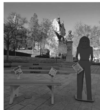
Holzfigur „Andrea“ und die orangefarbene Bank, die auf das Thema häusliche Gewalt aufmerksam machen sollen, gehen von nun an auf Tour durch den Landkreis Sigmaringen.