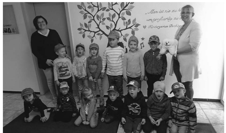
Frau Frohmüller von der Zahngesundheit Sigmaringen besuchte den Kindergarten Denkingen.

Pfulendorf/pa - Einen großartigen Nachmittag erlebten die Kinder mit Mama und Papa am Mittwoch, den 18.10.2023 beim Laternen basteln im Kindergarten St. Johann Denkingen. Die im Voraus bestellten Bastelsets konnten an diesem Nachmittag zu einer schönen Holzlaterne verarbeitet werden. Große Freude hatten die Kinder dabei mit ihren Eltern zu schneiden, kleben und verzieren.