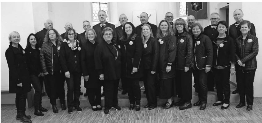
Der Otterswanger Kirchenchor lädt zu einem Benefizkonzert am Sonntag, den 17. Dezember ein.

An sieben Wettkampfabenden konnte auf Zielscheiben in einer Ent- fernung von 10 Metern geschossen werden. Bei den Damenmannschaf- ten hatte am Ende die Gruppe der Kramer Werke die Nase vorne. Bei den Herren / gemischt Mannschaf- ten durften sich wie letztes Jahr schon die PTS Holzwurm & Friends von den Pullendorfer Torsystemen mit einer Ringzahl von 782 als Sie- ger küren.