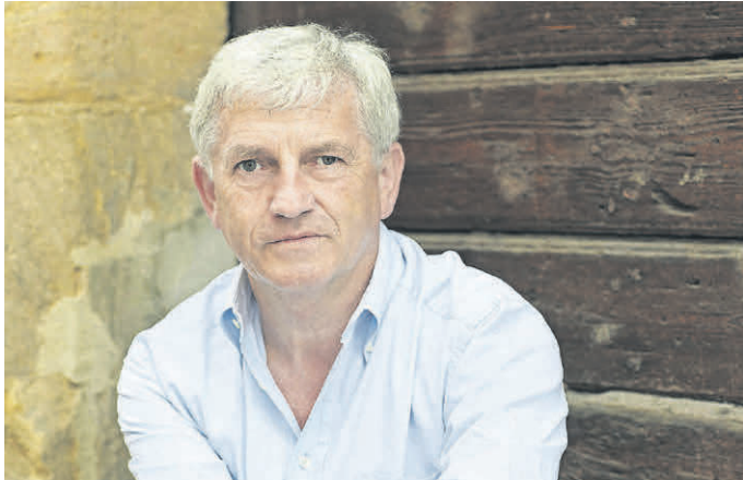
Schriftsteller Arnold Stadler präsentiert am 15. Dezember im Kolpinghaus seinen Roman „Irgendwo. Aber am Meer“.

Meer«. Eine tragikomische Reise durch Erinnerungen, Geschichten und Gedanken, eine Suche nach unserem Platz in der Welt: dem Ort, an dem wir – trotz allem! – glücklich sein können. Irgendwo. Aber am Meer. Karten zu 12 Euro gibt es bei der Touristinformation in Pfullendorf (07552-251131) und bei der Buchhandlung Lesereich (Tel.: 07552-8160).