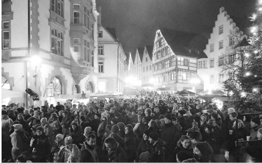
Am Wochenende des zweiten Advent verwandelt sich der Pfullendorfer Marktplatz wieder zum Adventszauber.

Pfullendorf/pa - Kaum werden die Tage kühler, die Blätter fallen von den Bäumen und der erste Schnee kündigt sich an, steht auch schon der Pfullendorfer Adventszauber vor der Türe. Der mittelalterliche Marktplatz glänzt im Kerzenschein, es riecht