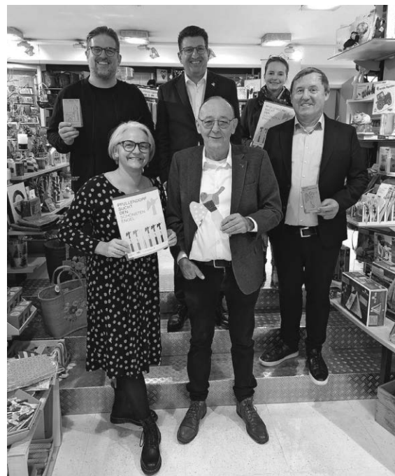
Die Stadt Pfullendorf sucht gemeinsam mit der WIP den schönsten Engel. Die Malvorlagen sind erhältlich bei den teilnehmenden Einzelhändlern.

Prämiert wird Pfullendorfs schönster Engel dann während des Engelsabstieges, am 09. Dezember ab 18 Uhr, und zwar von unserem Pfullendorfer Engel höchst persönlich! Folgende Geschäfte machen mit: Binder Optik, Buchhandlung Lesereich, Café Moccacolor, Downtown Fashion, Friseur Kupferschmid, Intersport Marco, Kinderladen Flotter Käfer, Klaiber Papeterie, Modehaus Langer, Oskar Market, Schuhhaus Nipp, Sparkasse Pfullendorf-Meßkirch, Stadt Pfullendorf, Weltladen