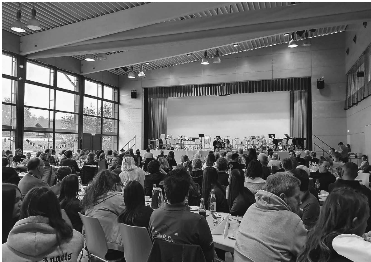
35 Kinder und Jugendliche zeigten beim Jugendvorspiel des Musikverein Denkingen - Burgweiler ihr Können.

-musiker der Musikvereine Burgweiler und Denkingen zeigten mit viel Spaß und Freude, was sie im Unterricht gelernt haben.