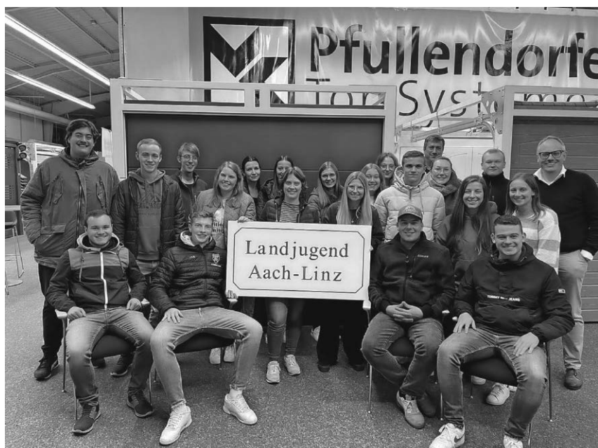
Die Landjugend Aach-Linz bei einer Betriebsführung der Firma Pfullendorfer Torsysteme.