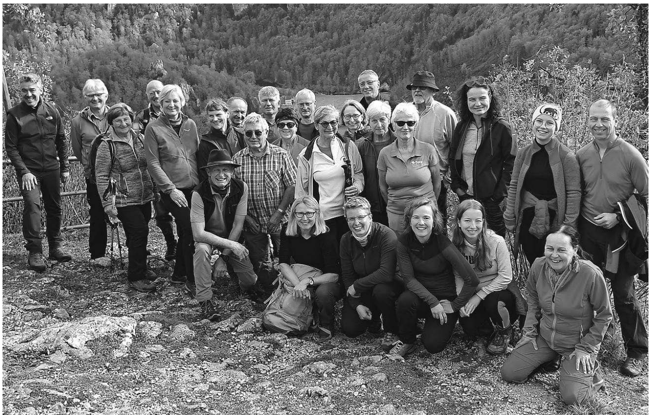
30 Wanderer nahmen an der diesjährigen Jahresabschlusswanderung der DAV Sektion Pfullendorf teil.