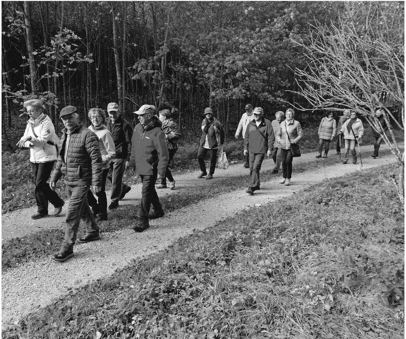
Die Ortsgruppe Pfullendorf des Schwäbischen Albverein bei ihrer diesjährigen Abschlusswanderung.

Denkingen/pa - Rund 35 Kinder und Jugendliche sowie die Jugendkapelle Burgweiler/ Denkingen haben am diesjährigen Jugendvorspiel teilgenommen. Die Gäste erlebten bei Kaffee und Kuchen einen kurzweiligen musikalischen Nachmittag, der von der Jugendkapelle eröffnet wurde. Von der musikalischen Früherziehung und der Blockflötengruppe über die Vielfalt der Blasmusikinstrumente wie Querflöte, Klarinette, Saxophon, Trompete, Tenorhorn und Posaune bis zum Schlagwerk war alles dabei und die Nachwuchsmusikerinnen und