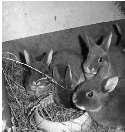
Der Kleintierzuchtverein präsentiert am 14. und 15. Oktober im Seepark seine Arbeit.

Pfullendorf/pa - Nach über 3 Jahren veranstaltet der Kleintierzuchtverein Pfullendorf vom 14. - 15. Oktober wieder eine Schau im Seepark. Für die Besucher gibt es die Möglichkeit, sich über die Arbeit und Zuchterfolge des Vereins zu informieren. Auch in diesem Jahr gibt es für Kinder eine Bastecke sowie eine Tombola. Ein Imker wird Honig anbieten, erklären wie Bienen versorgt werden und der Honig geimkert wird. Die Schau findet im Eiszelt am 14.10. von 10.00 - 18.00 Uhr und am 15.10. von 10.00 - 17.00 Uhr statt. Für Kinder ist der Eintritt frei.