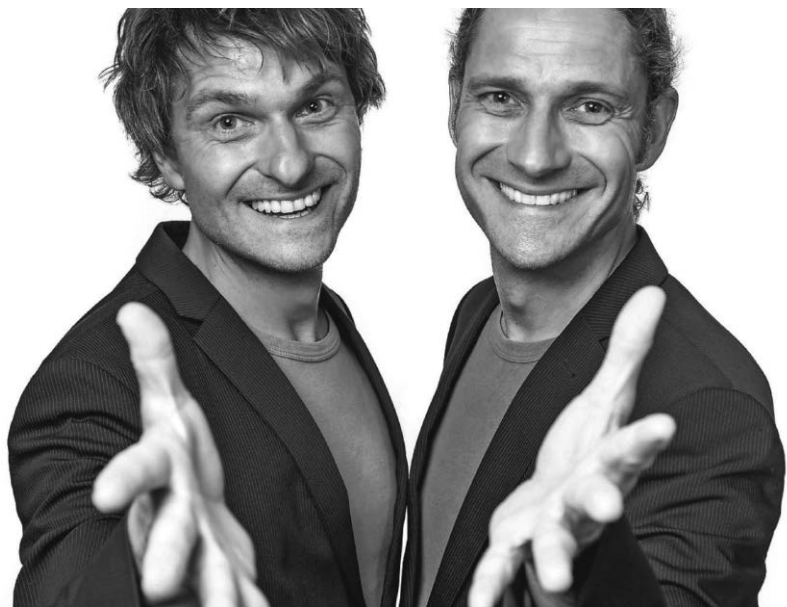
Das Duo „Junge Junge“ gastiert am 19. Oktober in der Stadthalle.