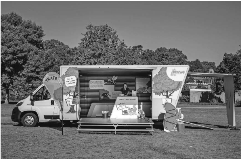
Das Bewegungsmobil der Kinderturnstiftung Baden-Württemberg zeigt den großen und kleinen Besuchern am 22. Oktober, wie viel Freude Bewegung machen kann.