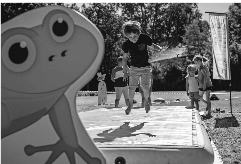
In der ganzen Stadt warten Bewegungsangebote auf Groß und Klein.

Bibliotheksbestand zum Verkauf, aber auch eine Vielzahl fast neuwertiger Unterhaltungsromane aus Privatbeständen. Hierfür nimmt die Stadtbücherei gerne noch gut erhaltene und nicht zu alte Buchspenden aus privater Hand entgegen. Ein Wiedersehen gibt es an diesem