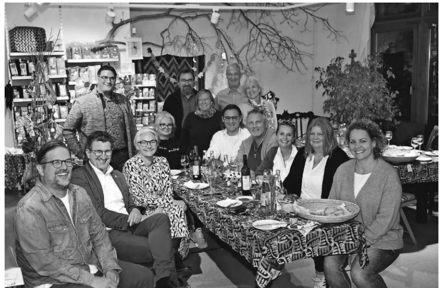
Der Stammtisch Handel war bei seinem letzten Treffen am 4. Oktober zu Gast im Pfullendorfer Weltladen.

Mit Inside Pfullendorf startete die Stadtverwaltung während der Pandemie ein neues Format, welches für Einheimische und Touristen gleichermaßen interessante Einblicke in die Kulturdenkmäler und Museen ermöglicht. Vieles war in gewohnter Weise nicht mehr durchführbar, Museen konnten lange nicht öff-