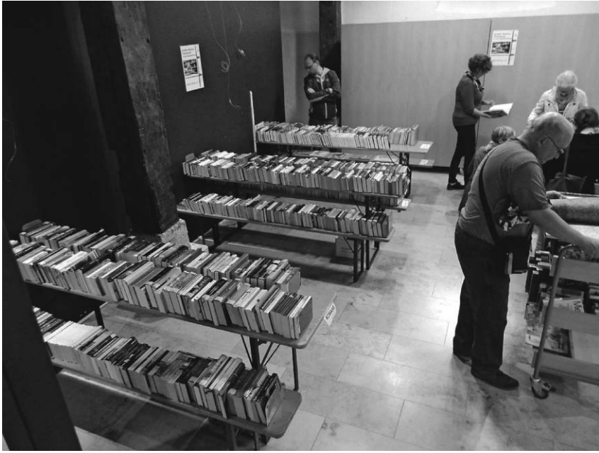
Am 22. Oktober lädt die Stadtbücherei zum Medienflohmarkt im Rahmen des Verkaufsoffenen Sonntag ein.

wahre Kunstwerke auf die Kindergesichter zaubern wird. Daneben sind an diesem Sonntag auch Neuanmeldungen und die generelle Medienausleihe möglich.