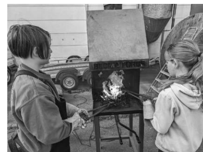
Die Kinder- und Jugendkunstschule bietet wieder neue Kurse für die Kleinen und Großen.

In diesem Kurs dürfen sich Kinder und Eltern gemeinsam mit verschiedenen Materialien beschäftigen und dabei neue Entdeckungen machen. Der Kurs findet immer donnerstags vormittags von 10 -11 statt. Der Kurs läuft rund ums Jahr, ein Einstieg ist auch später möglich. Anmeldungen sind bis zum 26. Oktober an info@kunstschulepfullendorf.de möglich. In den Herbstferien werden außerdem wieder die Kurse ‚Kreatives Schmieden‘ (ab 10 Jahren) am 30. Oktober von 10-13 Uhr und ‚Kreatives Schweißen‘ (ab 12 Jahren) am 4. November von 10-15 Uhr angeboten.