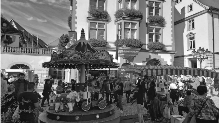
Der Marktplatz bietet wie gewohnt Platz für das leibliche Wohl.