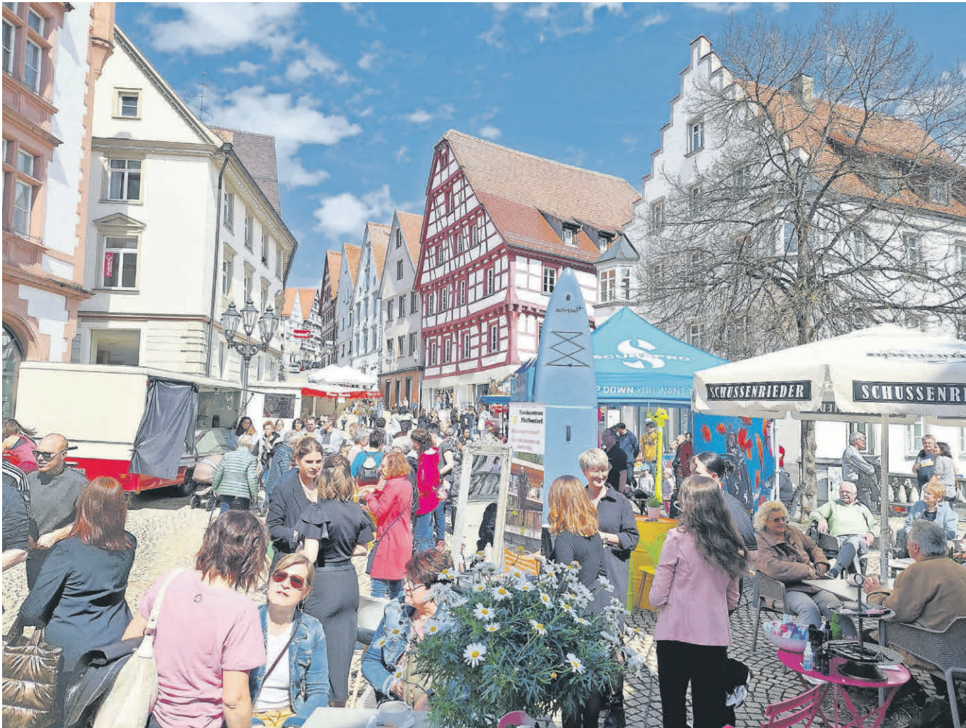
„Pfullendorf in Bewegung“ lautet das Motto des verkaufsoffenen Sonntages am 22. Oktober. Passend dazu sind quer durch Altstadt verschiedene Stände mit Spiel- und Bewegungsangeboten aufgebaut. Die Stände werden von unterschiedlichen Schulklassen, Kindergärten oder auch von Jugendmannschaften der örtlichen Vereine betrieben.

Amtliches Mitteilungsblatt der Stadt Pfullendorf und ihrer Stadtteile Aach-Linz, Denkingen, Gaisweiler, Großstadelhofen, Mottschieß, Otterswang, Zell a. A.