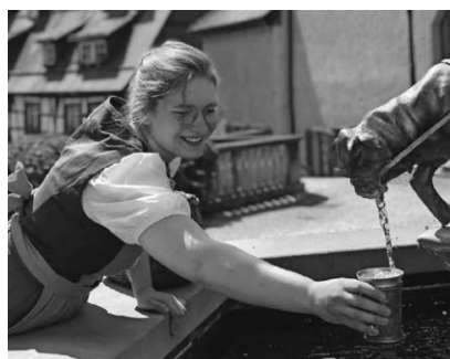
Die Schankmagd Josepha gibt bei einer Schauspielführung am 24. September wieder einige Geheimnisse und Informationen zum Besten.

aus. Der Stadtrundgang zeigt wie das wirkliche Leben im Pfullendorf des Jahres 1774 war. Treffpunkt ist an der Sitzgruppe vor der Tourist-Information am Marktplatz. Erwachsene bezahlen 5,- Euro, Kinder bis 12 Jahre sind frei. Eine Anmeldung bei der Tourist-Information unter Tel. 07552-251131 oder per E-Mail an tourist-information@stadt-pfullendorf.de ist aufgrund der beschränkten Teilnehmerzahl unbedingt erforderlich.