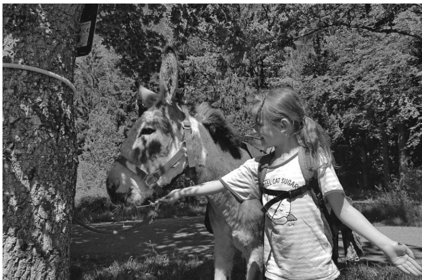
Am Dienstag, den 3. Oktober geht es gemeinsam mit sechs Eseln als Wanderführer auf Tour.