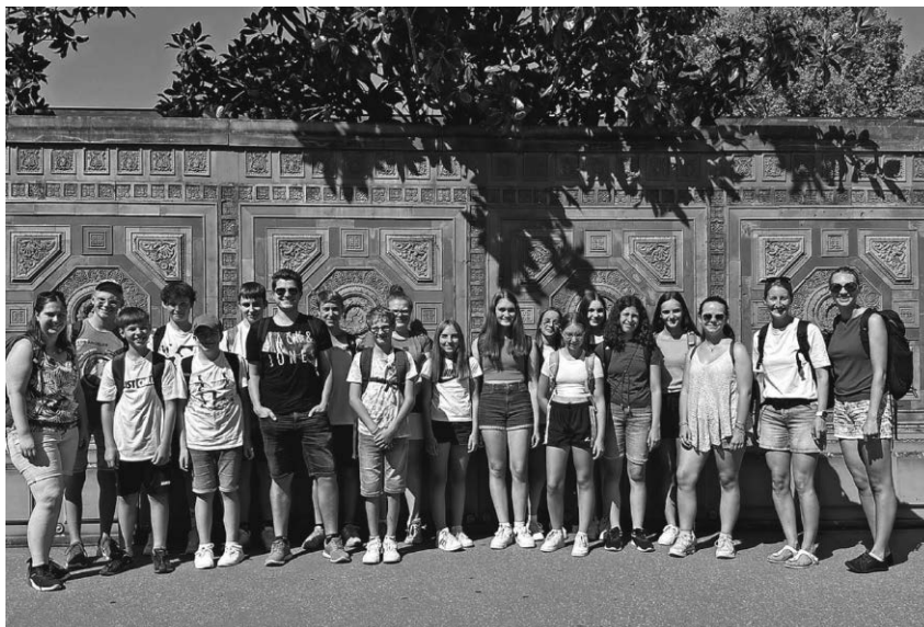
Die Musikanten der Jugendkapelle Burgweiler-Denkingen beim Ausflug in die Wilhelma.