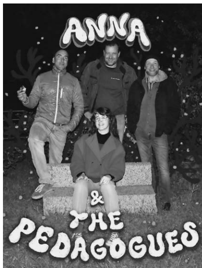
Die Band „Anna & the Pedagogues“ gastiert am 23. September im Café Moccacolor.

Pfullendorf/pa - Im Rahmen des Pfullendorfer Kulturherbst lädt die Stadt in Kooperation mit dem Café Moccacolor am Samstag, den 23. September zum Konzert des Quartetts „Anna & The Pedagogues“. Zum Repertoire der Musiker gehören classic, Jazz und Funk-Covers. Beginn ist um 19 Uhr im Biergarten des Café Moccacolor. Der Eintritt ist frei, Spenden für die Künstler sind erwünscht.