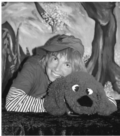
Die Puppenpühne in Ostrach startet ab 8. Oktober in die neue Saison.

Pfullendorf/pa - Bald ist es wieder soweit. Ab Oktober öffnet die Puppenpühne Ostrach wieder regelmäßig ihren Vorhang. Die erste Aufführung findet am Sonntag, 08.10. um 15 Uhr statt. Es wird das Stück „Die Geschichte vom Wackelzahn“ für Kinder ab 4 Jahren aufgeführt. Um telefonische Platzreservierung wird gebeten unter: 07585 / 3315. Weitere Informationen sind im Internet unter: www.puppenbuehne-ostrach.de zu finden.