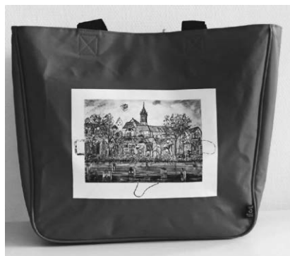
Die neue limitierte Pfullendorfer Shopping-Bag - gestaltet mit dem tollen Pfullendorf-Motiv von Tüten-THITZ ist ab sofort in der Tourist-Info Pfullendorf erhältlich.

Pfullendorf/hsg - Die neue limitierte Pfullendorfer Shopping-Bag - gestaltet mit dem tollen Pfullendorf-Motiv von Tüten-THITZ ist ab sofort in der Tourist-Info Pfullendorf erhältlich. Tüten-THITZ hat zur Eröffnung seiner großen Ausstellung in der Städt. Galerie „Alter Löwen“ Pfullendorf ein tolles Gemälde mit der Stadtansicht von Pfullendorf gestaltet. Dieses Motiv wurde auf einer hochwertigen roten Shopping-Bag als limitierte Edition abgedruckt. Die neue Pfullendorfer-Shopping-Bag hat die perfekte Größe als Begleiter – sowohl für den Einkauf, zum Bummeln oder zum Sport. Die Tasche ist geräumig und bietet viel Platz, ist dabei jedoch nicht klobig oder unhandlich. Durch die kurzen und zusätzlich auch noch die langen Henkel ist sie bequem zu tragen. Eine Reißverschluss tasche außen schützt den Geldbeutel oder das Handy vor fremdem Zugriff. Sie ist somit ein stylisches praktisches Must-Have für den Alltag. Welches bei all den praktischen Vorteilen durch ihr Design auch noch ein ganz toller Hingucker ist. Sie eignet sich auch hervorragend als Geschenk für besondere Anlässe. Die Pfullendorfer Shopping-Bag ist ab sofort in der Tourist-Info Pfullendorf für 29 Euro erhältlich. Die Tourist-Info Pfullendorf ist unter Tel. 07552/25-1131 oder 25-1146 zu erreichen.