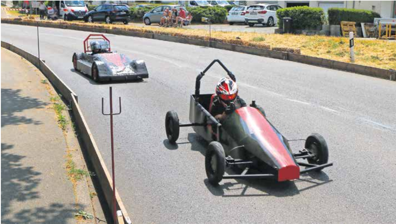
Am 17. Juni fand die Neuauflage des großen Seifenkistenrennens statt.

Amtliches Mitteilungsblatt der Stadt Pfullendorf und ihrer Stadtteile Aach-Linz, Denkingen, Gaisweiler, Großstadelhofen, Mottschieß, Otterswang, Zell a. A.