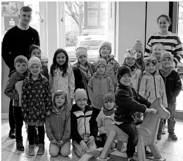
Auch die Vorschüler des Familienzentrums Neidling statteten der Sparkasse einen Besuch ab.

Pfullendorf/rc - Die städtische Wirtschaftsförderung hat sich an der Befragung „Vitale Innenstädte“ der IFH Köln beteiligt. Hierbei wurde in den vergangenen Monaten eine Befragung der städtischen Besucher hinsichtlich deren Gesamteindruck der Pfullendorfer Innenstadt, dem vorhandenen Einzelhandelsangebot und deren Einkaufsverhalten durchgeführt. Es wurden 406 Männer und Frauen im Bereich der Innenstadt befragt, welche sowohl den Gesamteindruck sowie das Einzelhandelsangebot in der Innenstadt als grundsätzlich positiv beurteilten. Verbesserungsbedarf nannten die Befragten bspw. beim Gastronomieangebot sowie dem Freizeit- und Kulturangebot. Die Ergebnisse aus der Befragung sollen nun in einen verwaltungsinternen Workshop zur Aufwertung der Innenstadt einfließen.