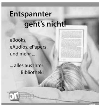
In der Stadtbücherei stehen wieder viele neue E-Books und E-Audios zur Verfügung.

Das wöchentliche Nachrichtenmagazin ist eine von rund 60 Zeitschriften, die über die Onleihe verfügbar sind.