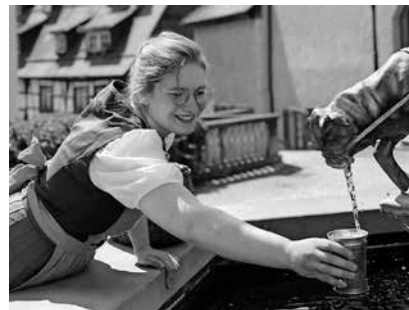
Die Tourist-Info lädt zur Schankmagdführung am 6. Juli ein.

gewachsen ist und plaudert so manche Geheimnisse der Stadt sowie Eigenheiten deren Bewohner aus. Der Stadtrundgang zeigt wie das wirkliche Leben im Pfullendorf des Jahres 1774 war. Treffpunkt ist vor der Tourist-Information am Marktplatz. Erwachsene bezahlen 5,- Euro, Kinder bis 12 Jahre sind frei. Eine Anmeldung bei der Tourist-Information unter Tel. 07552-251131 oder per E-Mail an tourist-information@stadt-pfullendorf.de ist aufgrund der beschränkten Teilnehmerzahl unbedingt erforderlich. Weitere öffentliche Termine für diese Erlebnisführung sind der 30. August und der 24. September.