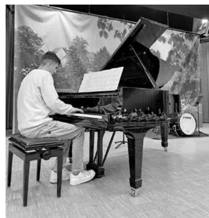
Die jungen Musiker begeisterten ihr Publikum.