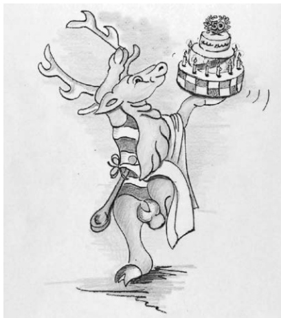
Der Landkreis Sigmaringen feiert mit zahlreichen Veranstaltungen sein 50-jähriges Bestehen. Auch das Kreiskulturforum widmet den diesjährigen Kulturschwerpunkt der Geschichte des Kreises.

23. Juni 2024, mit der bilanzierenden Ausstellung „50 Jahre Kulturförderung im Landkreis Sigmaringen“. Das gesamte Programm wird von der Hohenzollerischen Landesbank Kreissparkasse Sigmaringen und der Sparkasse Pfullendorf-Meßkirch großzügig unterstützt. Eine Übersicht zu den einzelnen Veranstaltungen ist im Internet auf der Seite www.landkreis-sigmaringen.de/kulturschwerpunkt zu finden. Darüber hinaus erscheint ein Programmheft, das über die Geschäftsstelle des Kulturforums Landkreis Sigmaringen, Landratsamt Sigmaringen, Stabsbereich Kultur und Archiv, Leopoldstraße 4, 72488 Sigmaringen erhältlich ist. Weitere Informationen gibt es unter der Telefonnummer 07571/102-1141 und per E-Mail: kreisarchiv@irasig.de .