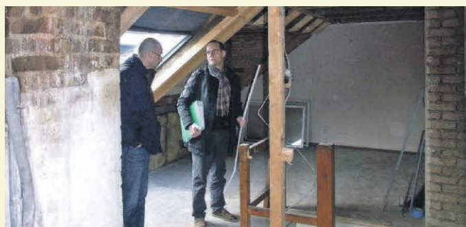
Ein Modernisierungs-Check bildet eine gute Grundlage, um die Sanierung oder Modernisierung eines Altbaus zu planen.

(djd). Das Thema Sanierung und Modernisierung steht bei vielen Besitzern älterer Immobilien auf der To-do-Liste. "Bevor man mit den Maßnahmen beginnt, sollte man sich über seine Sanierungsziele, das Budget und den aktuellen Zustand des Hauses im Klaren sein", rät Erik Stange, Sprecher des Verbraucherschutzvereins Bauherren-Schutzbund e.V. Mit einer Modernisierungsberatung kann man den aktuellen Gebäudezustand professionell erfassen und feststellen lassen, wo akuter Handlungsbedarf besteht und wo Verbesserungen wünschenswert sind. Unter www.bsb-ev.de/modernisierung kann der kostenlose "Ratgeber Bestandsimmobilie" bestellt werden, der auf über 40 Seiten umfassende Infos zu dem Thema liefert. Auf der Website gibt es zudem die Adressen unabhängiger Sachverständiger in ganz Deutschland.