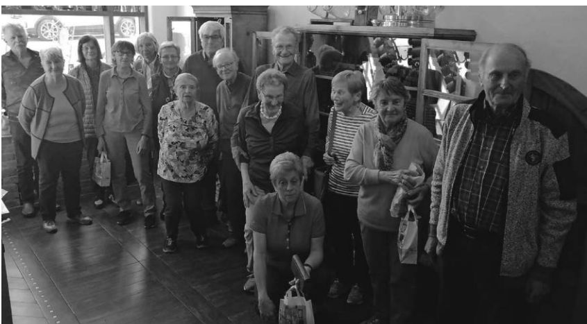
Die Mitglieder des Schwäbischen Albvereins besuchten den Zuckerbäcker in Langenenslingen.