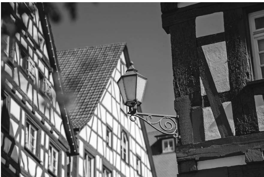
Die Tourist-Information veranstaltet am Tag des Fachwerks eine Fachwerkführung.

weise und frühere Handwerkskunst. Die Teilnehmer lernen während der Führung den für Süddeutschland typischen alemannischen Baustil kennen und erfahren mehr über den Unterschied zwischen konstruktivem Fachwerk und Sichtfachwerk und welche Bedeutung hinter den fantasievollen Schmuckformen an den Häusern steckt. Unterwegs begegnet ihnen der „Wilde Mann“. Die Führung beginnt um 10.30 Uhr auf dem Marktplatz und dauert etwa 90 Minuten. Die Teilnahmegebühr beträgt fünf Euro, Kinder bis zwölf Jahre sind kostenfrei. Eine Anmeldung ist nicht erforderlich.