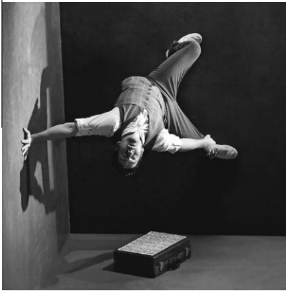
Der Künstler Tobias Wegner gastiert am 31. Mai mit seiner Illusionsshow Leo in der Stadthalle.

Mithilfe einer Live-Projektion sehen die Zuschauer zwei Bühnenräume gleichzeitig, wobei die Spiegelung zusätzlich um 90 Grad gedreht ist. Die natürliche Wahrnehmung wird dadurch völlig außer Kraft gesetzt. Das wortlose Spiel mit den Gesetzen der Schwerkraft ist Körpertheater auf hohem Niveau, das kein Schauspieler ohne artistische Ausbildung und langjähriges Training auf die Bühne zaubern könnte. Tobias Wegner ist Absolvent der renommierten École Supérieure des Arts du Cirque in Brüssel. Die künstlerische Leitung dieser atemberaubenden Performance hat der experimentierfreudige frankokanadische Schauspieler, Dramaturg und Regiestar Daniel Brière übernommen.