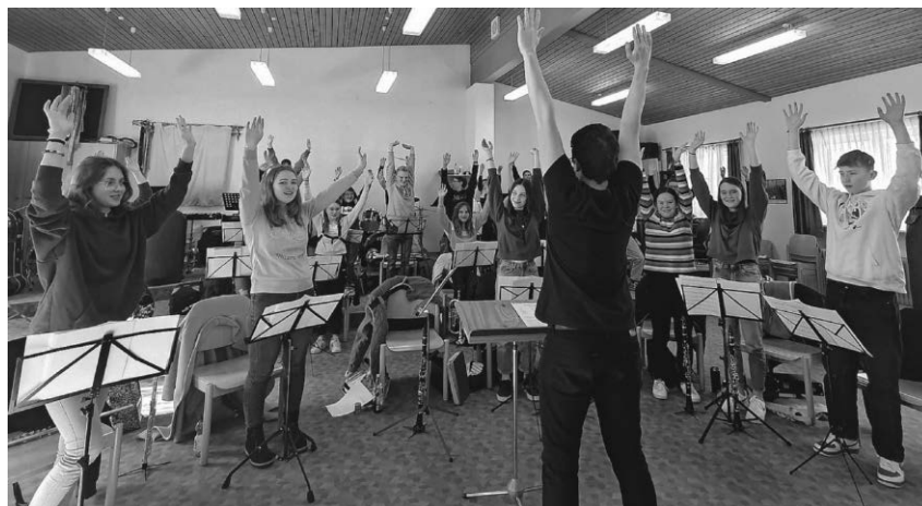
Die Jugendkapelle Burgweiler/Denkingen hat sich bei einem Probenwochenende auf die nächsten Auftritte vorbereitet.

Pfullendorf/pa - Die Bibelgruppe der Katholischen Gemeinde lädt zu Beginn der Karwoche am Montag, 3. April, zur Kreuzwegandacht ein. Beginn ist beim Kreuz am Neidling-Kindergarten. Es wird der Leidensweg Jesu in sieben Stationen bis zur Wallfahrtskirche Maria Schray gegangen. Bei Regen findet die Andacht in Maria Schray statt.