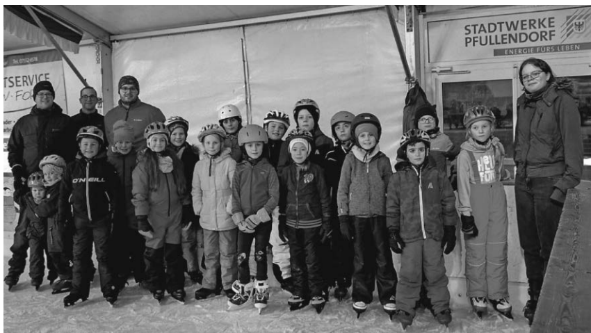
Der Schwimmnachwuchs der Pfullendorfer DLRG erlebte ein paar abwechslungsreiche Stunden im Eiszelt.

ten die Schwimmanfänger der Ortsgruppe Pfullendorf in der Deutschen Lebensrettungsgesellschaft Gelegenheit, ein paar Runden auf dem Eis zu drehen. Unterstützung gab es von den Stadtwerken, die den Eintritt für die Kinder und ihre Betreuer spendierten. Die Kids hatten viel Spaß auf dem Eis und dankten den Stadtwerken mit einem Gruppenbild.