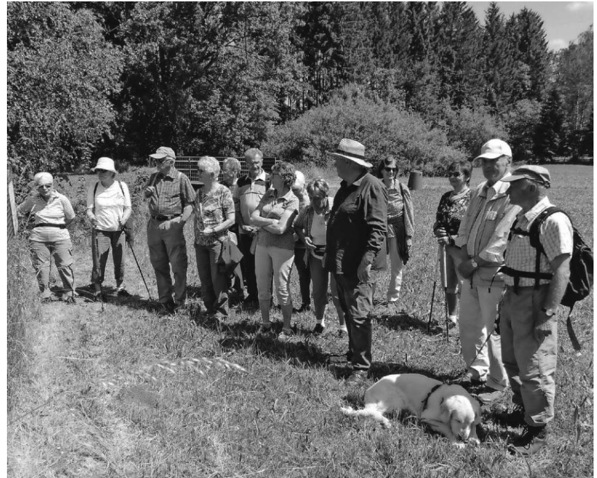
Die Ortsgruppe des SAV hat eine Natur-Erlebnis-Wanderung unternommen.

salpe und die Hoheggalpe ging es wieder nach Siebratsgfäll zurück. Eis sowie Kaffee und Kuchen rundeten den Tag vor der Heimfahrt nach Pfullendorf ab.