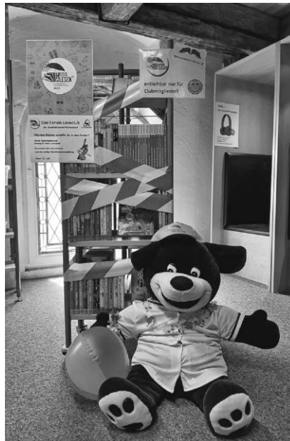
Am Freitag, 21. Juli, gibt Lesebär Benny die Sommertitel vom Ferienleseclub frei – nur für Clubmitglieder!

Pfullendorf/pa - Wer schafft die meisten Bücher während der Sommerferien? Das können Kinder zwischen 6 und 12 Jahren in Pfullendorf herausfinden, wenn sie beim Ferienleseclub „Heiß auf Lesen“ der Stadtbücherei mitmachen. Am Freitag, 21. Juli, startet die landesweite Aktion zur Leseförderung, für die rund 200 brandneue spannende oder lustige Sommertitel bereitstehen. Jeder Teilnehmer erhält bei der kostenfreien Anmeldung sein persönliches Leseloggbuch, um darin seine gelesenen Titel aufzulisten und zu kommentieren. In der Stadtbücherei gibt es dann für jedes gelesene Buch einen „Heiß-auf-Lesen“-Stempel. So kann jeder mitverfolgen, wie viele Bücher über die Ferienzeit schon gelesen wurden. Bei einer fröhlichen Abschlussveranstaltung erhalten schließlich alle Teilnehmer eine Urkunde, die drei fleißigsten Leser außerdem noch eine extra Belohnung. Die Stadtbücherei Pfullendorf bleibt über die Sommerferien durchgehend geöffnet, so dass es zum Ausleihen ausreichend Gelegenheit geben wird.