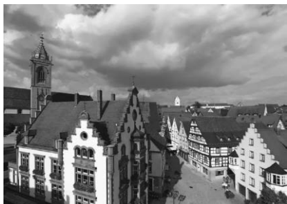
Die Tourist-Information lädt zu einer historischen Stadtführung durch die Pfullendorfer Altstadt ein.

Eine weitere historische Stadtführung findet am Sonntag, 29. Oktober um 10:45 Uhr statt.