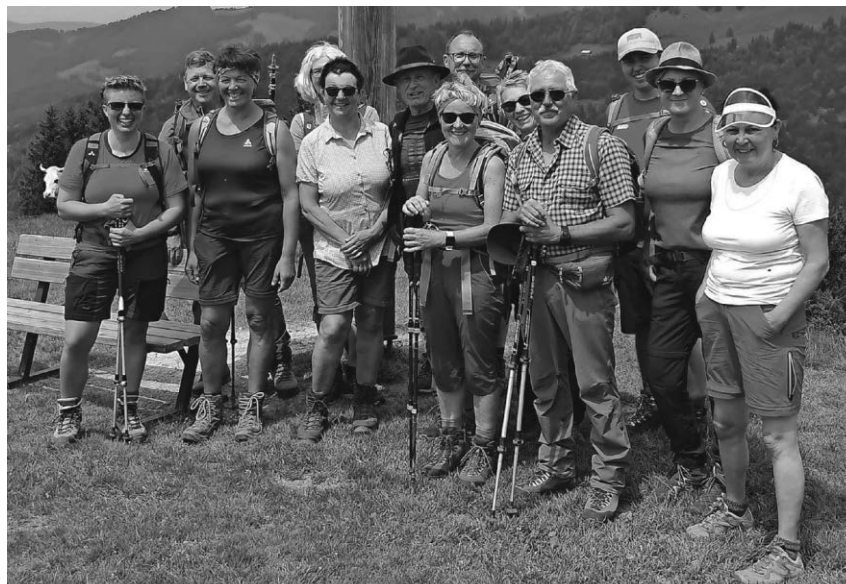
Die Sektion des DAV auf Ihrer Wanderung um das Renkknie.