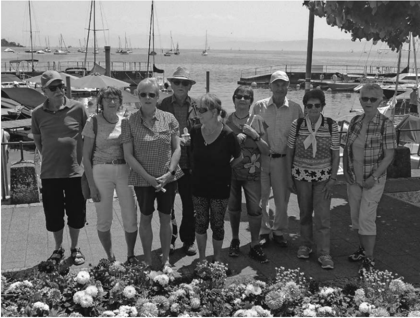
Die Ortsgruppe des SAV am Bodensee.