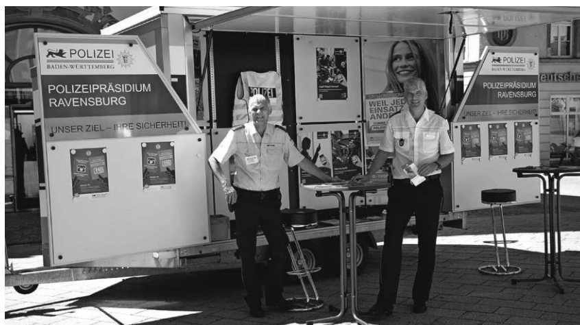
In den Sommerferien sind Polizisten des Präsidiums Ravensburg mit einem Präventionsstand auf den Wochenmärkten in der Region vertreten.

Pfrungen/pa - Leider werden seit längerer Zeit wichtige landwirtschaftliche Zufahrten ins Ried mit Autos zugeparkt. Dies behindert massiv die Arbeit der Landwirte: Weidetiere im Ried können nicht mit Wasser versorgt werden, die Gewinnung des Winterfutters wird eingeschränkt, Lohnunternehmer werden in Ihrer Arbeit blockiert! Daher werden die Besucher im Ried freundlich gebeten, ausschließlich die gut ausgebauten und kostenfreien Parkplötze rings ums Ried zu nutzen. Die Zufahrten zu den Flächen müssen frei bleiben, sonst können auch Einsatzfahrzeuge in