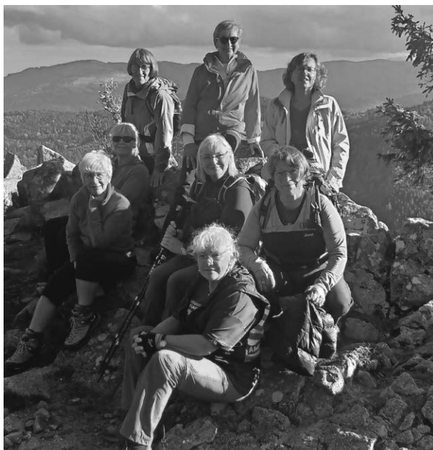
Die Wanderfreunde des DAV erlebten drei abwechslungsreiche Tage in den Hochvogesen.

Pfulendorf/pa - Die Sektion Pfulendorf im Deutschen Alpenverein hat eine dreitägige Wanderung in den Hochvogesen veranstaltet. Acht Wanderfreunde unternahm