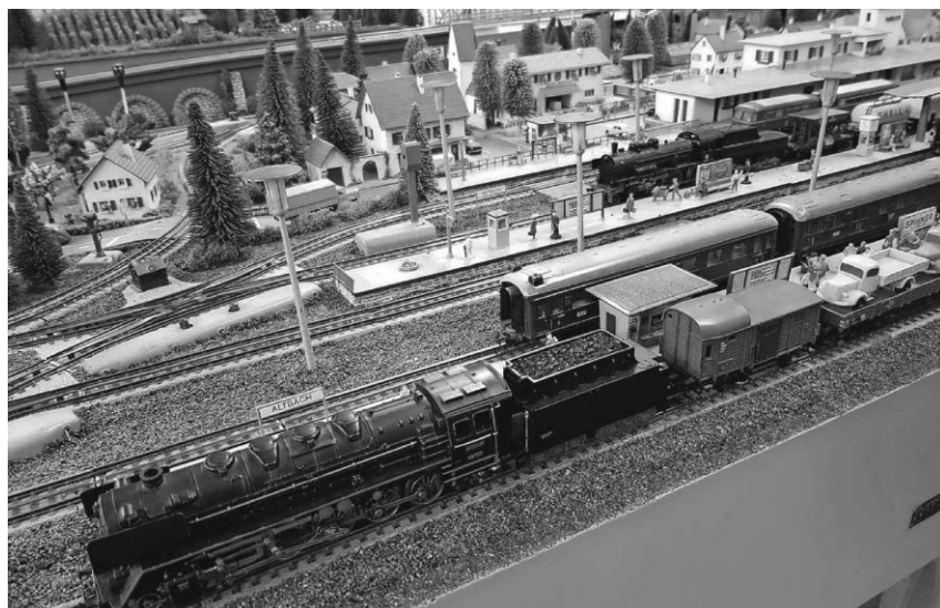
Der Modelleisenbahnclub veranstaltet wieder eine große Ausstellung in der Stadthalle.

Pfullendorf/pa - Die Sektion Pfullendorf im Deutschen Alpenverein lädt ihre Mitglieder am Wochenende vom 18. bis 20. November zum Hüttenputz im Haus Don Bosco ein. Vor der Wintersaison soll, wie in jedem Jahr, das vereinseigene Haus Don Bosco in Au im Bregenzerwald auf Vordermann gebracht werden. Die Anreise ist am Freitagabend oder Samstagmorgen, die Abreise am Samstagabend oder am Sonntag nach dem Frühstück vorgesehen. Der Hüttenwart freut sich auf viele Mitglieder, die mit anpacken. Eine besondere Einladung gilt den neuen Mitgliedern, denn der Hüttenputz ist immer eine gute Gelegenheit