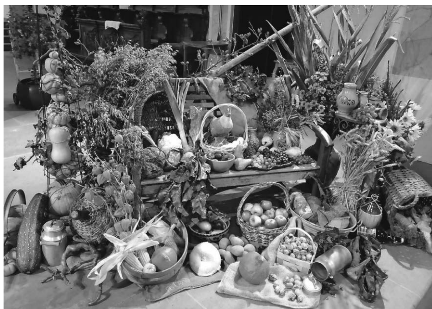
Den diesjährigen Altar zum Erntedankfest in der Stadtkirche St. Jakobus haben die Frauen vom Mitarbeiterkreis der Frauengemeinschaft gestaltet.

Pfullendorf/pa - Der Mitarbeiterkreis der katholischen Frauengemeinschaft hat in diesem Jahr den Erntedankaltar in der Stadtkirche St. Jakobus gestaltet. Reiche Gaben wie Feldfrüchte, Getreide, Obst und Blumen in bunten Herbstfarben waren auf dem Erntedankaltar zu finden, über den sich die Gemeinde freuen konnte. Mit dem Erntedankfest erinnern Christen an den engen Zusammenhang von Menschen und Natur. Gott für die Ernte zu danken, gehörte zu allen Zeiten zu den religiösen Grundbedürfnissen. Erntedank feiert den Reichtum und die Vielfalt, in der die Menschen hierzulande leben.