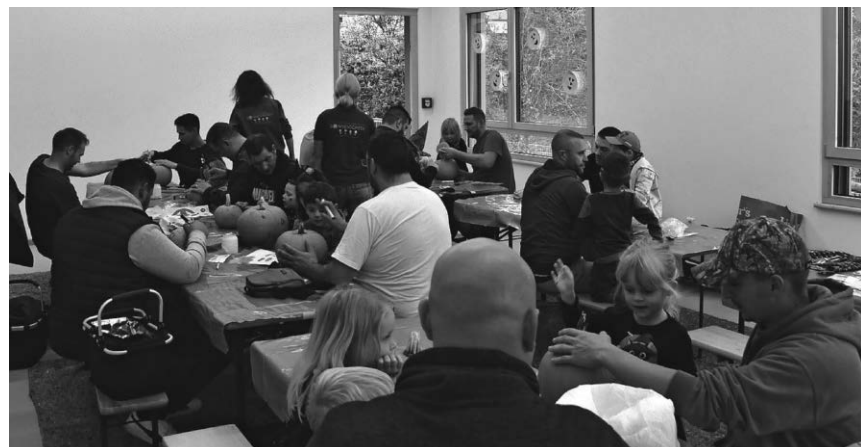
Beim Familienzentrum Sonnenschein schnitzten die Väter mit ihren Kindern tolle Kürbisgeister.