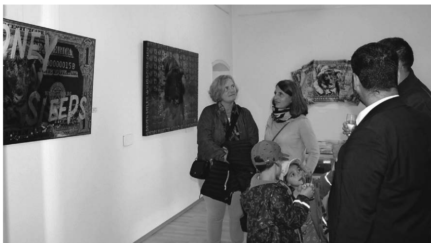
Die Besucher der Vernissage waren von den in außergewöhnlichen Techniken gefertigten Bildern beeindruckt.

Pfullendorf/hsg - Die Stadtwerke teilen mit, dass in der Zeit vom 9. November bis 6. Dezember im Auftrag der Regionalnetze Linzgau die Jahresablesung der Strom-, Gas- und Wasserzähler durchgeführt wird. Die Zählerstände werden stichtags-