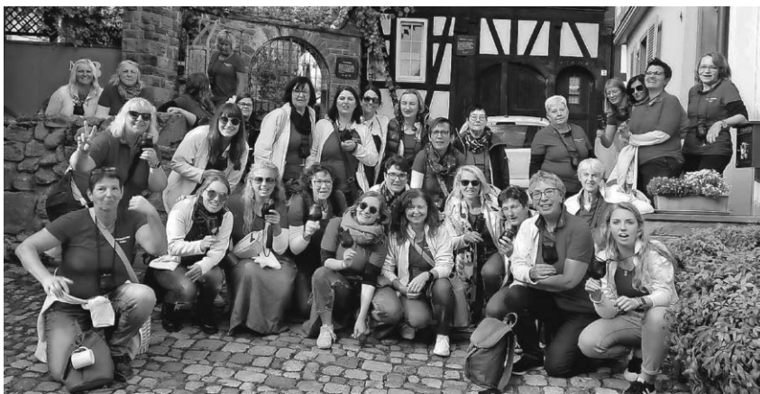
Die Nidler-Frauen erlebten bei ihrem Ausflug ein kurzweiliges Wochenende in der Ortenau.