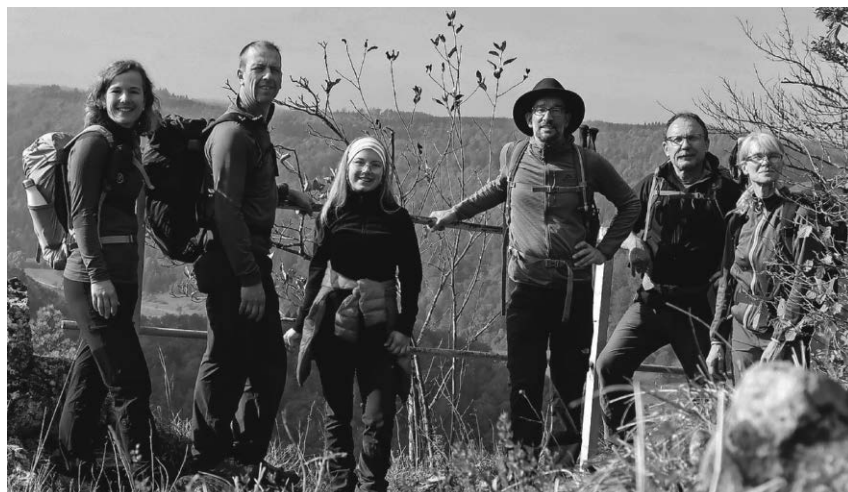
Der DAV unternahm eine Wanderung im Donautal.

Pfullendorf/pa - Die Sektion Pfullendorf im Deutschen Alpenverein hat eine dreitägige Tour auf dem 50 Kilometer langen Sentiero Quattro Valli vom Comer zum Luganer See veranstaltet. Der Weg führte von Breglia, einem Bergdorf oberhalb des Comer Sees, zum Rifugio Menaggio zur ersten Übernachtung. Am zweiten Tag wanderte die Gruppe weiter zum Monte Grona zum Kirchlein St. Amate nach Malè. Der