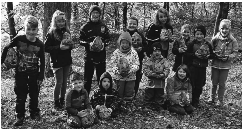
Die Kinder der Holzhaudere-Zunft haben in diesem Jahr Rübengeister geschnitzt.