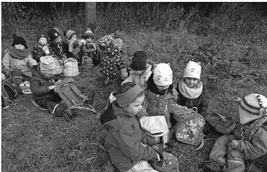
Die Kinder des Kindergartens Denkingen erlebten einen abwechslungsreichen Tag in der Natur.

Sonntag, 28. November, 15 Uhr Puppentheater „Der verhexte Tannenbaum“ Anmeldung: 07585/3315