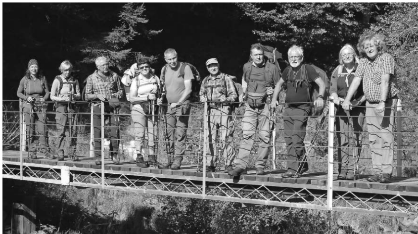
Die Bergfreunde des DAV waren auf dem Sentiero Quattro Valli unterwegs.

dritte Tag war mit 23 Kilometern und 1100 Höhenmetern die Königs- etappe durch das Val Cavargna. Der letzte Tag führte vom Val Cavargna zum Passo San Lucio an die Schweizer Grenze und über das Val Rezzo und das Val Solda nach Dasio, einem Dorf oberhalb des Luganer Sees.