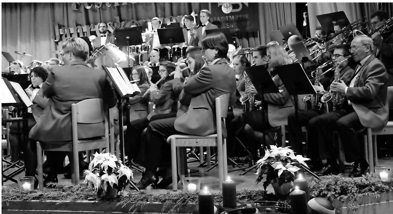
Die Stadtmusik lädt am 15. Dezember wieder zum festlichen Jahreskonzert in die Stadthalle ein.

Otterswang/stt - Unter dem Motto „Mit Musik kommt Sonne in den Herbst“ haben die Musikvereine aus Otterswang und dem Maßkir- cher Ortsteil Rengetswailer auch in