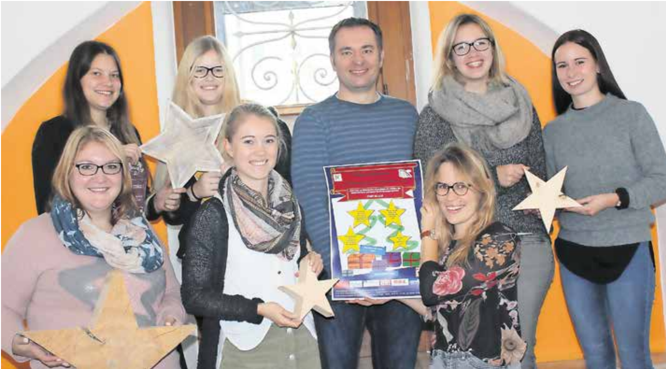
Das Team des Kinder- und Jugendbüros veranstaltet in diesem Jahr wieder eine Weihnachtsaktion, bei der Kinder aus Familien mit kleinem Geldbeutel oder schweren Schicksalsschlägen ein Weihnachtsgeschenk erhalten. 100 Sterne mit Kinderwünschen im Wert von etwa 20 Euro liegen bei den teilnehmenden Geschäften zur Abholung bereit. Das Team hofft auf eine ähnlich gute Resonanz und Hilfsbereitschaft der Bevölkerung wie im vergangenen Jahr, damit alle Kinderwünsche in Erfüllung gehen können.

Amtliches Mitteilungsblatt der Stadt Pfullendorf und ihrer Stadtteile Aach-Linz, Denkingen, Gaisweiler, Großstadelhofen, Mottschieß, Otterswang, Zell a. A.