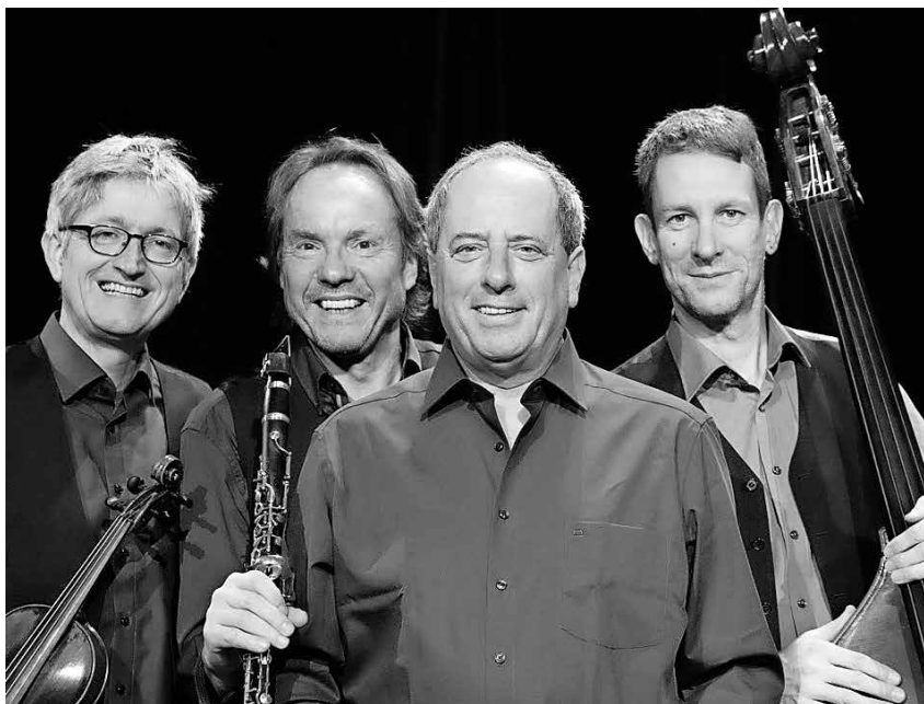
Das Quartett „Jontef“ ist am Freitag mit Klezmer-Musik im Café Moccacfloor zu Gast.