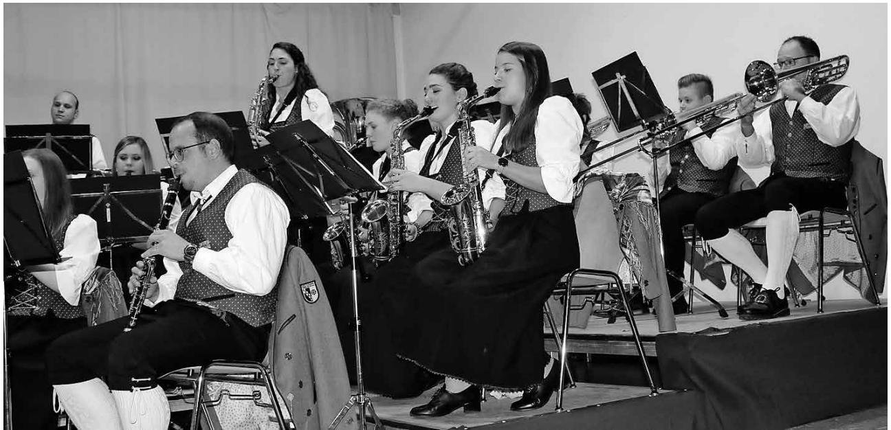
Der Musikverein Otterswang unterhielt beim Gemeinschaftskonzert in Rengetsweiler mit einem abwechslungsreichen Programm auf hohem Niveau.