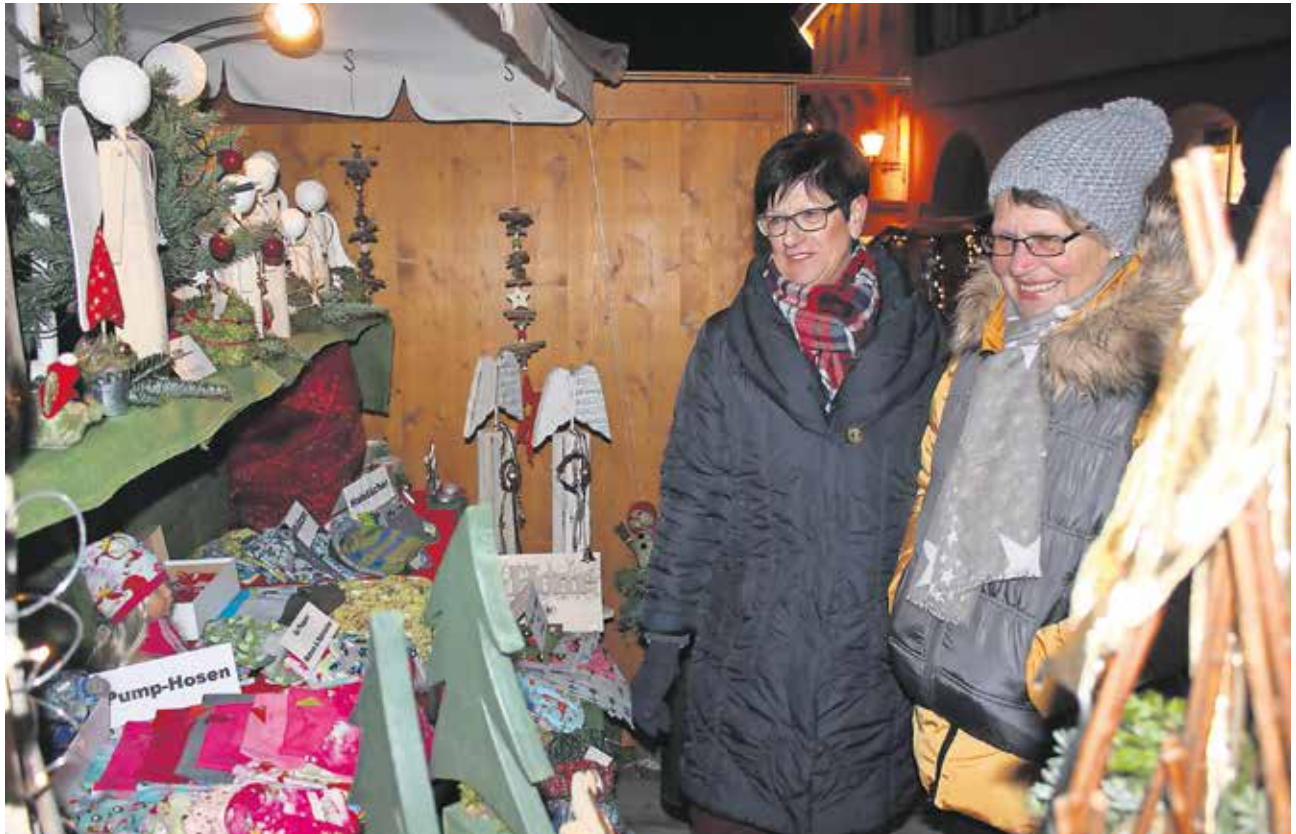
Der Pfullendorfer Adventszauber, der am 7. und 8. Dezember stattfindet, verwandelt den Marktplatz wieder in ein zauberhaftes Wintermärchen.

Pfullendorf/hsg - Traditionell laden die Stadt und die Wirtschaftsinitiative Pfullendorf am zweiten Sonntag