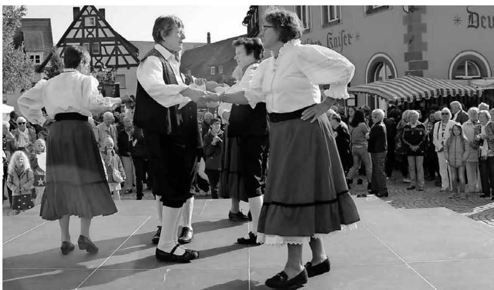
Die Frauen der Seniorentanzgruppe unterhielten das Publikum mit ihren Tänzen.