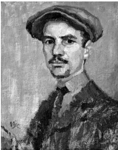
In der Kreisgalerie in Meßkirch wird am Sonntag eine Ausstellung mit Künstlern des ausgehenden 19. Jahrhunderts gezeigt, die an der Oberen Donau geboren wurden.