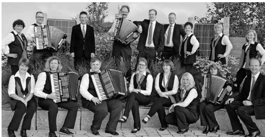
Das Akkordeon-Orchester Ach-Linz lädt am Samstag zum Herbstkonzert in den Saal des Haus Linzgau ein.