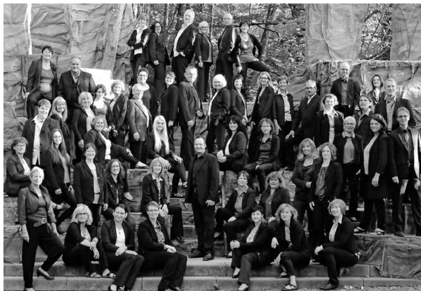
Der Chor „Akzente“ veranstaltet am Sonntag in der Stadtkirche ein Benefizkonzert zugunsten des neuen Kolpinghauses.