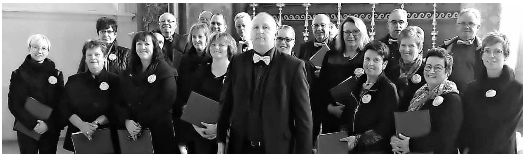
Der Kirchenchor Otterswang gestaltete ein Konzert in der Beuroner Abteikirche.

Donnerstags, 16.30 – 21 Uhr Jugendhaus, Offener Treff für Jugendliche ab Klasse 5 Freitags, 13 – 15.30 Uhr Sechslinden-Schule, Kochwerkstatt Freitags, 14.30 – 16 Uhr Jugendhaus, Kids-Treff für Grundschüler Freitags, 16.30 – 21 Uhr