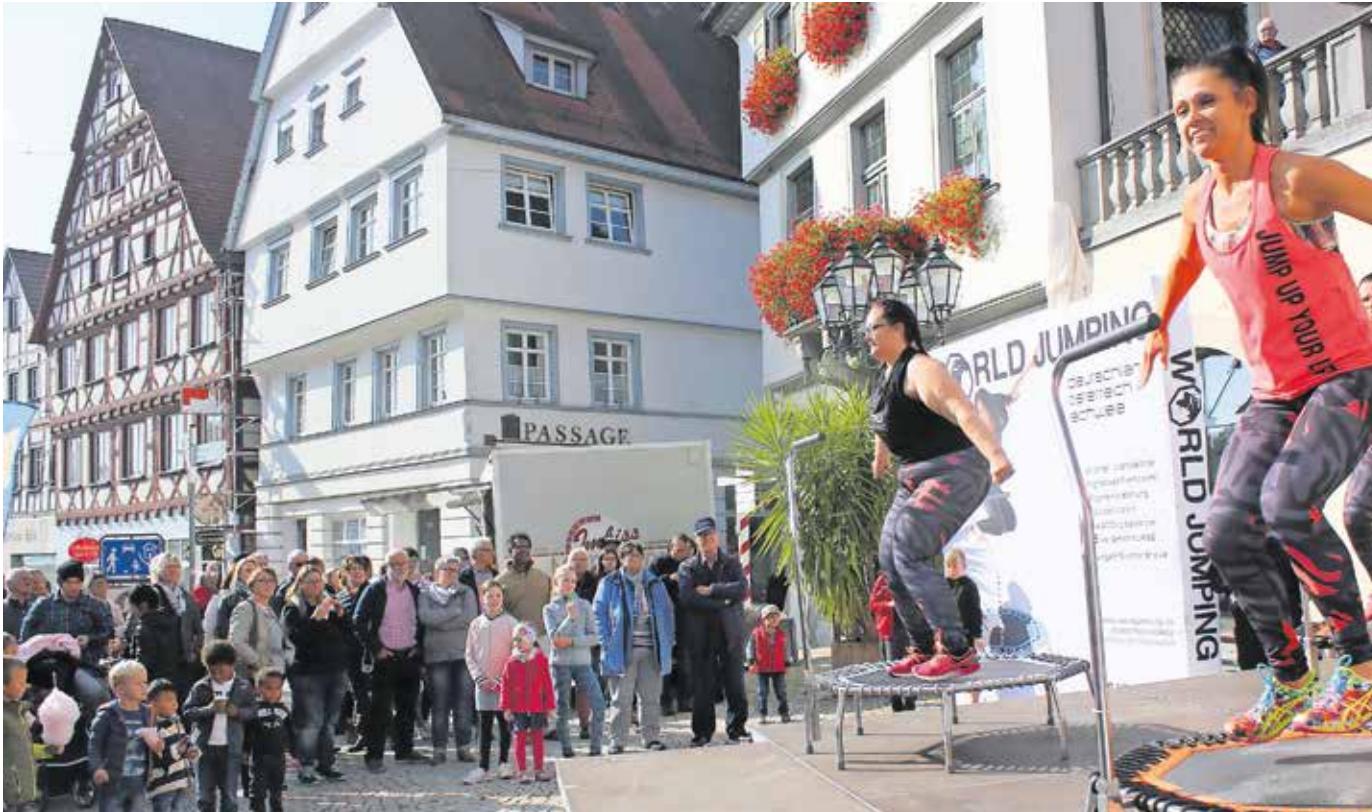
Beim „Pfullendorfer Herbst“ war viel los in der Stadt. Mittelpunkt war der Marktplatz, wo verschiedene Vorführungen stattfanden. Darunter die Jumping-Frauen vom Sportcenter Barz, die zeigten, wie viel Spaß Sport auf dem Trampolin macht.

Amtliches Mitteilungsblatt der Stadt Pfullendorf und ihrer Stadtteile Aach-Linz, Denkingen, Gaisweiler, Großstadelhofen, Mottschieß, Otterswang, Zell a. A.