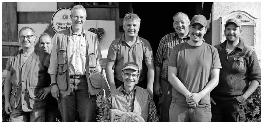
Die Jäger des Hegerings haben sich mit einem Schießwettkampf auf die Bewegungsjagd vorbereitet.

Pfullendorf/pa - Die Pfullendorfer Jäger haben sich auf die Bewegungsjagd mit einem Schießwettkampf vorbereitet. Diese Form der Jagd, bei der Waldstücke von Jägern umstellt und die Tiere mit Treibern und Hunden aus ihrer Deckung „gedrückt“ werden, ist vor allem notwendig, um den Bestand der vermehrungsfreudigen Wildschweine einzudämmen. Wildschweine vermehren sich, wenn sie nicht intensiv bejagt werden, vierfach in einem Jahr. Neben der Eindämmung von Schäden in der Landwirtschaft ist auch die drohende Afrikanische Schweine-