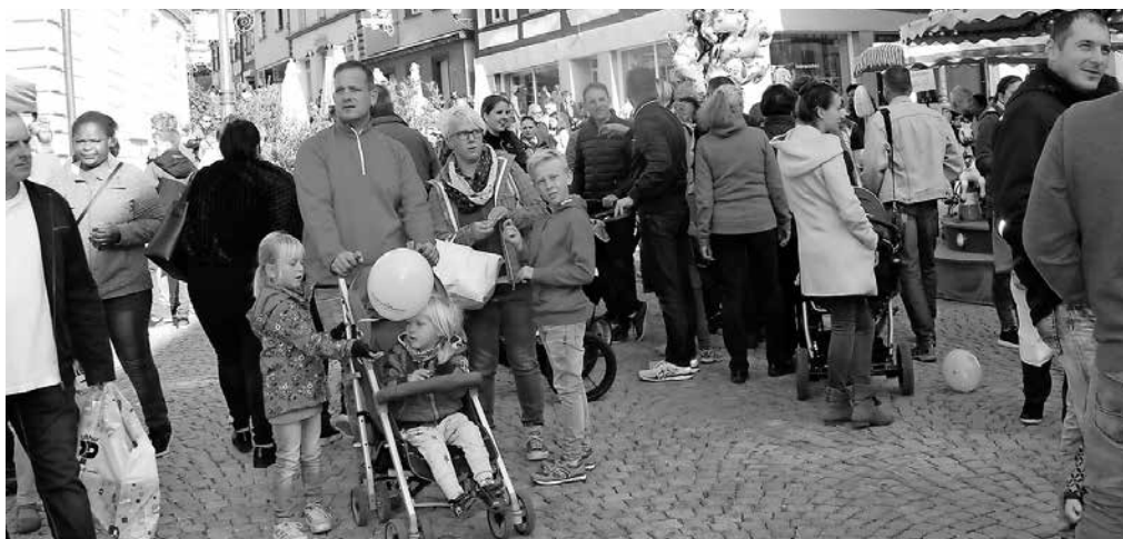
Der „Pfullendorfer Herbst“, bei dem auch die Einzelhändler ihre Türen öffneten, lockte viele Besucher in die Stadt.