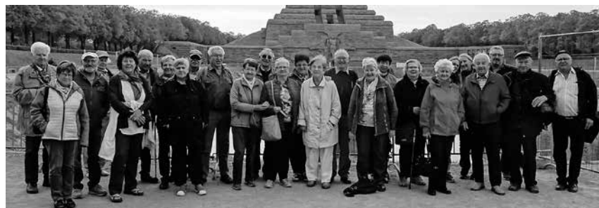
Die Mitglieder des VdK erlebten abwechslungsreiche Tage in Leipzig.

Pfullendorf/pa - Fünf außergewöhnliche Tage in Leipzig haben die Mitglieder der Ortsgruppe Pfullendorf im Sozialverband VdK erlebt. Die