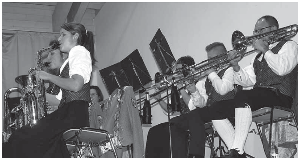
Die Otterswanger Musikanten trugen mit einem unterhaltsamen Programm auf hohem Niveau zum Gelingen des Doppelkonzerts in Rengetsweiler bei.

ab, die natürlich ebenfalls erst nach einer Zugabe von der Bühne gehen durften. Bemerkenswert: In den Reihen