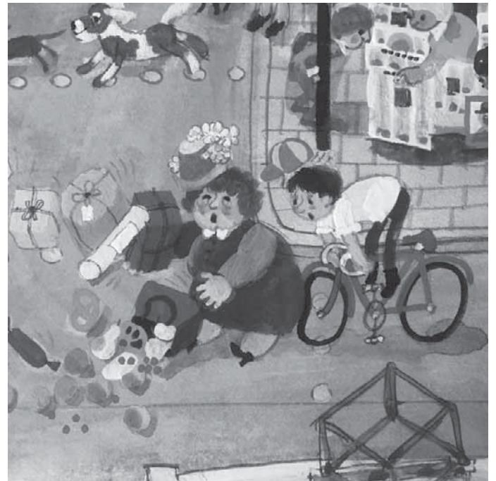
Noch bis Sonntag werden in der Städtischen Galerie „Alter Löwen“ die Bilder und Traumkästchen von Ali Mitgutsch gezeigt.

Pfullendorf/hsg – Wer noch die Ausstellung „Vom Wimmelbild bis zum Traumkästchen“ mit Bildern und Installationen von Ali Mitgutsch sehen will, hat dazu bis Sonntag, 17. Dezember, Zeit. Aus der nahen, weiten und sogar sehr weiten Entfernung, auch aus der Schweiz und aus Öster-