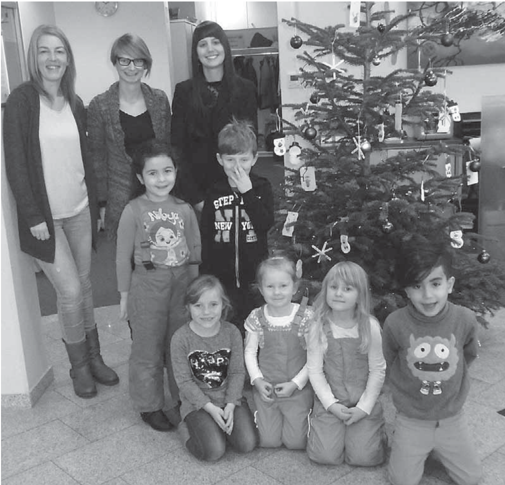
Die Vorschulkinder der Tagesstätte am Stadtgarten schmückten mit ihren Erzieherinnen den Weihnachtsbaum in der Filiale der Volksbank Bad Saulgau.