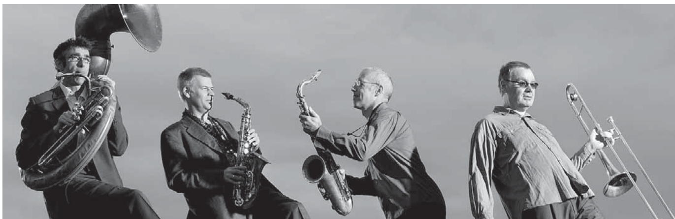
Die Talking Horns gastieren im Café Moccafloor.

Pfullendorf/pa – Die Talking Horns gastieren am Donnerstag, 21. Dezember, mit ihrem Programm „Why Nachten:; Ist das noch Musik oder schon ein Weihnachtslied?“ im Café Moccafloor. Beginn ist um 20 Uhr, Einlass ab 19 Uhr. Karten für 14 Euro gibt es im Café, Telefon 07552-408893, und bei der Tourist-Information, Telefon 07552-251131. Die Talking Horns