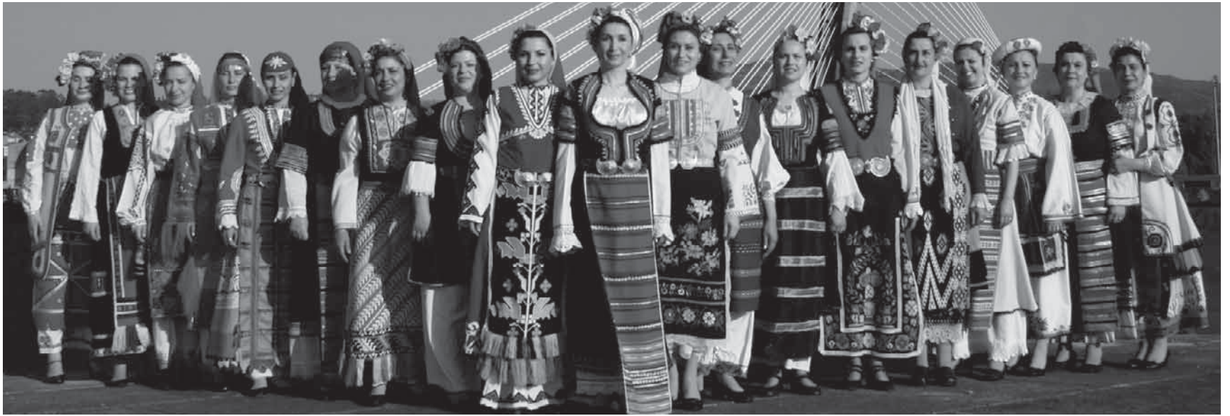
Der Chor "Bulgarian Voices" ist am Freitag in der Christuskirche zu Gast.