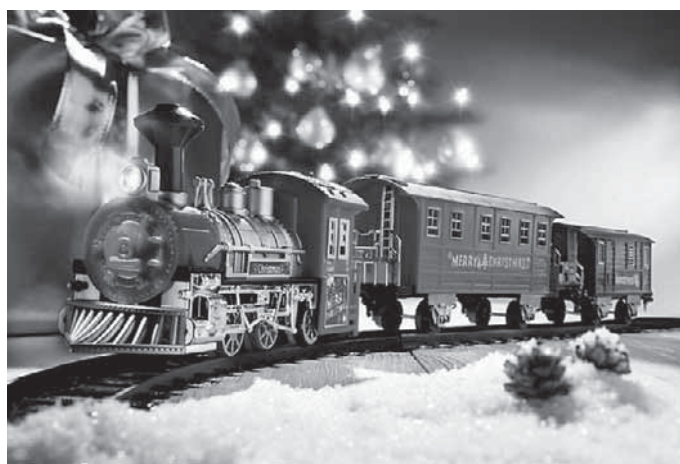
Die Modelleisenbahner laden am Sonntag zu einem vorweihnachtlichen Tag der offenen Tür ein.

Pfullendorf/pa – Die Sektion Pfullendorf im Deutschen Alpenverein hat die Langlaufloipe