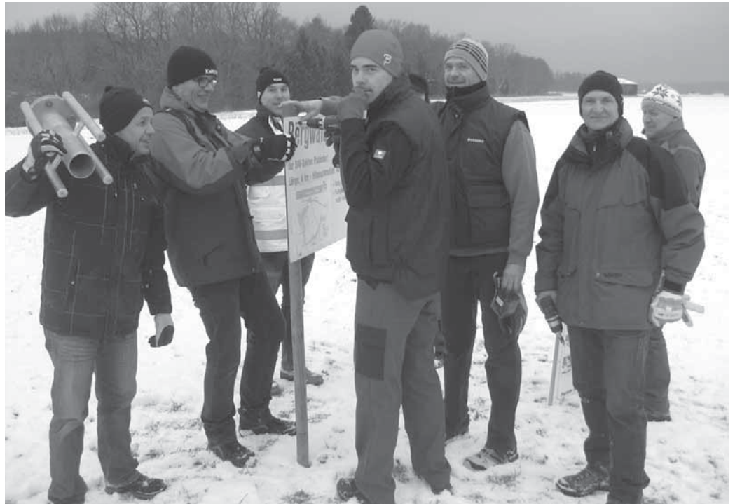
Das Langlauf-Team des DAV hat die Loipe beim Bergwald für den Winter vorbereitet.