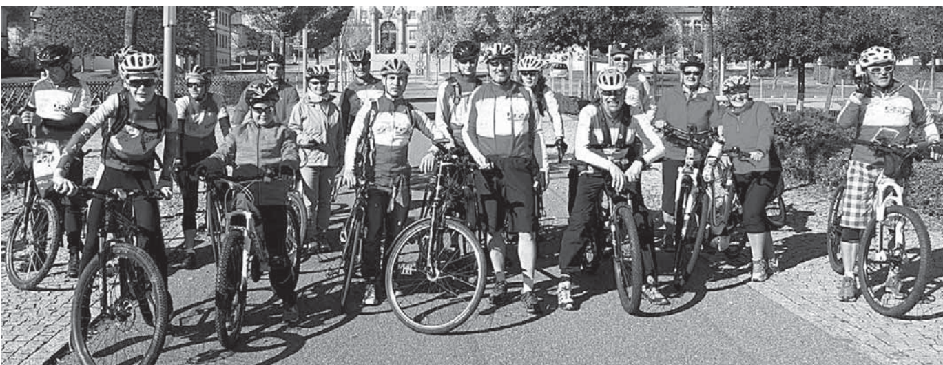
Die Abschlussfahrt des Radler-Clubs führte von Aulendorf über Altshausen zurück zu einer Einkehr nach Pfullendorf.