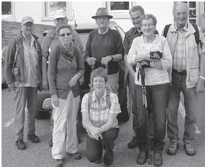
Eine Gruppe des Schwäbischen Albvereins war vier Tage lang im Schwarzwald unterwegs.

Pfullendorf/pa – Auch in diesem Jahr hat die Ortsgruppe Pfullendorf im Schwäbischen Albverein eine interessante Viertageswanderung im Schwarzwald angeboten. Am Geisberg, einem Höhenrücken zwischen den Tälern von Kinzig, Elz und Schutter, begannen die Wanderungen. Die Ziele waren Elzach und Haßloch, die Burgruine Geroldseck und Lahr. Acht Wanderer waren vom abwechslungsreichen Programm begeistert. Sie bekamen nicht nur hinsichtlich der gelaufe-