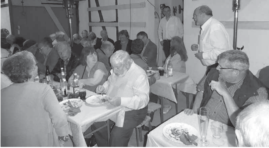
Der Heimat- und Museumsverein feierte seinen 30. Geburtstag mit einem Fest für die Mitglieder.