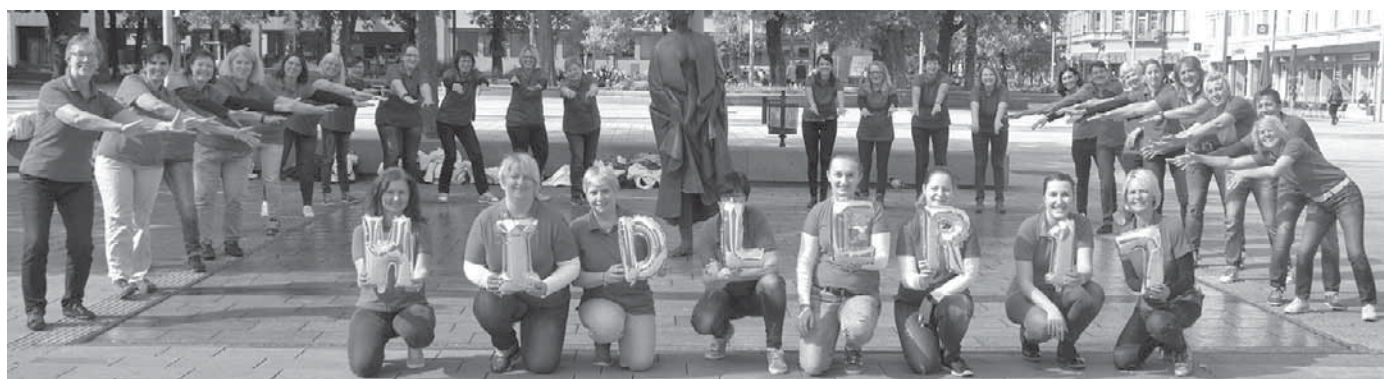
Die Nidler unternahmen ihren diesjährigen Ausflug nach Augsburg.