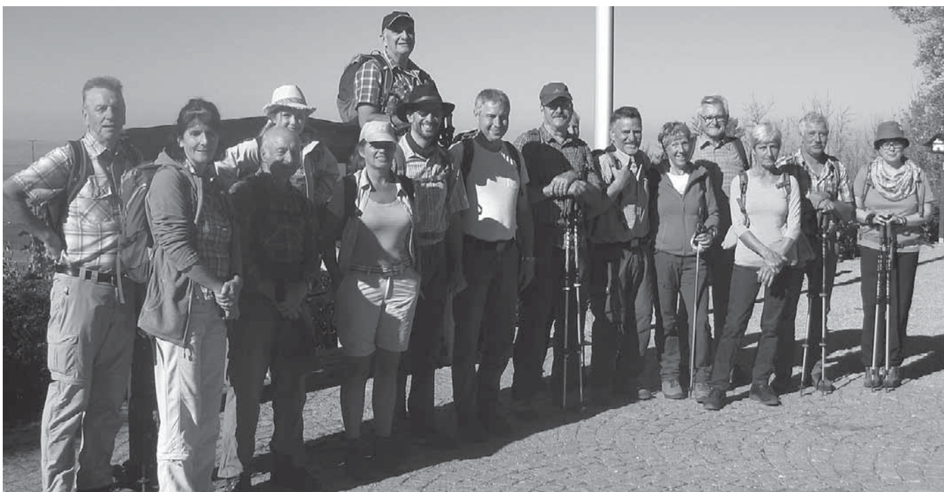
Die Wanderfreunde des DAV erklimmen den Dreifaltigkeitsberg.