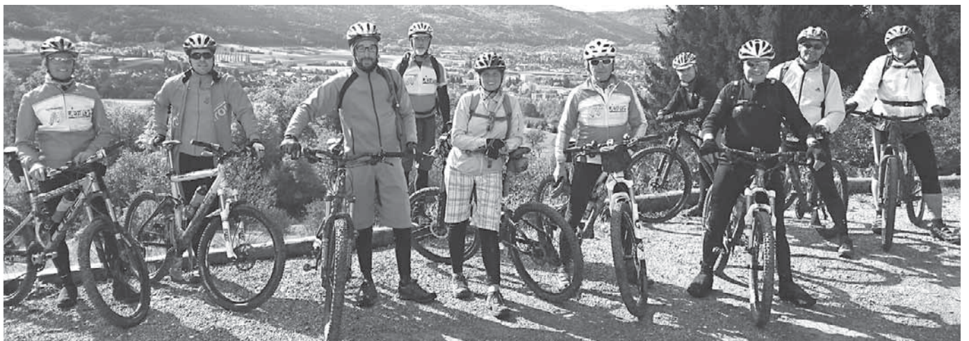
Die Mountainbiker des DAV waren zum Saisonabschluss auf der Schwäbischen Alb unterwegs.

wurde dann mit einem gemeinsamen Abendessen fortgesetzt, bei dem alte Geschichten und Begebenheiten in Erinnerung gebracht wurden.