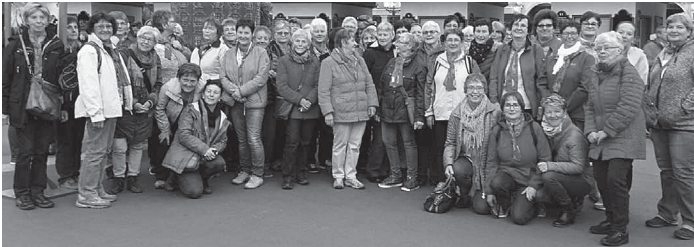
Die Frauengemeinschaften in Pfullendorf und den umliegenden Dörfern besuchten die Jubiläumsfeier in Rust.