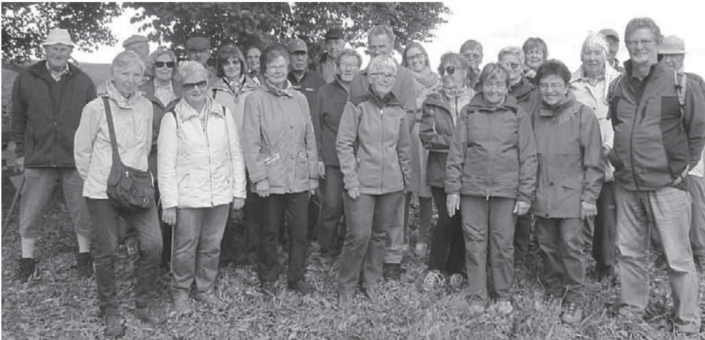
Die Mitglieder des Schwäbischen Albvereins waren rund um Heiligenberg unterwegs.