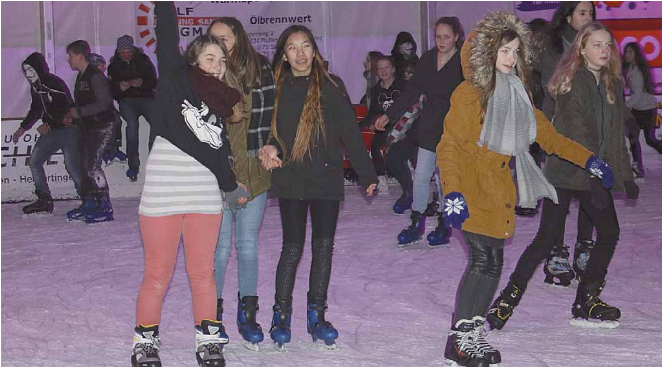
Das Eiszelt im Seepark eröffnet am Freitag mit einer Eisdisco die neue Schlittschuhsaison. Voraussichtlich bis 4. Februar lädt das Zelt zu winterlichem Sportvergnügen auf zwei Kufen ein. Detaillierte Angaben zu Eintrittspreisen, Öffnungszeiten oder Reservierungsmöglichkeiten befinden sich im Innenteil unter Stadtnachrichten.

Amtliches Mitteilungsblatt der Stadt Pfullendorf und ihrer Stadtteile Aach-Linz, Denkingen, Gaisweiler, Großstadelhofen, Mottschieß, Otterswang, Zell a. A.