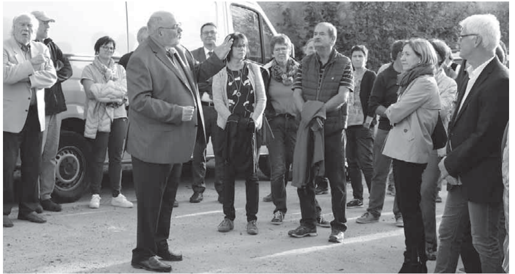
Die Seelsorgeeinheit Oberer Linzgau feierte das Richtfest am neuen Gemeindezentrum.

Pfullendorf/pa – Die Seelsorgeeinheit Oberer Linzgau hat das Richtfest für ihr neues Gemeindezentrum an der Adolf-Kolping-Straße gefeiert. Mitglieder der Kirchengemeinde, Pfarrgemeinderäte, Vertreter der beteiligten Firmen und weitere Gäste nutzten die Gelegenheit, sich zumindest im Erdgeschoss und von außen einen ersten Eindruck zu verschaffen. Ober- und Dachgeschoss waren aus Sicherheitsgründen noch gesperrt. Wegen Mängeln in der Bausubstanz war das bisherige Kolpinghaus Anfang dieses Jahres abgerissen worden. An der gleichen Stelle entsteht nun das neue Gemeindezentrum mit einem Saal, einer Küche, Toiletten und Technik im Erdgeschoss, vier Gruppenräumen im Obergeschoss sowie einem Archivraum, einem Lager und einem Raum für den Haus-