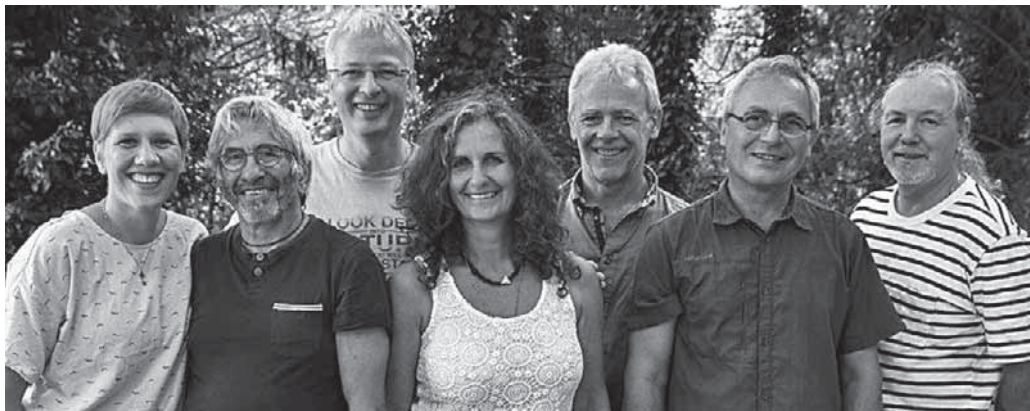
Die Gruppe »Lanigan's« ist mit irisch-schottischem Folk im Gasthaus »Lamm« zu Gast.

Pfullendorf/pa – Die irische Folkgruppe „Lanigan's“ aus Lin-