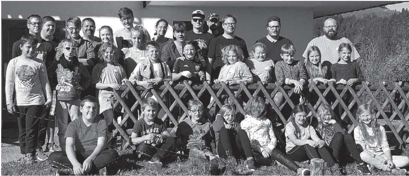
Die Jugend der DLRG erlebte ein tolles Hüttenwochenende.