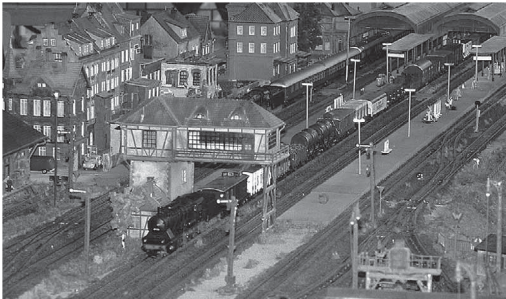
Der Modelleisenbahn-Club lädt am Wochenende zur großen Modellbahnausstellung in die Stadthalle ein.

Wald/pa - Der Brauchtumsverein Walbertsweiler lädt am Samstag, 18. November, zum traditionellen Kesselfleischessen ins Dorfgemeinschaftshaus Walbertsweiler ein. Beginn ist um 16 Uhr. Es wird Schlachtplatte direkt aus dem Kessel, Bauernbrot und Most.