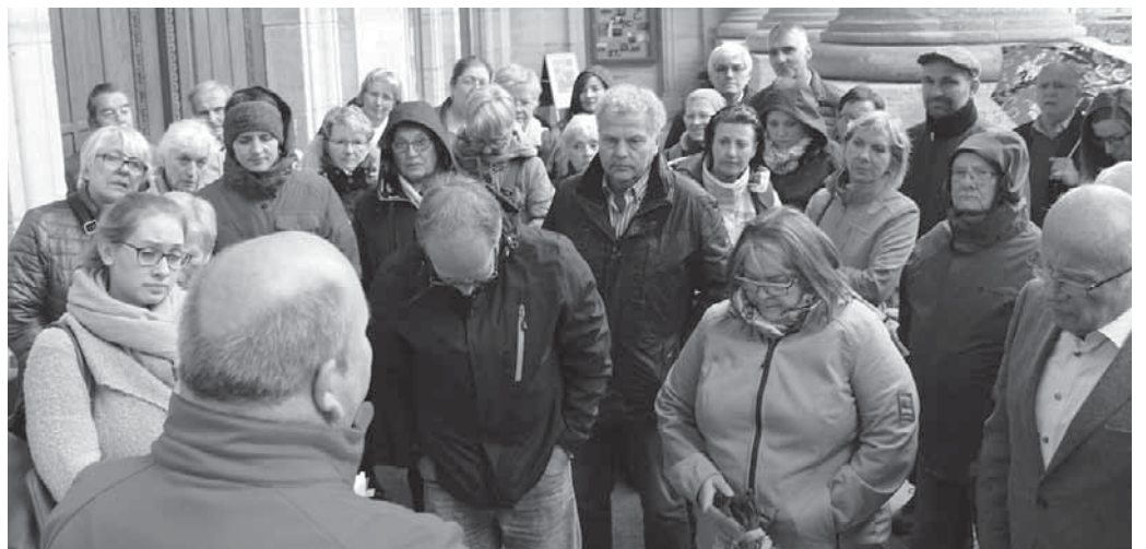
Der Gesangverein besuchte bei seinem Ausflug St. Blasien im Schwarzwald.