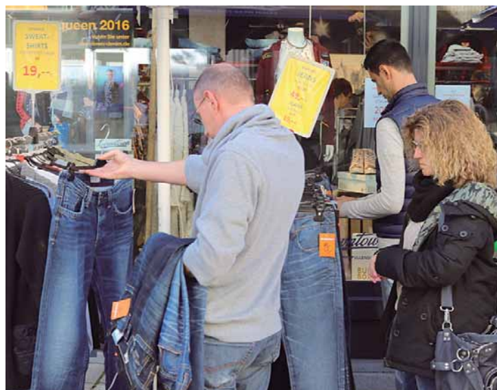
Die Geschäfte in der Stadt bieten attraktive Sonderaktionen an.