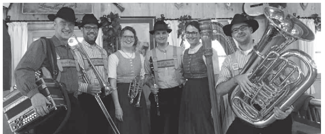
Beim dreitägigen Brauereifest im »Lamm« spielt am Samstag die Kapelle Spundlochmusik zum Tanz auf.