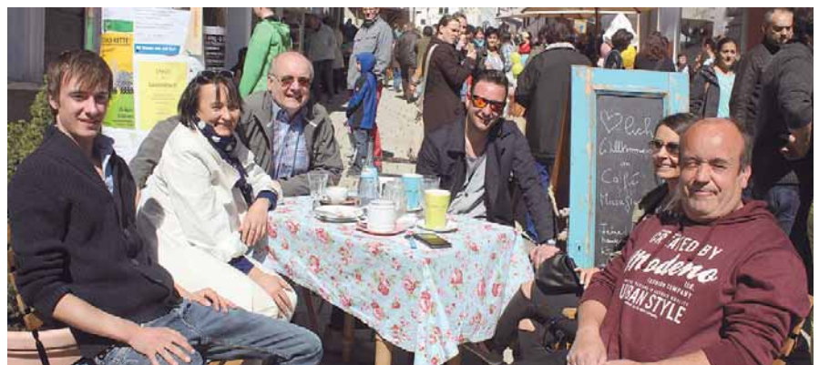
Der Wetterbericht verspricht einen sonnigen Sonntag, sodass die Besucher ihren Nachmittagskaffee in einem der Gartencafés genießen können.