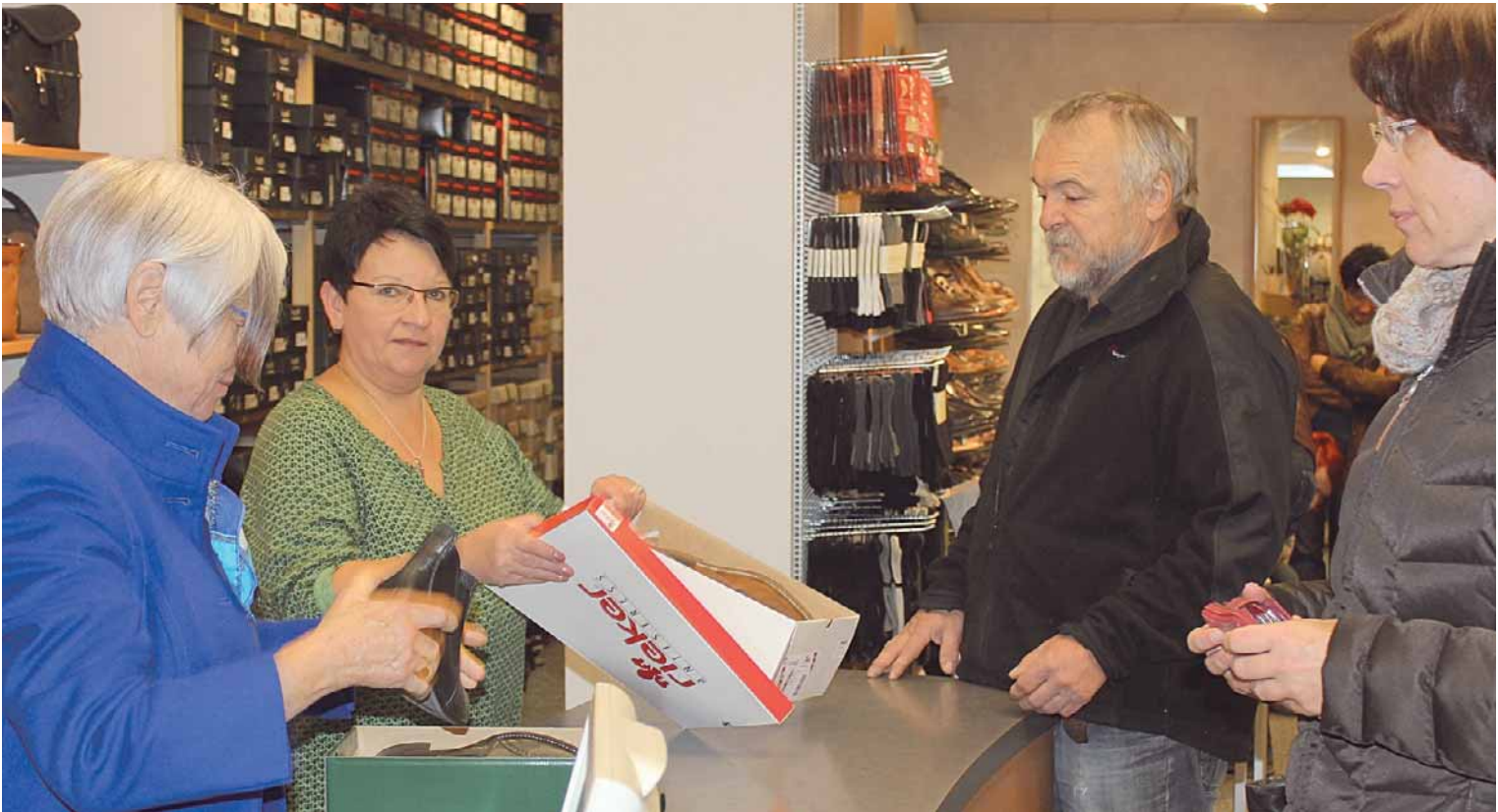
Die Mode- und Schuhgeschäfte bieten Modisches und Warmes für die kalte Jahreszeit an.