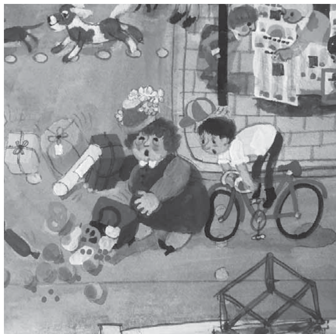
Die Wimmelbilderbücher von Ali Mitgutsch kennen und lieben Kinder und Erwachsene gleichermaßen. Ab Sonntag werden die Bilder und vieles mehr des großen Künstlers in der Galerie »Alter Löwen« ausgestellt.

der Städtischen Galerie „Alter Löwen“ ist es gelungen, so viele Wimmelbilder wie noch niemals in einer Ausstellung zu sehen waren, nach Pfullendorf zu holen. Jedoch gibt es in Pfullendorf in der großen Retrospektive über sein Lebenswerk noch viel