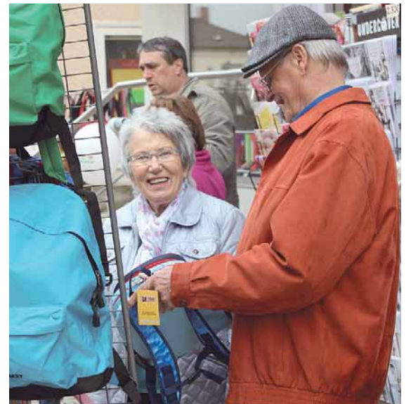
Die Fachgeschäfte in der Innenstadt halten viele interessante Angebote bereit.

von Posamentenknöpfen. Musikalisch warten kleine Klavierkonzerte auf die Besucher, die „kleine Countryband“ oder die feinen Töne selbstgefertigter Klangspiele. Wer es sportlicher mag, kann sich in die Kunst des Einradfahrens einweisen lassen, Tangotänzern bei ihren Schrittfolgen auf die Füße schauen, sich in den fließenden Bewegungen des Bauchtanzes üben oder beim Tanz im Sitzen mitmachen. Für die kleinen Besucher wird ein Pizzabacken angeboten und wer Lust hat, kann an einem Kunsthandwerkerstand kleine Kerzenhalter fertigen oder in der Stadtbücherei edle Papiere schöpfen. Dazu zeigen die Kleintierzüchter ihre Tiere, der Imkerverein informiert über die Bienenzucht und die Modelleisenbahner lassen ihre Züge fahren. Damit die Festbesucher auch alle Angebote finden, gibt es auf dem Marktplatz einen Stand, an dem ein Flyer mit allen Programmpunkten und Örtlichkeiten abgeholt werden kann. Die offizielle Eröffnung des Fests der Generationen ist um 14 Uhr auf dem Marktplatz durch Bürgermeister Thomas Kugler.