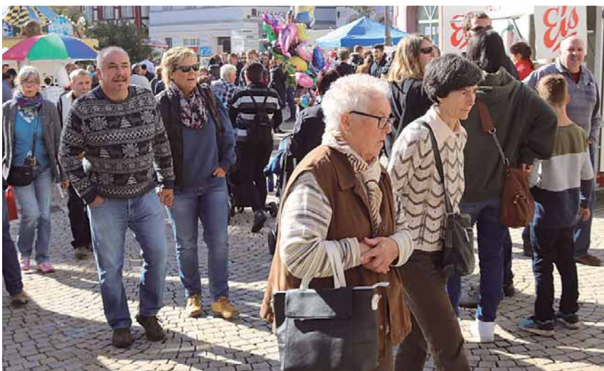
Die Besucher des Generationenfests dürfen sich auf ein abwechslungsreiches Programm freuen.