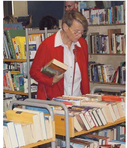
In der Stadtbücherei gibt es einen riesigen Bücherflohmarkt.

kennt. Die Ausstellung ist am Nachmittag geöffnet und kann ohne Eintritt besichtigt werden. Dazu verkehrt der Radexpress Oberschwaben, der seine Haltestelle am Stadtgarten hat. Viele Vereine und Einrichtungen stellen ihre Angebote an Informationsständen vor, darunter auch das Netzwerk 50plus, der Gesangverein oder der Ortsverband Pfullendorf im Sozialverband VdK, der übrigens beim Hechtbrunnen auch wieder einen Flohmarkt veranstaltet.