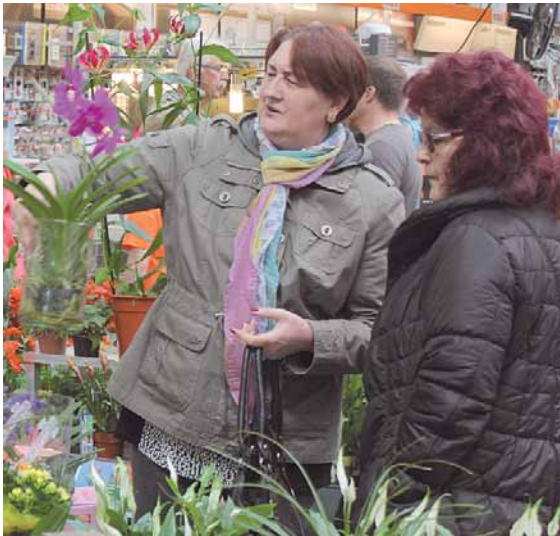
Blumen und Zierpflanzen bringen in den Wintermonaten ein bisschen Farbe ins Haus.