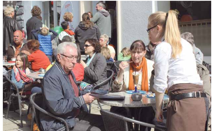
Die Bewirtungsbetriebe rund um den Marktplatz laden vielleicht zum letzten Mal in diesem Herbst zu einer Verschnaufpause unter freiem Himmel ein.