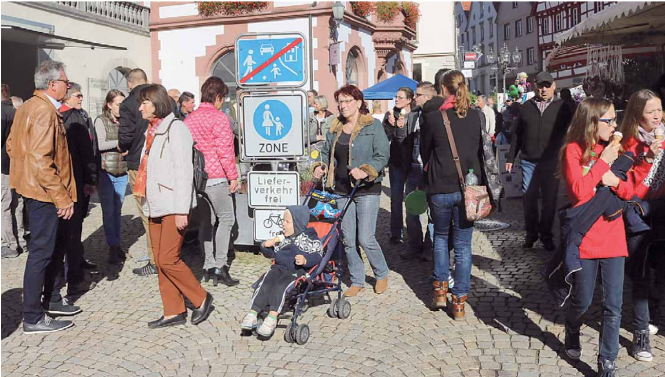
Die Stadt Pfullendorf lädt am Sonntag, 15. Oktober, ab 13 Uhr zu einem Fest der Generationen mit vielen Vorführungen und sehenswerten Aktionen in die Altstadt ein. Gleichzeitig veranstaltet die Wirtschaftsinitiative Pfullendorf in der Innenstadt und in den Einkaufszentren einen verkaufsoffenen Sonntag mit attraktiven Angeboten.

Amtliches Mitteilungsblatt der Stadt Pfullendorf und ihrer Stadtteile Aach-Linz, Denkingen, Gaisweiler, Großstadelhofen, Mottschieß, Otterswang, Zell a. A.