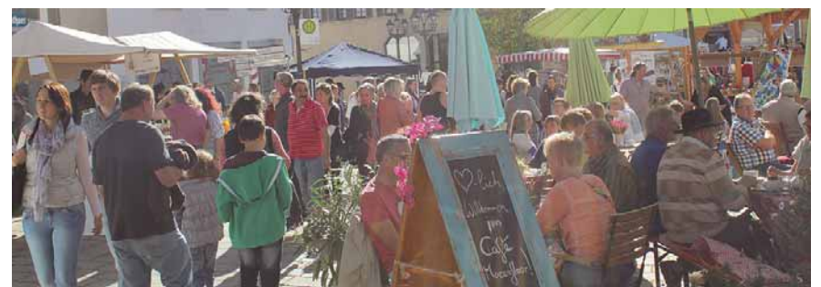
Das Fest der Generationen bietet viel Abwechslung für die Besucher. Bummeln, einkaufen, sich von den Talenten überraschen lassen oder einfach in aller Ruhe einen Kaffee trinken. Alles ist möglich.