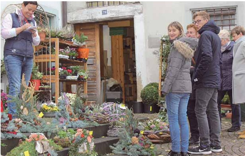
Passend zur Jahreszeit bietet die Klosterfloristik Gestecke für Allerheiligen an.