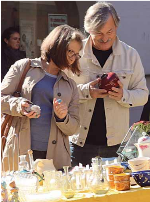
Beim Hechtbrunnen gibt es einen Flohmarkt mit tollen Raritäten.