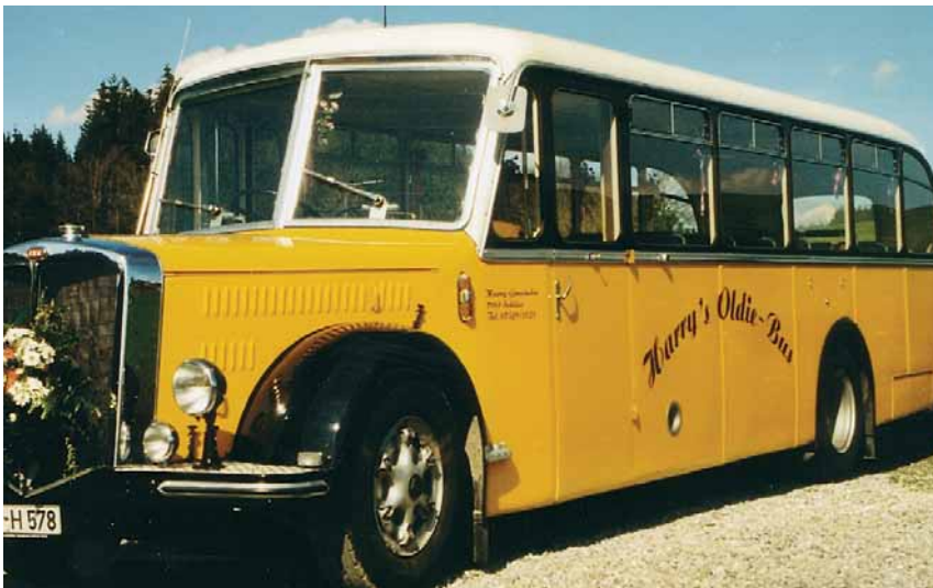
Wie immer pendelt auch in diesem Jahr der historische Postbus zwischen der Innenstadt und den Geschäften im Seepark Center.