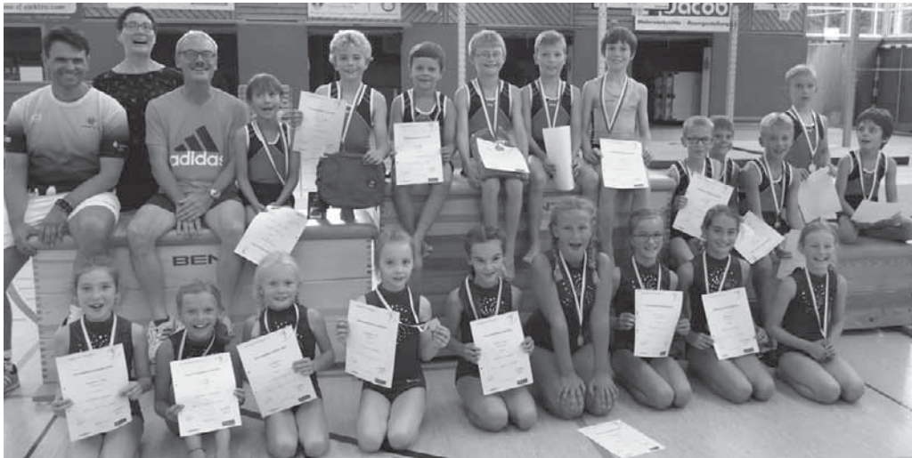
Der Nachwuchs des Turnvereins trug die Vereinsmeisterschaften aus.