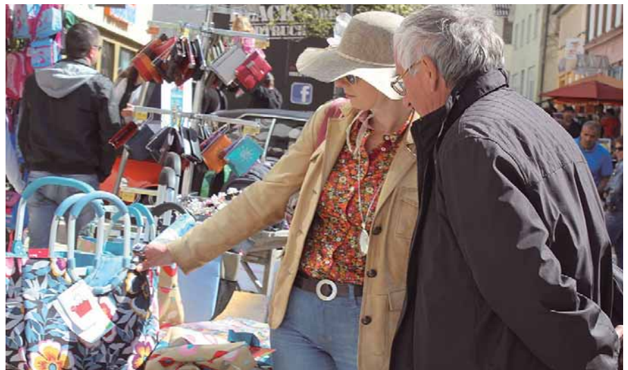
Beim Stadtbummel können die Besucher so manches interessante Schnäppchen entdecken.

MARCO Sport GmbH Bergwaldstr. 4 · 88630 Pfullendorf Im Linzgau-Center