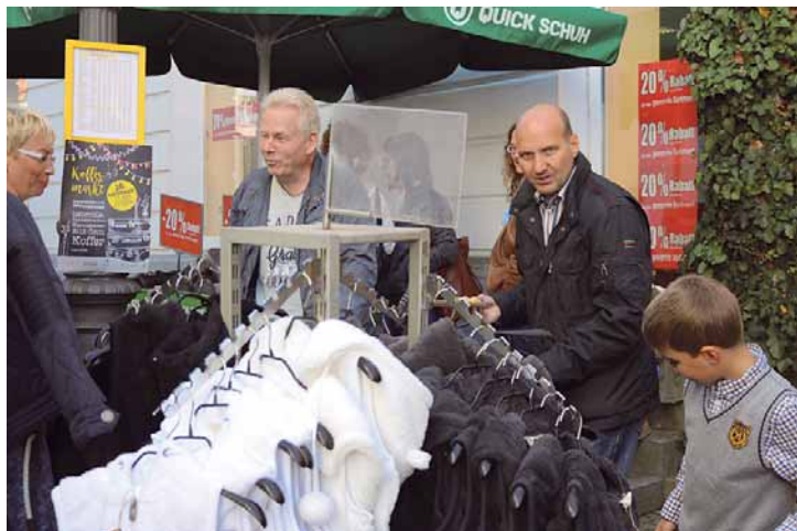
Die Fachgeschäfte in der Innenstadt und in den Einkaufszentren halten viele interessante Sonderangebote vor.