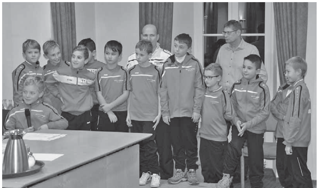
Auch für die E-Junioren des SC Pfullendorf gab es eine Ehrung.