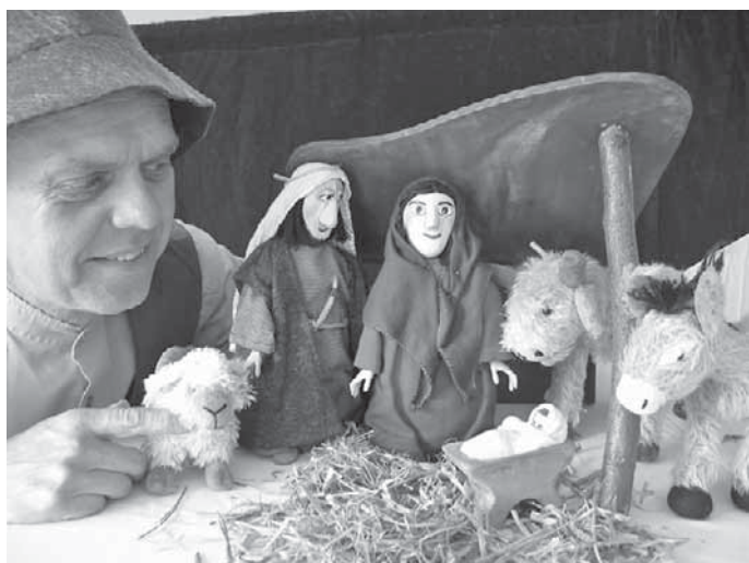
Die Stadtbücherei lädt am Samstag zu einem weihnachtlichen Puppentheater für Kinder ein.