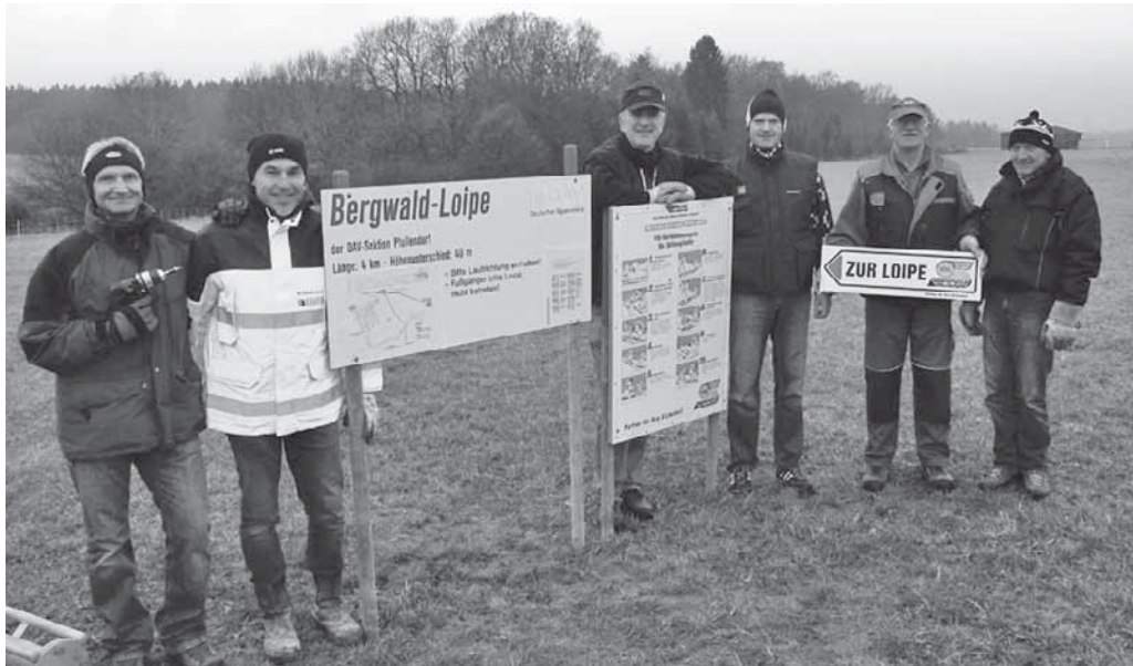
Die Skilangläufer im DAV haben die Pfullendorfer Loipe vorbereitet. Jetzt fehlt nur noch der Schnee.

Pfullendorf/pa – Das nächste Treffen der Singetse findet am Mittwoch, 14. Dezember, um 19.30 Uhr im Gasthaus „Lamm“ statt. Am Freitag, 16. Dezember, wirkt die Singetse um 17 Uhr bei der Adventsbesinnung „Fünf nach fünf im Klosterkeller“ mit.