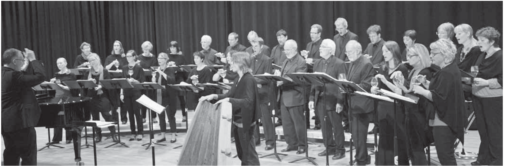
Der Madrigalchor Überlingen bringt am Sonntag in der Christuskirche Lieder zur Marienverehrung zu Gehör.