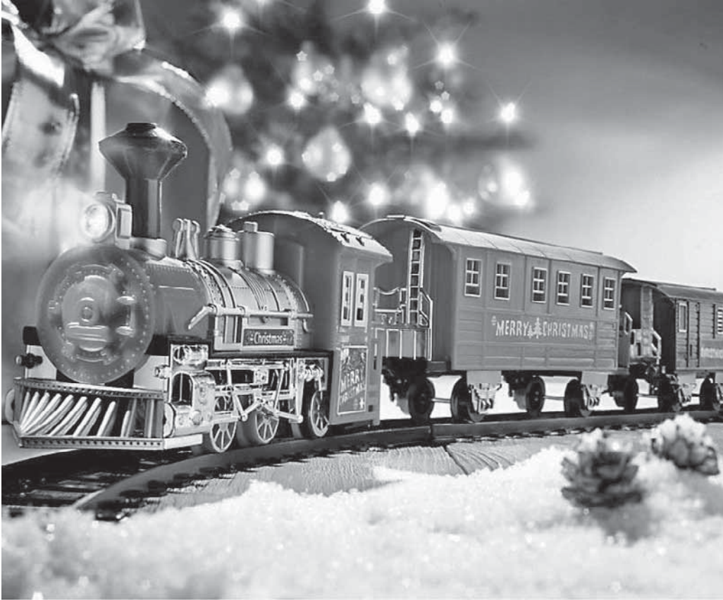
Der Modelleisenbahn-Club lädt am Sonntag zum Tag der offenen Tür ein.