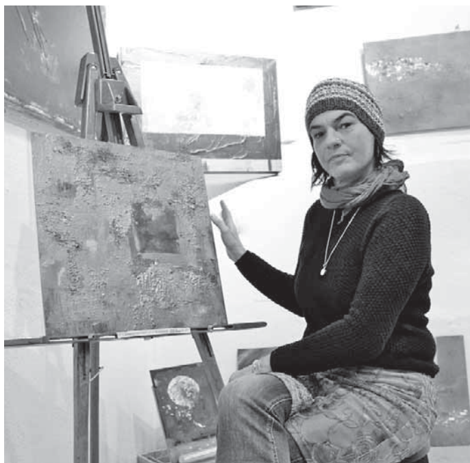
Noch bis Mitte Januar zeigt die Stadtbücherei die Bilder von Sabine Werst. Danach gibt es eine Ausstellung mit Werken von Björn Gebhardt.