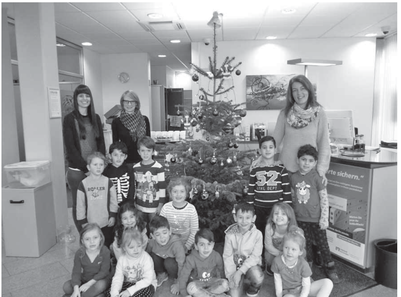
Die Kinder der Tagesstätte am Stadtgarten schmückten den Weihnachtsbaum in der Filiale der Volksbank Bad Saulgau.