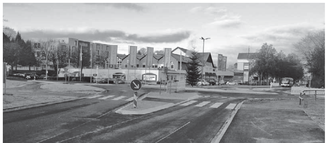
Die Bauarbeiten am neuen Kreisverkehr sind abgeschlossen. Ab sofort können die Franz-Xaver-Heilig-Straße, die Straße in Richtung Aftholderberg und die Zufahrt zur Innenstadt befahren werden.

Pfullendorf/hsg – Das Stadtbauamt teilt mit, dass am Mittwoch, 7. Dezember der mit einem