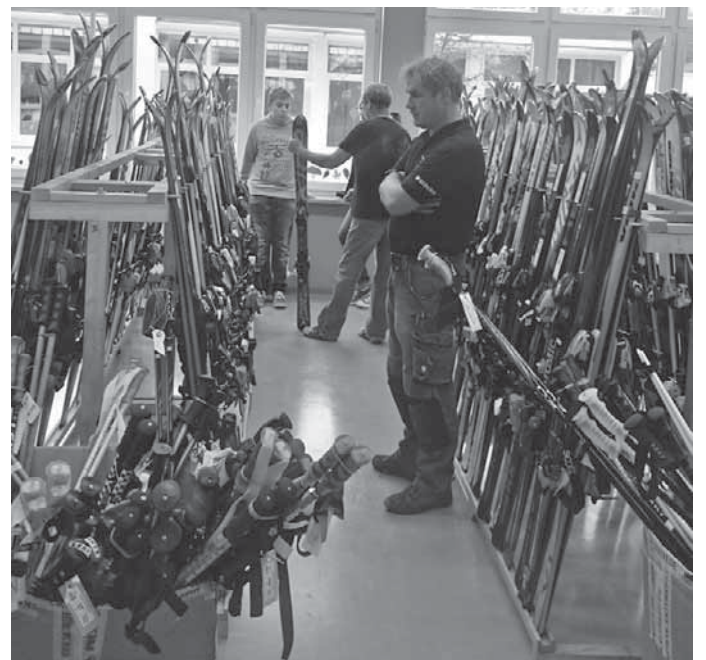
Beim Skibasar des DAV fanden die Besucher eine große Auswahl an Wintersportartikeln vor.