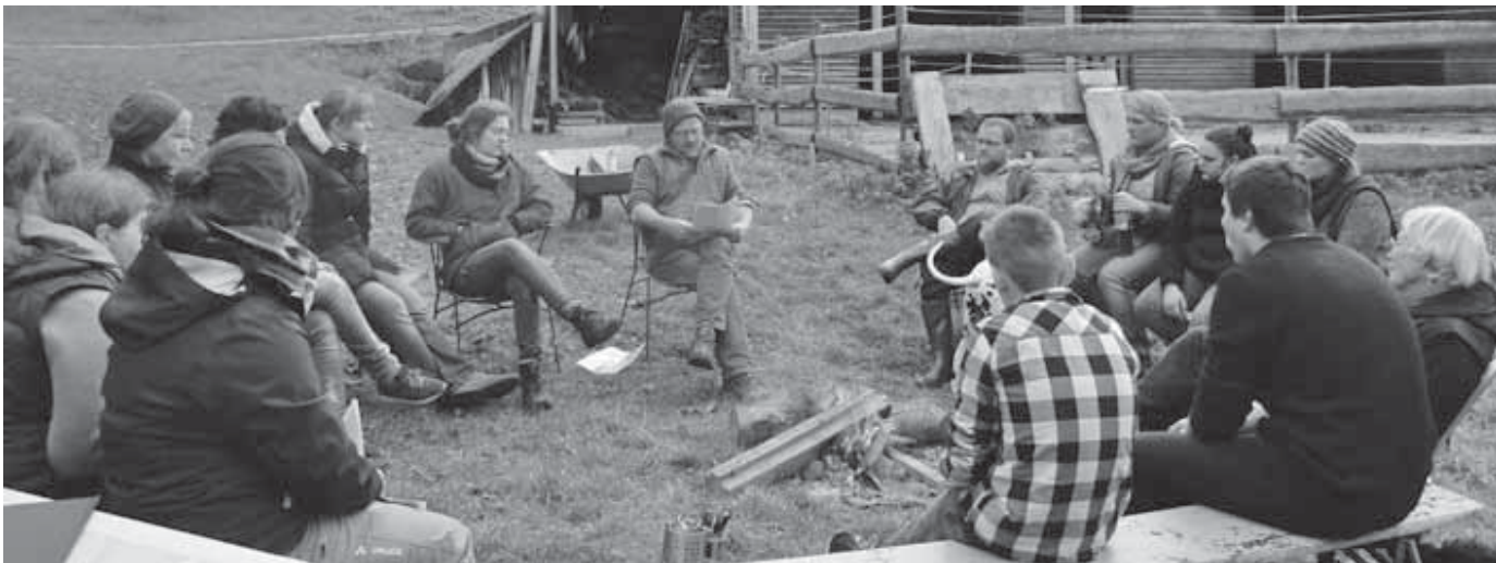
Beim Workcamp auf der Furtmühle standen Barrieren im Mittelpunkt.

für den Kunden viele Vorteile. Die Verkäufer erhalten medizinische und anatomische Grundlagen über die Funktionen der Wirbelsäule sowie die Aufgaben und den Aufbau der Muskulatur. Zusätzlich bekommen sie umfassende Fachinformationen über einen „rückengerechten Alltag“ der Kinder. Dieses über reine Produktkenntnisse hinausgehende Wissen ermöglicht eine individuellere Beratung des Kunden und hilft, das aus gesundheitlicher Sicht für das Kind am besten geeignete Produkt herauszufinden. Um eine optimale Beratung geben zu können, muss diese Schulung im jährlichen Turnus wiederholt werden. So kann sich der Kunde darauf verlassen, dass sich die Informationen des Fachhändlers immer auf dem neuesten wissenschaftlichen Stand befinden. Diese fundierten Fachkenntnisse erwarben die Klaiber-Mitarbeiterinnen Renate Sigel, Natalie Witt, Ursula Geiger und Melanie Merkel in einem Fernstudium. Nach der erfolgreichen Teilnahme an der Abschlussprüfung erhielt das Fachgeschäft für Schreiben, Schule und Schenken das AGR-Zertifikat.