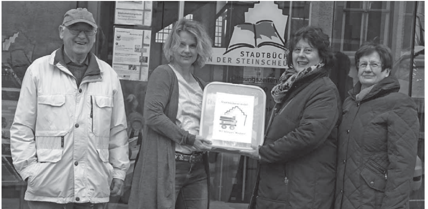
Ab sofort können Bücher und andere Medien der Stadtbücherei auch nach Hause gebracht werden, wenn es den Lesern nicht möglich ist, selbst in die Bücherei zu kommen. Den kostenlosen Fahrdienst übernimmt die Ortsgruppe Pfullendorf im Sozialverband VdK.

hergestellt und bemalt, damit sich die Besucher der Furtmühle auf dem Gelände orientieren können. Diese Vorhaben wurden mit freudigem Einsatz miteinander erfolgreich bewältigt. Im Rückblick am letzten Tag wurde deutlich, dass es interessant war, sich mit fremden und eigenen Barrieren und mit allem, was behindert, zu beschäftigen. Es machte Sinn, Hindernisse als Herausforderung anzunehmen. Bei der gemeinsamen Aktion wurde Mut gefasst, auch weiterhin Barrieren aller Art zu überwinden, und es bereitete den Teilnehmern Freude, diese intensive Zeit miteinander zu verbringen.