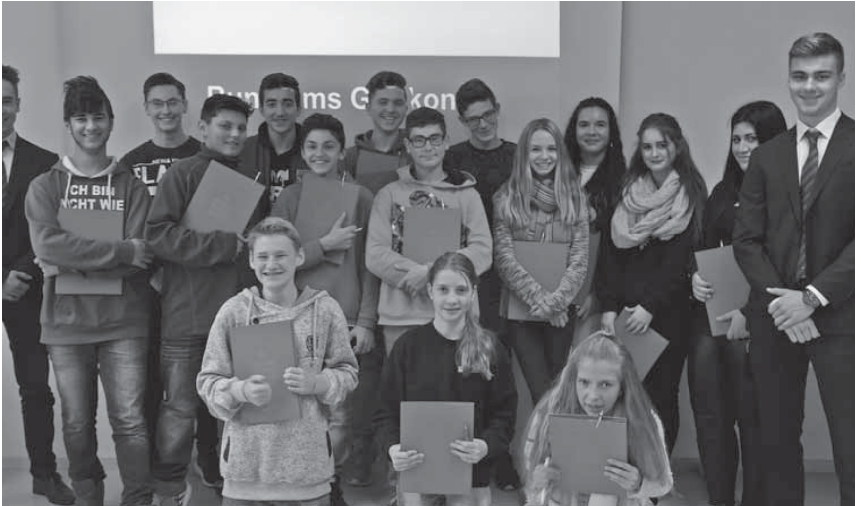
Die Neun- und Zehntklässler der Sechslinden-Schule erfuhren von den Sparkassen-Azubis viel über Geldgeschäfte.