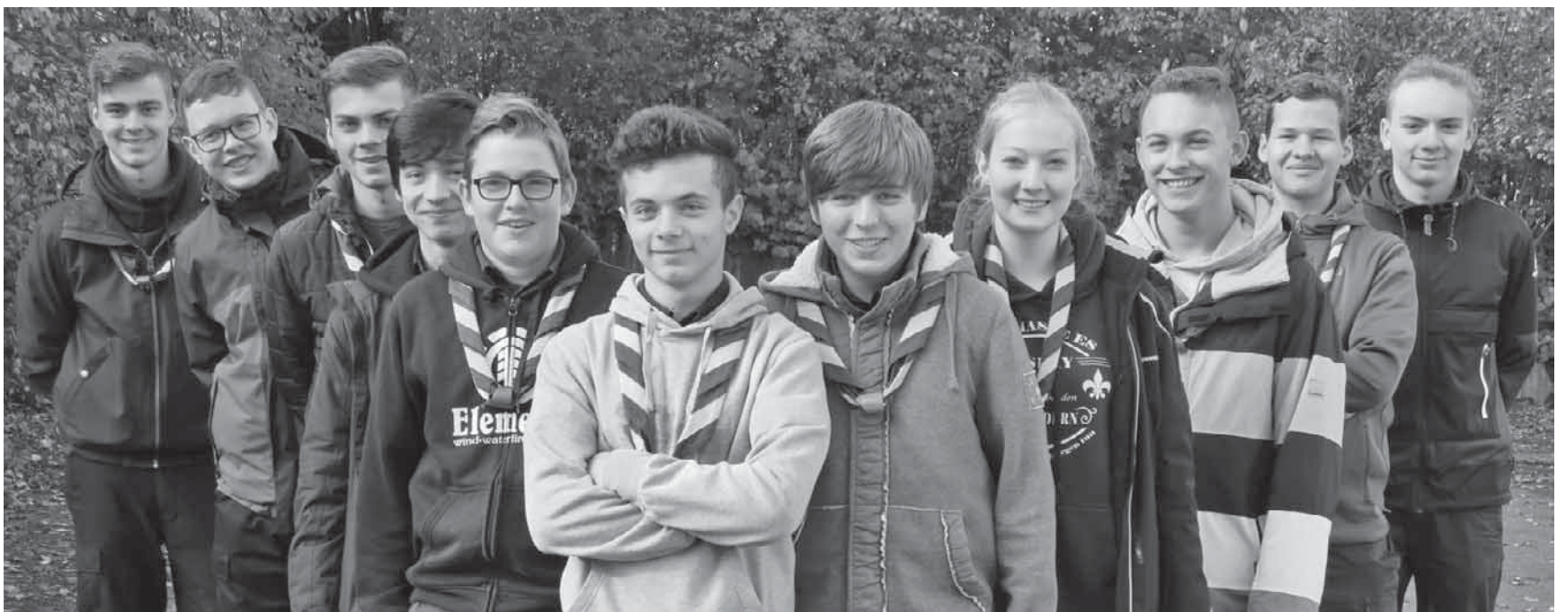
Die Schwarzen Panter mussten sich beim letzten Hajk in diesem Jahr kühlen Temperaturen stellen.

nicht jedermanns Sache. Dies zeichnet wohl die Scouts in ihrem Tun aus. Sie tun es, weil es einfach Spaß macht und den Zusammenhalt stärkt.