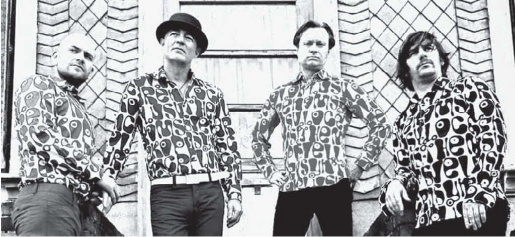
Die Band Los Banditos heizt dem tanzfreudigen Publikum im Café Moccafloer ein.