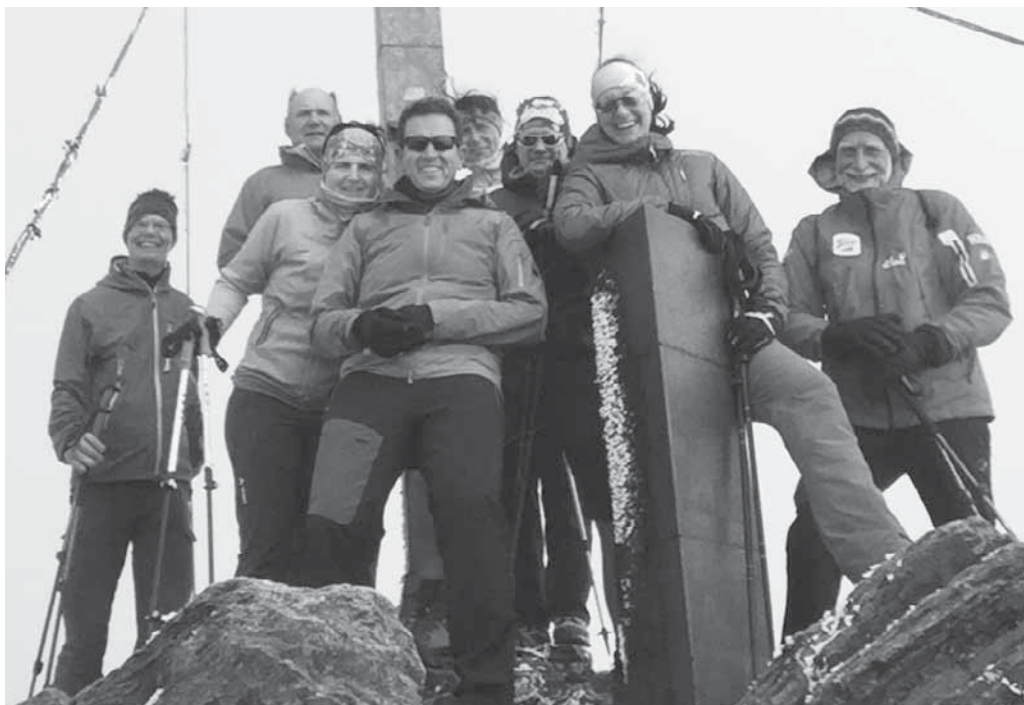
Die Bergwanderer des DAV waren vier Tage lang in der Texel-Gruppe unterwegs.