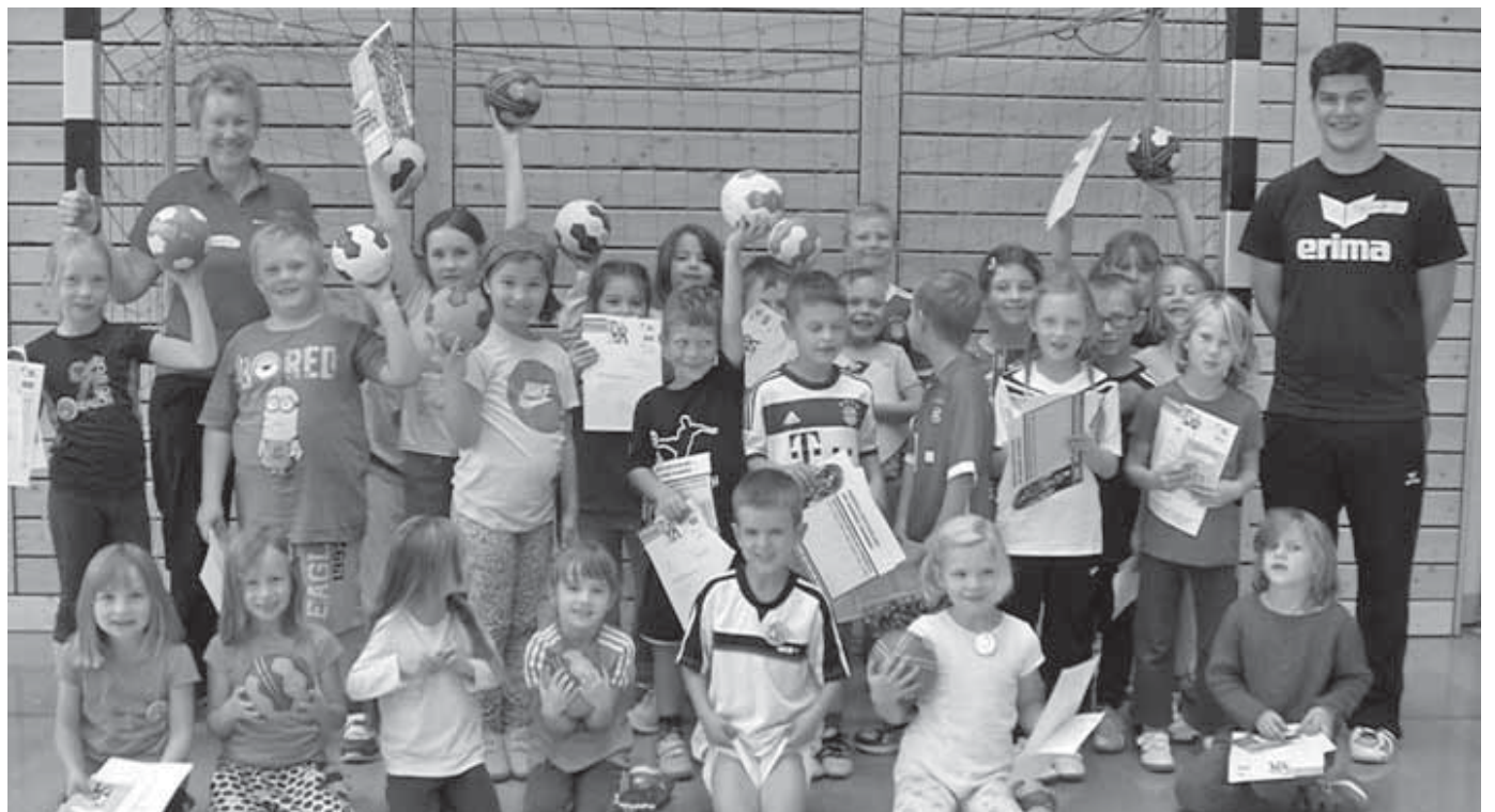
Die Kids hatten viel Spaß beim Handball-Aktionstag.