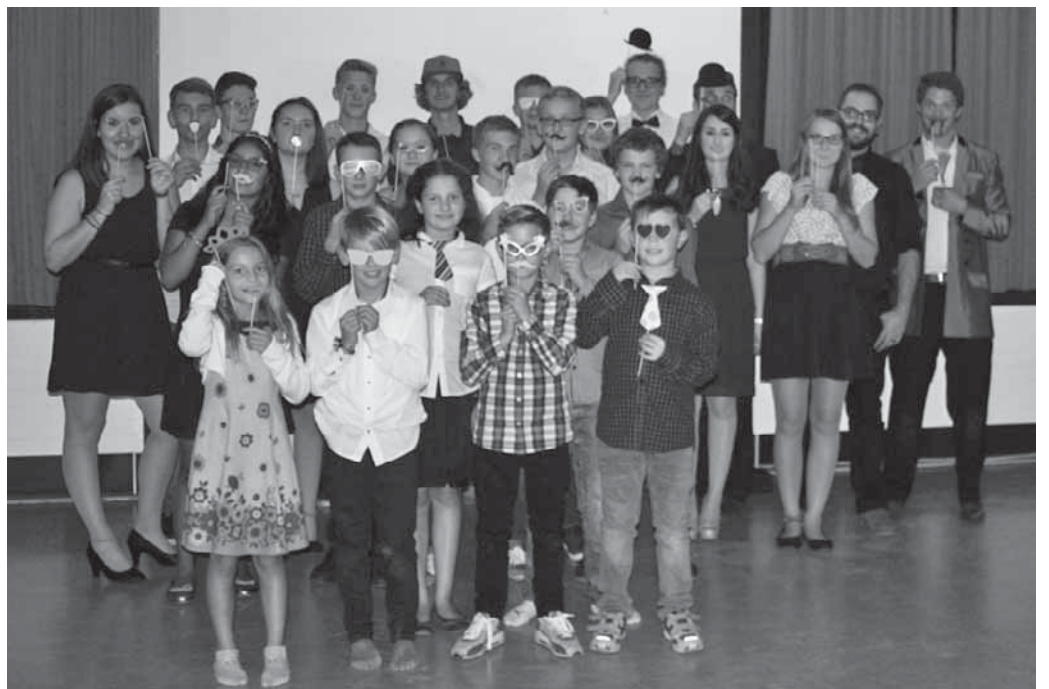
Die St.-Georgspfadfinder verbrachten ein abwechslungsreiches Wochenende in Ebingen.