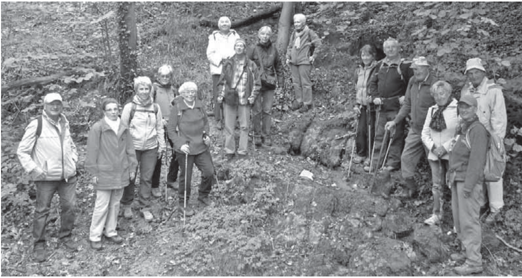
Die Wanderfreunde des Schwäbischen Albvereins besuchten die Zizenhausener Heidenhöhlen.