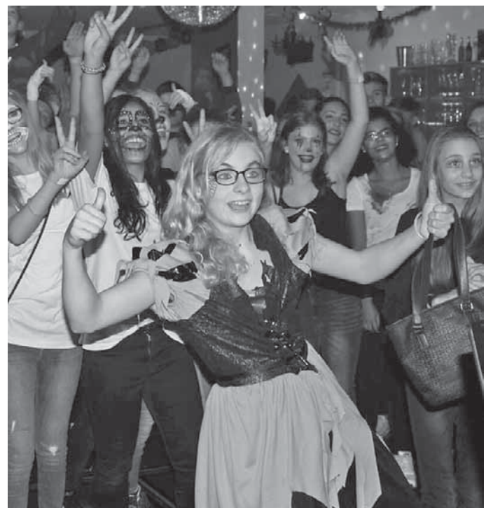
Die Kids feierten ausgelassen und hatten einen Riesenspaß.

Pfullendorf/pa – Das Feiern mit Gruselfaktor ist bei den Kids auch in diesem Jahr gut angekommen. Das Kinder- und Jugendbüro hat wieder gemeinsam mit der Jugendabteilung