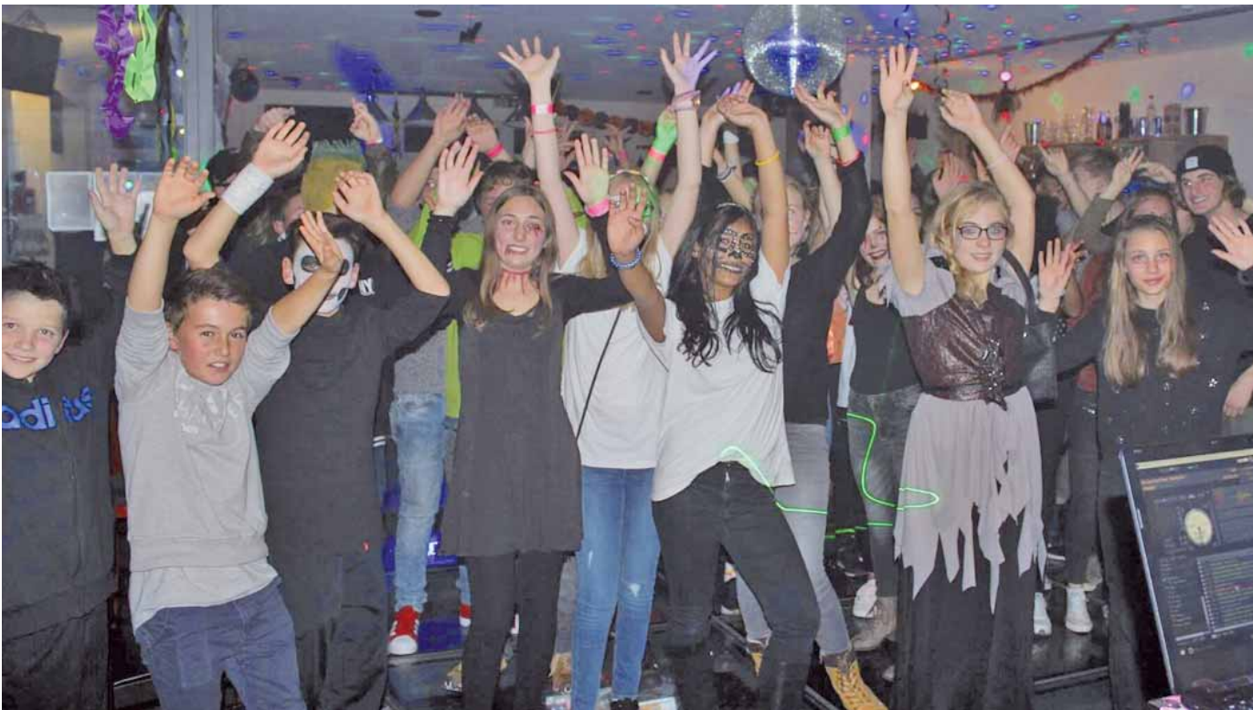
Rund 80 Jugendliche haben eine ausgelassene Halloween-Party gefeiert. Sie fand, organisiert und betreut vom Kinder- und Jugendbüro und der Jugendabteilung des Turnvereins, im Bistro M-Life statt. Erstmals durften am darauf folgenden Nachmittag auch die jüngeren Kinder ihren gruseligen Spaß haben. Mehr zur Halloween-Party gibt es im Innenteil.

Amtliches Mitteilungsblatt der Stadt Pfullendorf und ihrer Stadtteile Aach-Linz, Denkingen, Gaisweiler, Großstadelhofen, Mottschieß, Otterswang, Zell a. A.