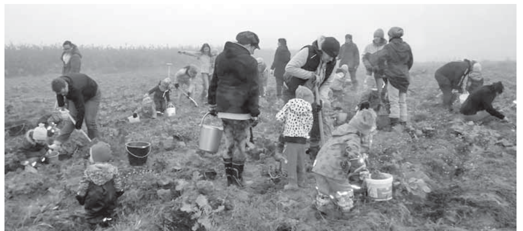
Die Kinder des Montessori Kinderhauses erfahren, wie Kartoffeln geerntet werden.

Sigmaringen/pa – Das Landratsamt Sigmaringen hat in Mengen einen Pflegestützpunkt eingerichtet. Dort erhalten Menschen mit Pflegebedarf und Angehörige von pflegebedürftigen Menschen Rat und Informationen rund um die Pflege. Die Mitarbeiterinnen informieren individuell über gesetzliche und kommunale Leistungen ebenso wie über wohnortnahe Pflege- und Betreuungsangebote. Die Beratung erfolgt vertraulich, neutral, unabhängig von