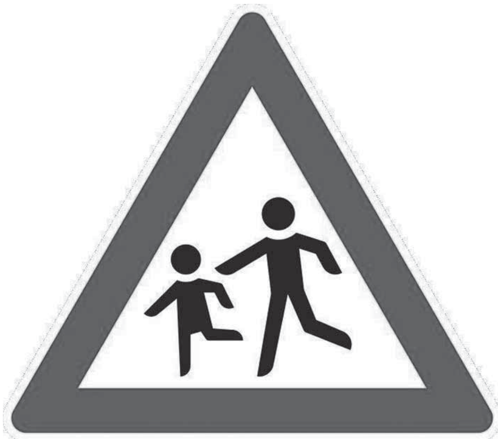
Bei diesem Hinweisschild müssen Autofahrer besonders sorgfältig auf Kinder achten und ihre Geschwindigkeit anpassen.

Kreativer Kindertanz ab 4 Jahren, 15.30 - 16.15 Uhr, 1 Halbjahr, Kursgebühr 19 Euro monatlich, Kurs-Nr. 162279 Toben Tanzen Träumen - Kindertanz ab 4 Jahren, 16.30 - 17.30 Uhr, 1 Halbjahr, Kursgebühr 82 Euro, Kurs-Nr. 162280 Kreativer Tanz/Hip-Hop ab 7 Jahren, 16.30 - 17.30 Uhr, 1 Halbjahr, Kursgebühr 82 Euro, Kurs-Nr. 162281 Hip-Hop ab 10 Jahren, 17.30 - 18.30 Uhr, 1 Halbjahr, Kursgebühr 82 Euro, Kurs-Nr. 162282 Street Dance ab 13 Jahren, 18.30 - 19.30 Uhr, 1 Semester, Kursgebühr 82 Euro, Kurs-Nr. 162283 bei allen Tanzkursen zweimal kostenlos schnuppern und Einstieg laufend möglich