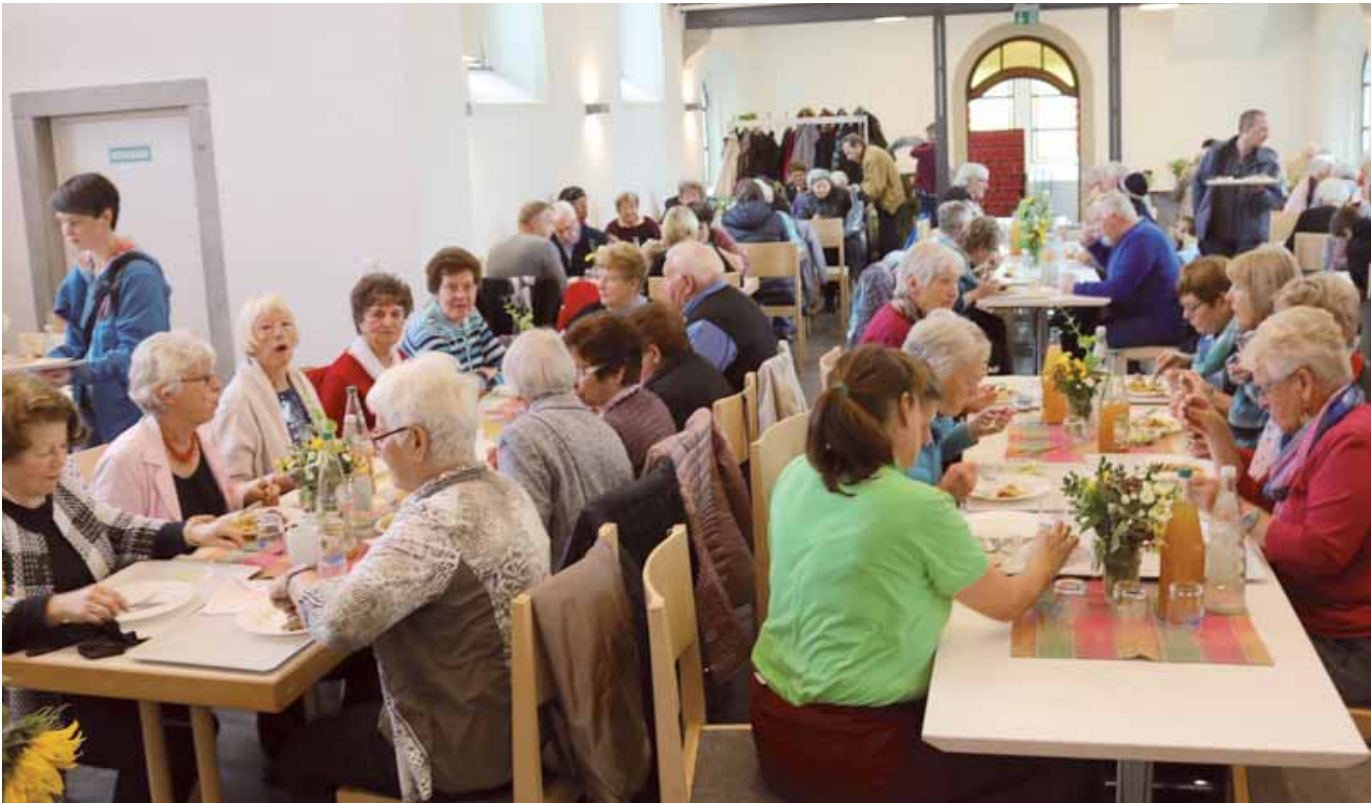
Mit 3400 ausgegebenen Essen ist die Vesperkirche 2016 zu Ende gegangen. Das Kirchenschiff der evangelischen Christuskirche, das wieder zu einem großen Gasthaus wurde, war an allen 15 Tagen bis auf den letzten Platz besetzt.

Amtliches Mitteilungsblatt der Stadt Pfullendorf und ihrer Stadtteile Aach-Linz, Denkingen, Gaisweiler, Großstadelhofen, Mottschieß, Otterswang, Zell a. A.