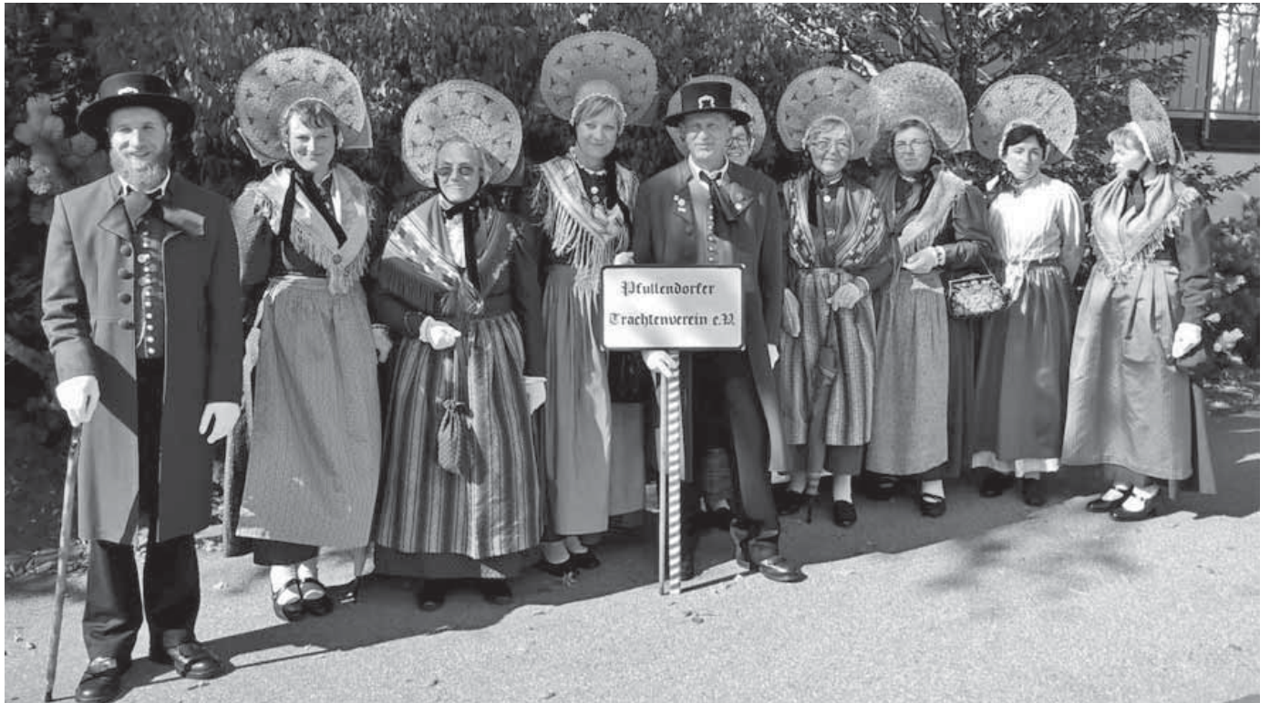
Die Pfullendorfer Trachten unternahmen einen Ausflug zum Kreistrachtenfest in Höchenschwand.