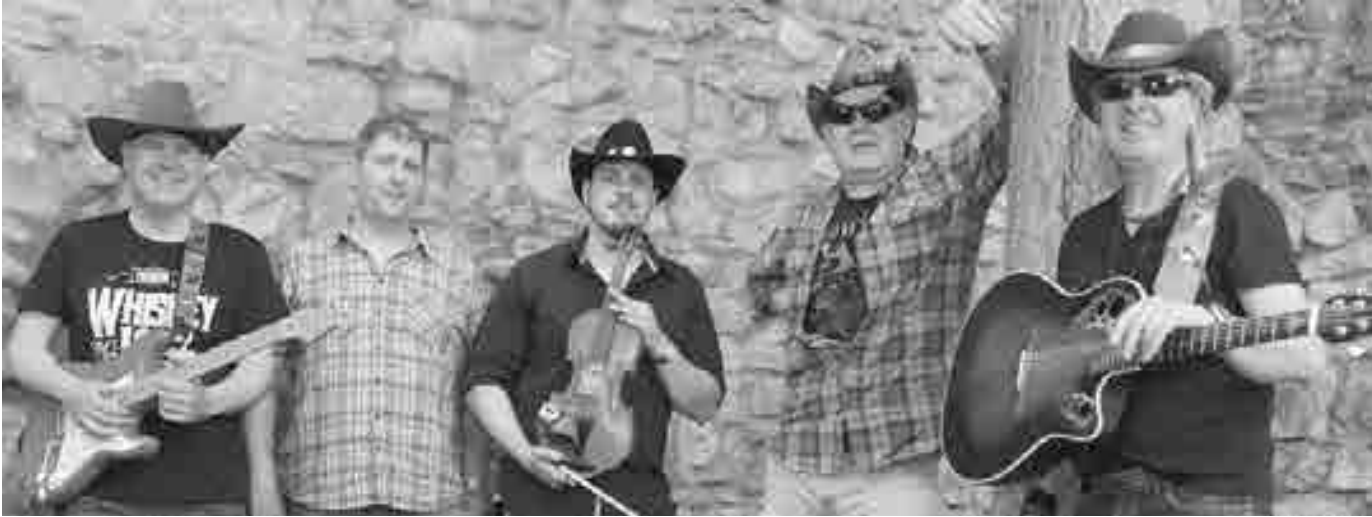
die Countryband »Knapp ein Jahr« spielt am Freitag im Felsenkeller.