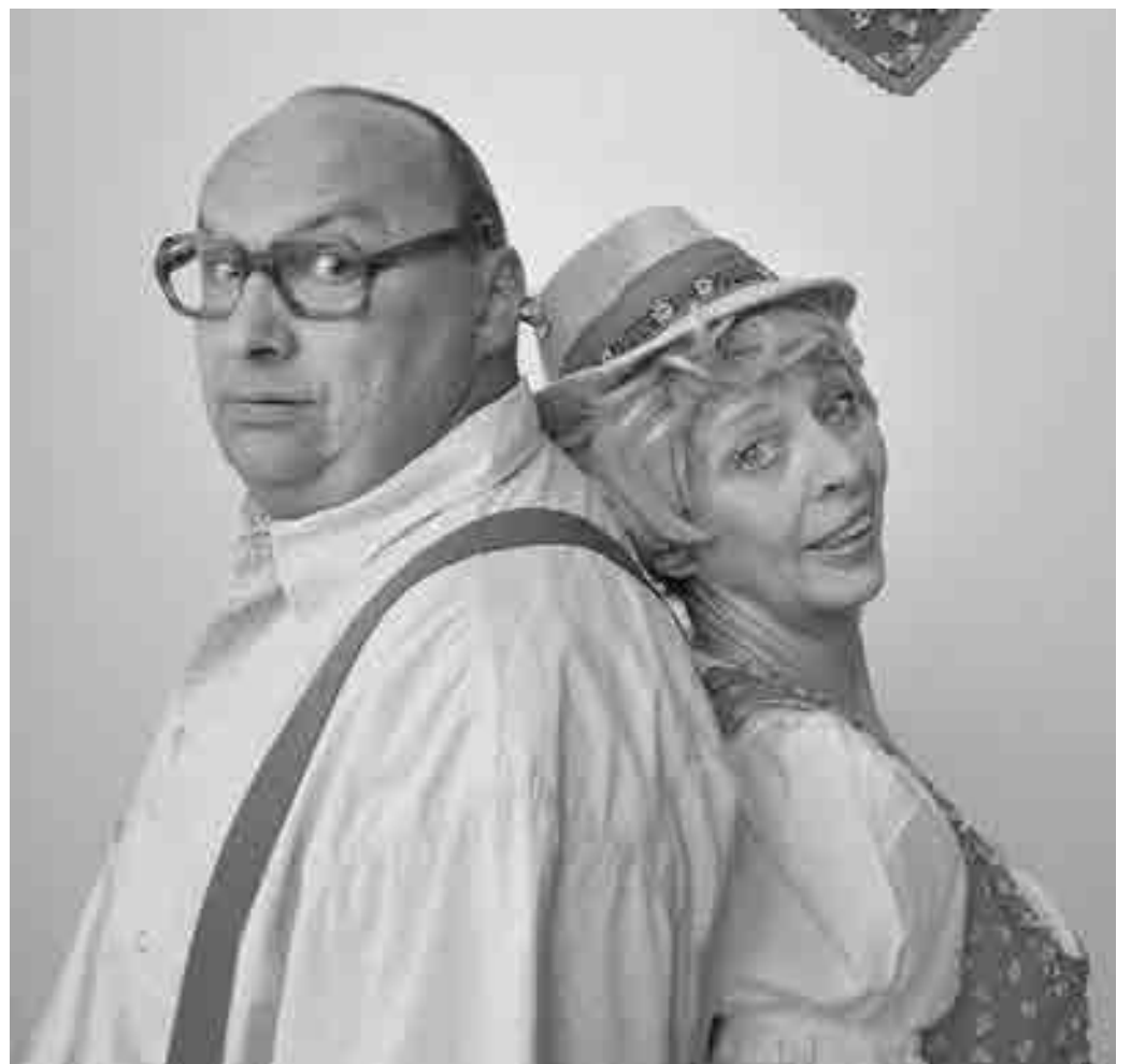
Die Komödianten »Die Kächeles« sind am Donnerstag im Dorfgemeinschaftshaus in Otterswang zu Gast. Sie präsentieren ihr neues Programm »Ja Schatzi«.