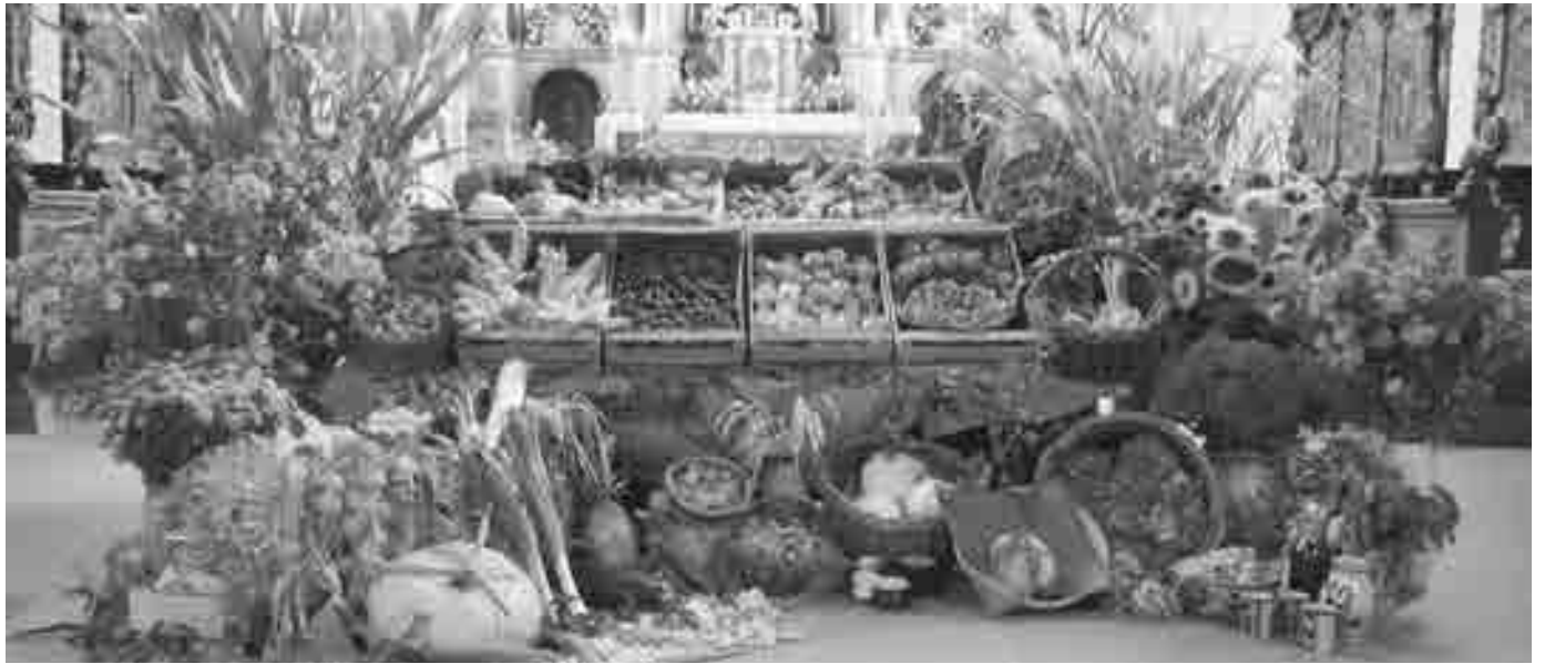
Die Katholische Frauengemeinschaft gestaltete in diesem Jahr wieder einen farbenfrohen Altar zum Erntedankfest.