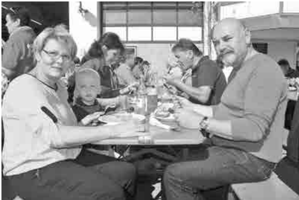
Beim Tag der offenen Tür der Stadtwehr ließen sich die Besucher die leckere Schlachtplatte schmecken.

gen permanent unterwegs und die Gäste satt und zufrieden: Beim Schlachtfest der Stadtwehr vor und im Gerätehaus haben