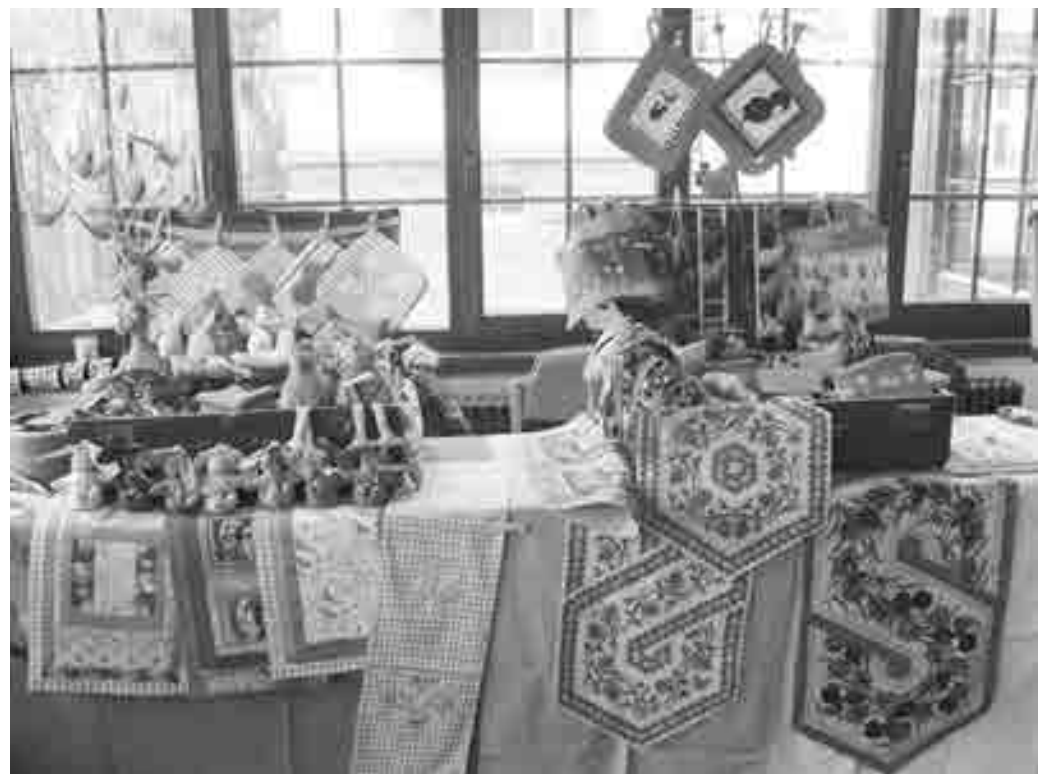
Beim Koffermarkt gibt es viele hübsche Näh- und Bastelarbeiten.