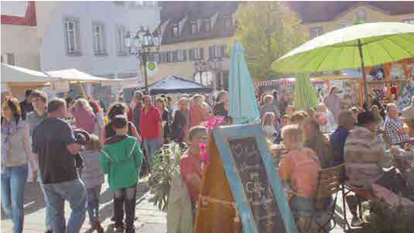
Die Wirtschaftsinitiative Pfullendorf und die Stadt laden am Sonntag zum verkaufsoffenen Sonntag ein. Von 13 bis 18 Uhr sind die Geschäfte in der Innenstadt und in den Einkaufszentren geöffnet. Dazu gibt es ein abwechslungsreiches Rahmenprogramm mit Unterhaltung für Jung und Alt.

Amtliches Mitteilungsblatt der Stadt Pfullendorf und ihrer Stadtteile Aach-Linz, Denkingen, Gaisweiler, Großstadelhofen, Mottschieß, Otterswang, Zell a. A.