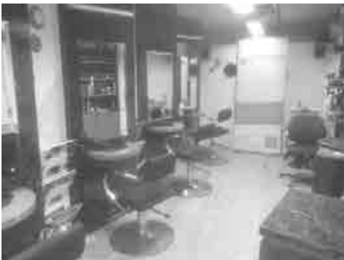
Das Friseurmobil ist wie ein schickes Haarstudio ausgestattet.

Pfullendorf/pa – Die Linzgau Buchhandlung bietet auch in diesem Jahr in Kooperation mit dem Gmeiner Verlag eine Fahrt mit dem Omnibus zur Frankfurter Buchmesse an. Die Fahrt findet am Samstag, 22. Oktober, statt. Abfahrt ist um 5.45 Uhr am Busbahnhof. Die Rückfahrt ist für 17.30 Uhr ab Frankfurt vorgesehen. Auf der Frankfurter Buchmesse sind über 1000 Verlage und Aussteller aus etwa 100 Ländern vertreten. Ehren-