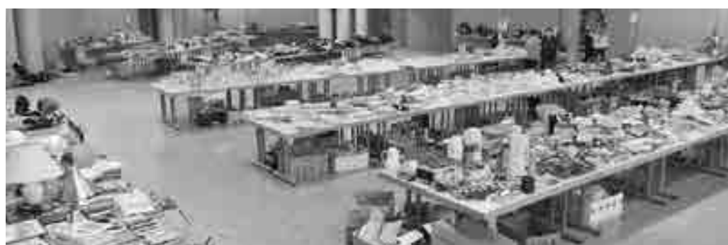
Bei der Gebrauchtwarenborse in der Stadthalle können gebrauchte, aber gut erhaltene und gereinigte Gegenstände abgegeben und mitgenommen werden.