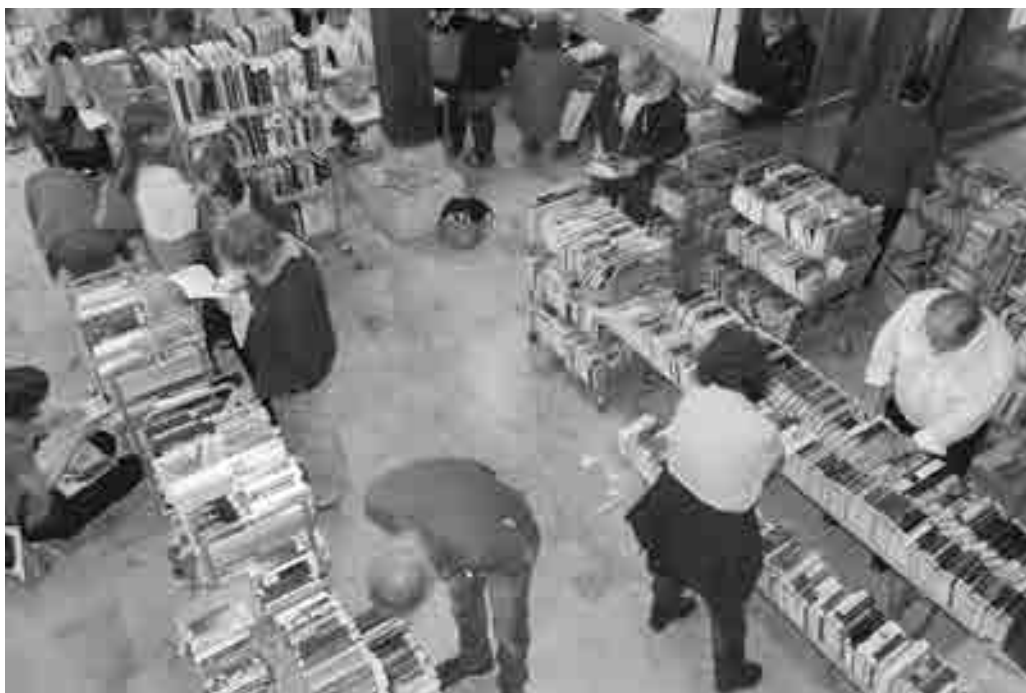
Die Stadtbücherei in der Steinscheuer lädt am verkaufsoffenen Sonntag zu einem Tag der offenen Tür mit Medienflohmarkt, Kinderprogramm und Kuchenbuffet ein.

Dienstag, 18. Oktober Kreativer Kindertanz ab 4 Jahren, 15.30 – 16.15 Uhr, 1 Halbjahr, Kursgebühr 19 Euro monatlich, Kurs-Nr. 162279 Toben Tanzen Träumen – Kindertanz ab 4 Jahren, 16.30 – 17.30 Uhr, 1 Halbjahr, Kursgebühr 82 Euro, Kurs-Nr. 162280 Kreativer Tanz/Hip-Hop ab 7 Jahren, 16.30 – 17.30 Uhr, 1 Halbjahr, Kursgebühr 82 Euro, Kurs-Nr. 162281 Hip-Hop ab 10 Jahren, 17.30 – 18.30 Uhr, 1 Halbjahr, Kursgebühr 82 Euro, Kurs-Nr. 162282 Street Dance ab 13 Jahren, 18.30 – 19.30 Uhr, 1 Semester,