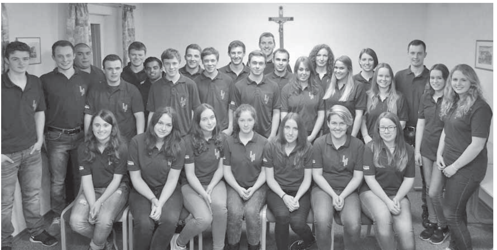
Die Landjugend Zell lädt am kommenden Wochenende zur traditionellen Sichelhenke ein.

Pfullendorf/pa – Das nächste Treffen des Skatclubs im Netzwerk 50plus findet am Montag, 12. September, in den Räumen des Netzwerks im Mesnerhaus (neben Moden Langer) statt. Beginn ist um 15.30 Uhr. Es wird in einer lockeren Runde aus Männern und Frauen Skat