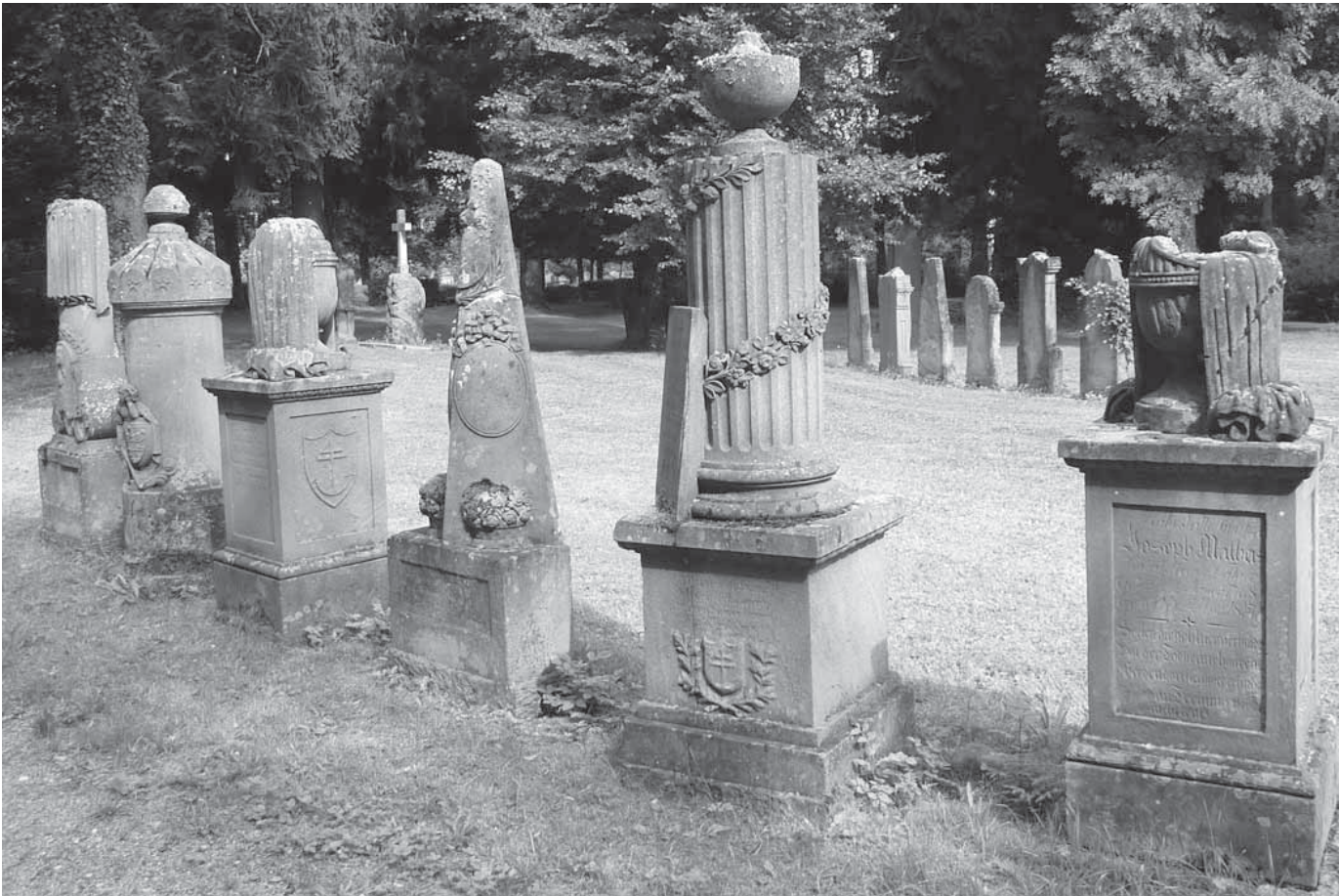
Das Kreiskulturforum lädt am Dienstag in Zusammenarbeit mit der Stadt und dem Heimat- und Museumsverein zu einer Führung auf dem Alten Friedhof ein. Anschließend findet ein Vortrag über Sepulkrarchitektur in Oberschwaben statt.

schaft, über Politik, Turbokühe und die bodenlose Bürokratie. Unterwegs trifft er einen musikalischen Vagabund, der ihn begleitet. Karten gibt es im Vorverkauf zu zehn Euro beim Lebensmittelladen Gisela Vogler in Sauldorf, bei der Volksbank Messkirch oder per E-Mail: feierabendbauer-sauldorf@web.de sowie zu zwölf Euro an der Abendkasse.