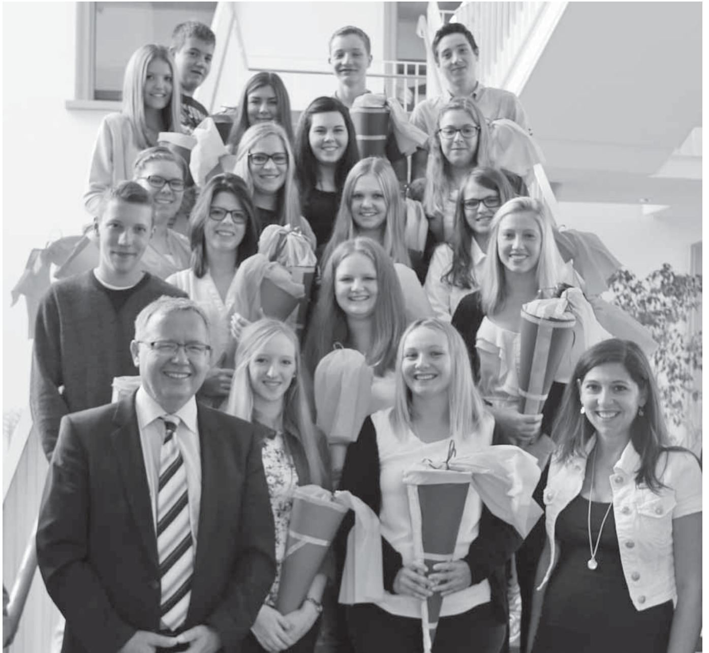
Rolf Vögtle begrüßte 16 neue Azubis beim Landratsamt. Für das nächste Jahr werden noch bis Ende September Ausbildungsstellen in verschiedenen Berufen vergeben.

Sigmaringen/pa – Ende August war beim Landratsamt Ausbildungsbeginn für 16 neue Auszubildende und Studierende in acht verschiedenen Berufsbildern sowie eine Frau, die ein Freiwilliges Soziales Jahr absolviert. Zum Start in das Berufsleben hieß der erste Landesbeamte Rolf Vögtle die jungen Frauen und Männer mit