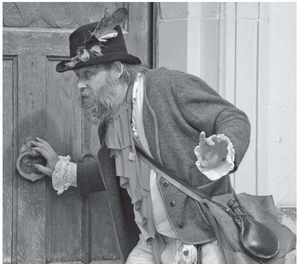
Die Tourist-Information veranstaltet am Freitag eine Stadtführung mit dem Räuber Grandscharle.

Pfullendorf/hsg – Im Rahmen des Kulturschwerpunkts 2016 im Landkreis Sigmaringen „Regionales Bauen“ laden das Kreiskulturforum, die Stadt Pfullendorf und der Heimat- und Museumsverein am Dienstag, 13. September, zu einer Führung über den Alten Friedhof und im Anschluss zu einem Lichtbil-