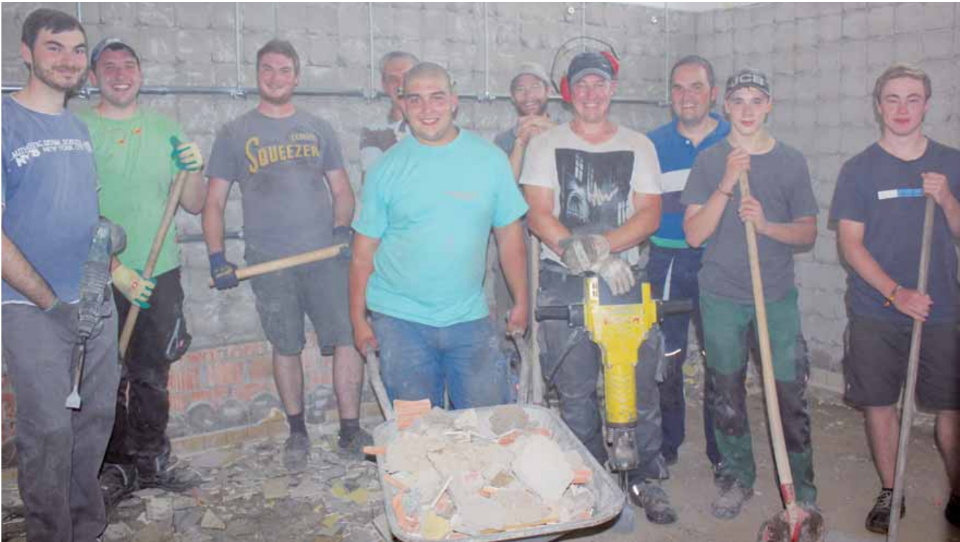
In der Schwäblishäuser Turnhalle werden die Sanitäranlagen renoviert. Die Bürger aus Zell und Schwäblishausen, für die ein lang gehegter Wunsch in Erfüllung geht, tragen zur Sanierung mit Eigenleistungen beim Abbruch und später bei den Malerarbeiten und bei der Reinigung bei.

Amtliches Mitteilungsblatt der Stadt Pfullendorf und ihrer Stadtteile Aach-Linz, Denkingen, Gaisweiler, Großstadelhofen, Mottschieß, Otterswang, Zell a. A.