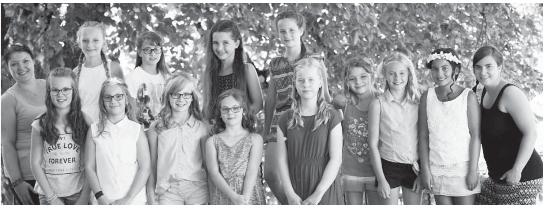
Die Mädels erlebten im Jugendhaus einen tollen Tag mit Styling und Fotoshooting.

Pfullendorf/pa - Das Sommerferienprogramm des Kinder- und Jugendbüros ist im vollen Gange. Viele unterschiedliche Programme haben bereits stattgefunden und allen Kindern und Jugendlichen großen Spaß