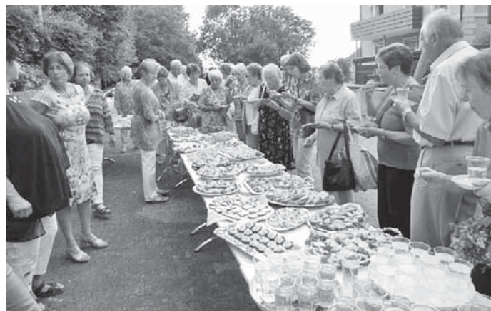
Die Frauen der Katholischen Frauengemeinschaft erfreuten die Gottesdienstbesucher an Maria Himmelfahrt mit einem leckeren Kräuterbüffet.

IHRE ADRESSE FÜR GESCHMACKVOLL GESTALTETE GRABDENKMALE