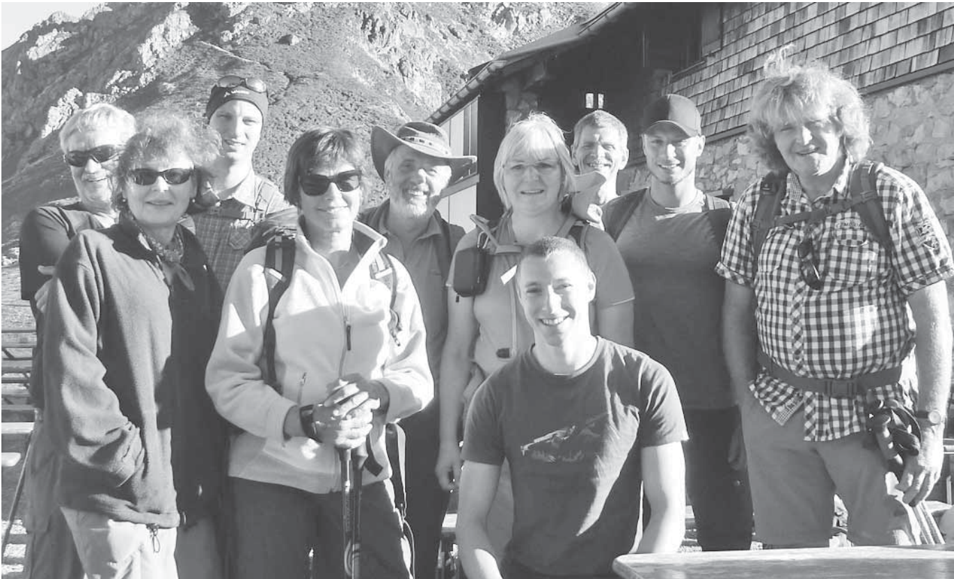
Die Bergwanderer des DAV unternahmen eine zweitägige Hüttentour.