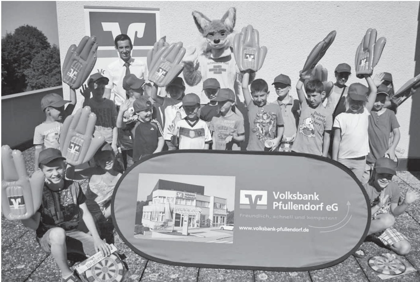
Im Rahmen des Sommerferienprogramms erlebten die Kinder eine spannende Führung bei der Volksbank.