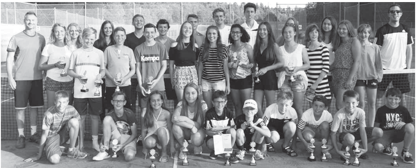
Der Nachwuchs des Tennisclubs hat bei den Vereinsmeisterschaften seine Meister ermittelt.

Pfulleendorf/pa – Die Mittwochswanderer fahren am 7. September mit Charlotte Zoller an den Bodensee. Abfahrt mit dem Omnibus nach Überlingen ist um 13 Uhr am Busbahnhof. Nach etwa einer Stunde Aufenthalt geht es mit der kleinen Fähre nach Wallhausen. Von dort wird am See entlang nach Dingelsdorf und wieder zurück gewandert. Von Wallhausen geht es nach Lust und Laune der Teilnehmer wieder mit dem Schiff und dem Bus zurück nach Pfulleendorf. Das Schiff fährt zu jeder vollen Stunde zurück. Der Bus ab Überlingen startet immer 18 Minuten nach der vollen Stunde. Die Fahrtkosten für Bus und Schiff betragen zwölf Euro pro Person.