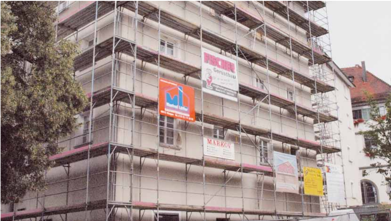
Das historische Dominikanerinnenkloster wird derzeit von der Stadt aufwändig saniert. Beim Tag des Denkmals am 11. September öffnet die Stadt in Kooperation mit dem Heimat- und Museumsverein das Gebäude. Für Interessierte werden Führungen angeboten.

Amtliches Mitteilungsblatt der Stadt Pfullendorf und ihrer Stadtteile Aach-Linz, Denkingen, Gaisweiler, Großstadelhofen, Mottschieß, Otterswang, Zell a. A.