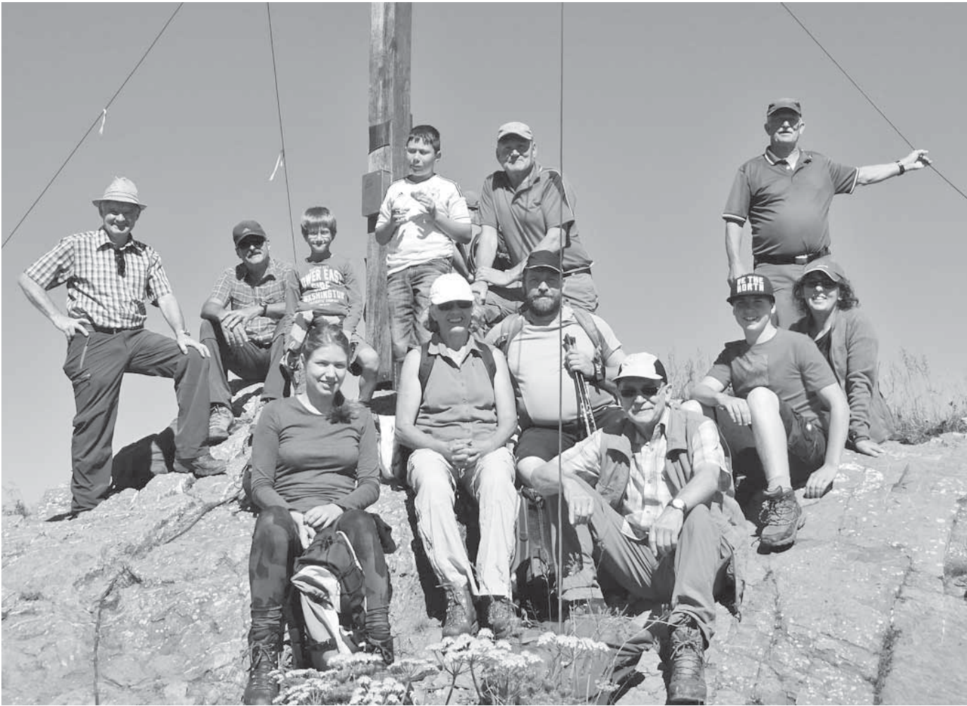
Die Bergfreunde des DAV unternahmen bei der Wanderwoche anspruchsvolle oder einfachere Wanderungen.