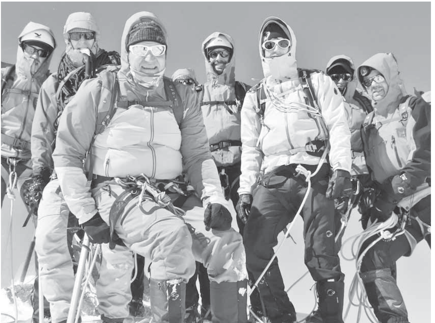
Die Bergsteiger im DAV unternahm einige Hochgebirgstouren im Wallis.

Pfullendorf/pa – Die Sektion Pfullendorf im Deutschen Alpenverein unternahm mit neun Teilnehmern mehrere Hochtouren im Wallis. Ausgangspunkt war die Britanniahütte des SAC auf 3030 Meter oberhalb des Saastals. Nach der Anfahrt am erfolgte der Anstieg zur beliebten und meistbesuchten Hütte des Schweizer Alpen Clubs, die ein idealer Ausgangspunkt für diverse Hochtouren ist. An den folgenden drei Tagen wurden die Viertausender Allalinhorn über den Hohlaubgrat und Strahlhorn sowie der 3564 Meter hohe Allalinsattel jeweils über den Allalingletscher erstiegen. Die Bedingungen waren durch die anfangs kühle Witterung recht gut, auch wenn der lockere Schnee teilweise die Kletterei etwas erschwerte.