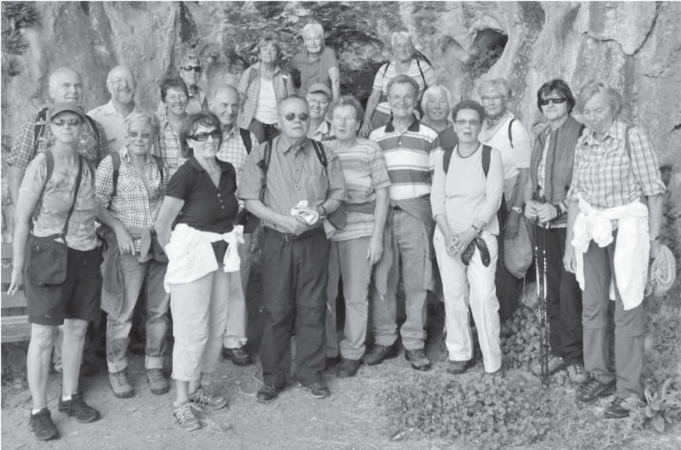
Der Schwäbische Albverein unternahm eine interessante Höhlenwanderung in Veringenstadt.