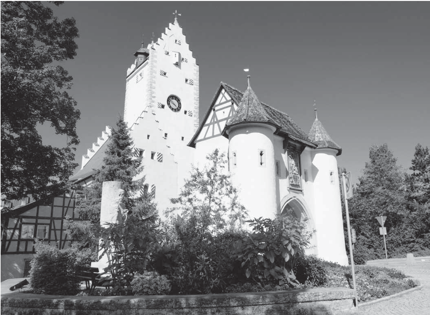
Die Tourist-Information lädt am Sonntag zu einer Führung im Obertor ein.