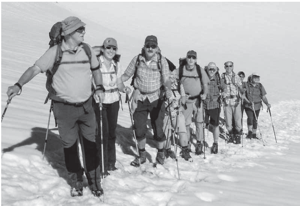
Im Rätikon fanden die Bergwanderer des DAV schwierige Bedingungen vor.