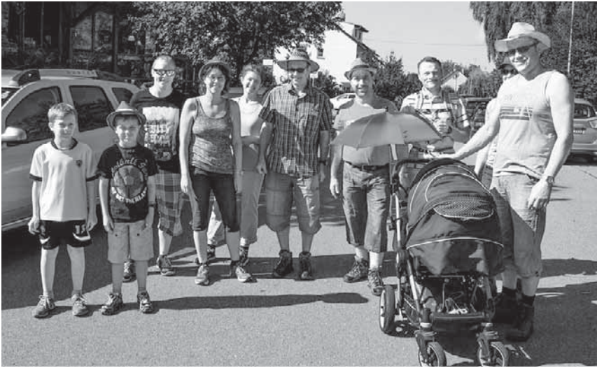
Rund 900 Wanderfreunde aus Aach-Linz und der weiteren Region machten sich beim Volkswandertag auf den Weg.