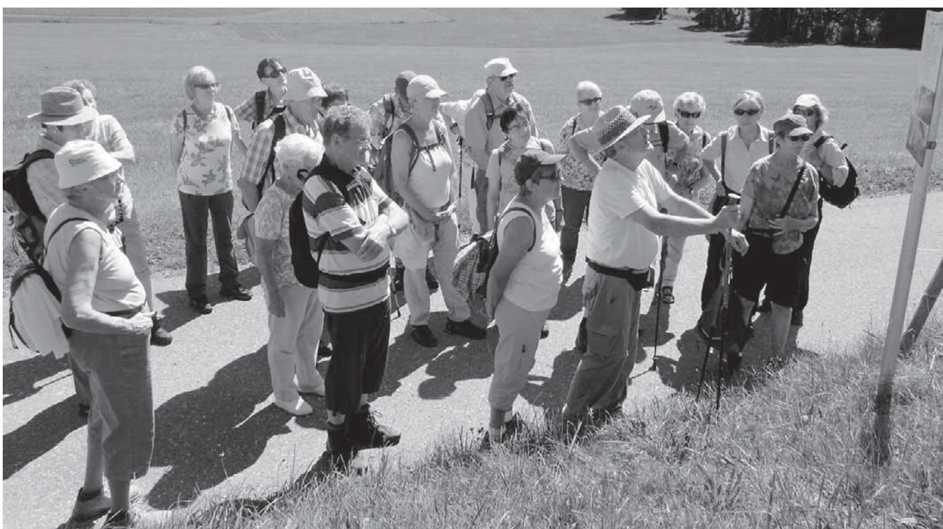
Der Schwäbische Albverein war auf den Spuren der Schwabenkinder unterwegs.

Pfullendorf/pa – Die Ortsgruppe Pfullendorf im Sozialverband VdK bietet seinen Mitgliedern auch in den Ferien ein abwechslungsreiches Programm. Mit dem Bus ging es zunächst nach Überlingen und dann weiter mit dem Schiff nach Stein am Rhein. Beim Stadtrundgang konnten die Teilnehmer viel entdecken und es gab viel Gelegenheit für nette Gespräche. Der nächste Tagesausflug ist für Oktober geplant.