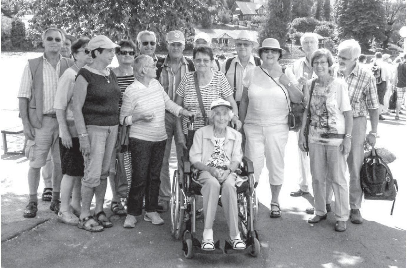
Der VdK unternahm einen abwechslungsreichen Ausflug nach Stein am Rhein.