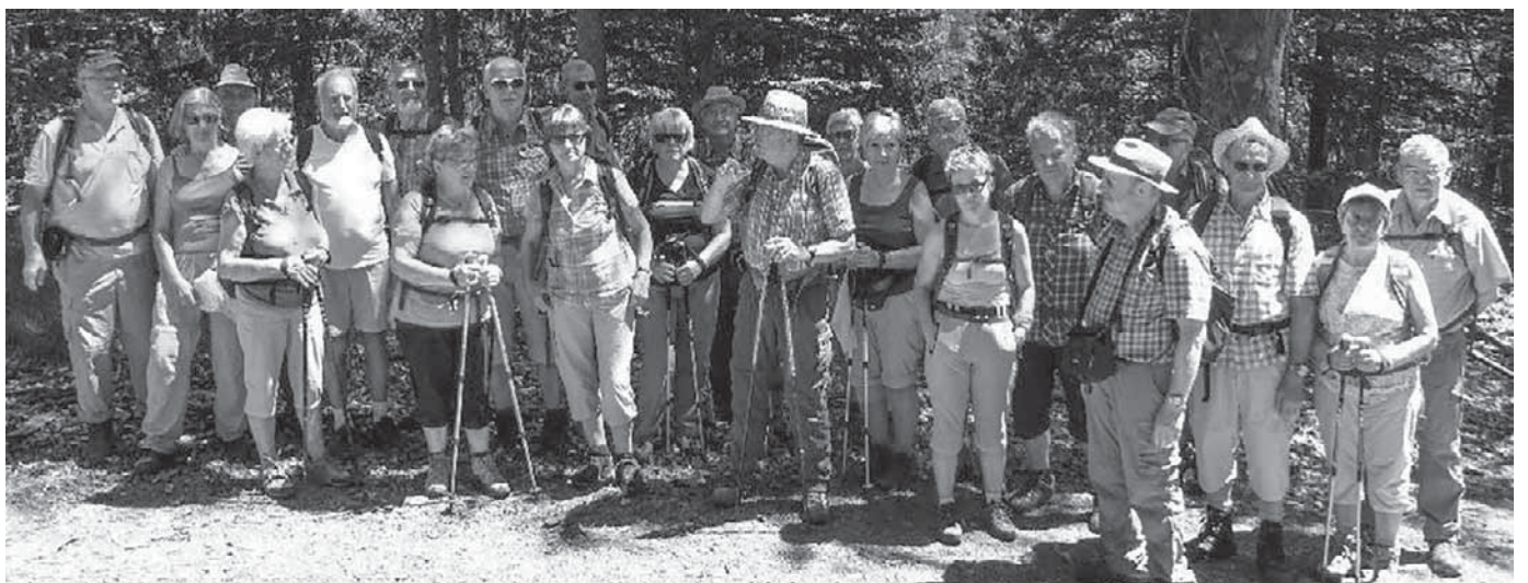
Die Wanderfreunde des Schwäbischen Albvereins und des DAV unternahmen eine gemeinsame Wanderung im Schwarzwald.