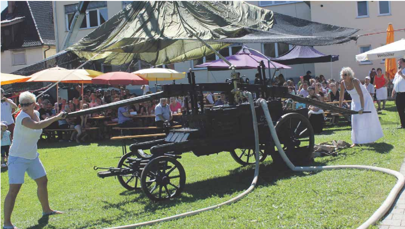
Beim traditionellen Fest der Denkinger Feuerwehr sorgte der Spritzenwettbewerb mit der historischen Wasserspritze für viel Amüsement bei den Teilnehmern und Zuschauern. Fünf Mannschaften gingen an den Start. Weibliche Verstärkung hatten allerdings nur die Holzhaudere mitgebracht.

Amtliches Mitteilungsblatt der Stadt Pfullendorf und ihrer Stadtteile Aach-Linz, Denkingen, Gaisweiler, Großstadelhofen, Mottschieß, Otterswang, Zell a. A.