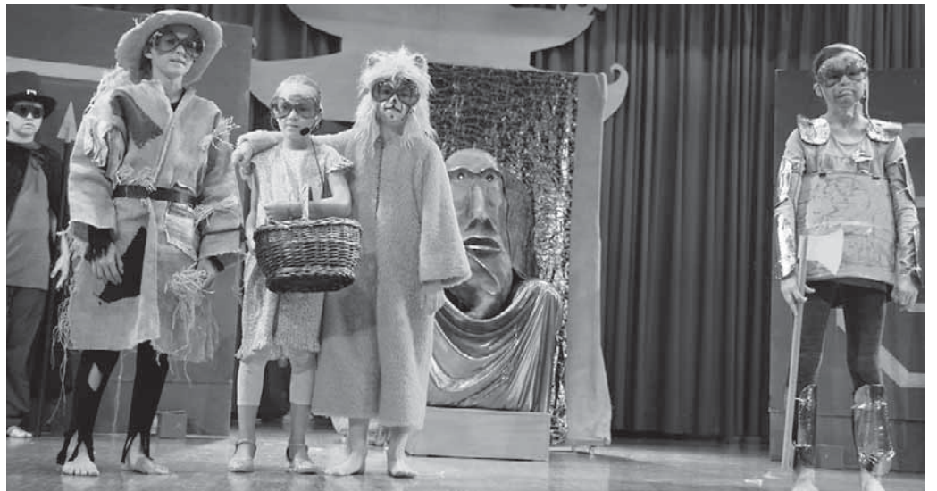
Die Viertklässler der Härle-Schule brachten zum Abschluss ihrer Grundschulzeit das Stück »Der Zauberer von Oz« auf die Bühne.

bedanken sich bei der kleinen Maus für das Erwecken des Löwen aus seinem Schlaf wegen der gefährlichen, doch wunderschönen Mohnblumen. Es bedarf der Überwältigung der bösen Hexe des Westens mit ihren Flügelaffen, bis die tapferen Freunde wieder zum Zauberer von Oz zurückgehen. „Wenn ihr wollt, dass ich meine Zauberkräfte nutze, um eure Wünsche zu erfüllen, müsst ihr erst etwas für mich tun: Helft mir und ich helfe euch“, spricht der erhabene Zauberer. Doch auch nach getaner Arbeit der vier Freunde will der Zauberer sein Versprechen nicht einlösen, wird eher noch als kleiner, schlechter Zauberer entlarvt, der aus dem Zirkus kam. Im Publikum war es ganz leise, alle verfolgten gebannt das Stück mit den schönen Requisiten und dem schönen Bühnenbild. Durch bunte Lichtspots und die technische Arbeit von Marc Neumann und Mario Serazio wurden die Figuren ins richtige Licht gerückt, und jeder kann die gesprochenen Texte gut hören. Laut und deutlich spricht der entlarvte Zauberer, dass dem Strohmann nur der Denkerhut fehle, dem Blechmann überreicht er eine Taschenuhr in Herzform, und der feige Löwe bekommt eine Flasche Götterspeise. Doch eigentlich komme der Mut aus jedem selbst, gibt der Zauberer zu bedenken. Dorothy bekommt von der guten Fee des Südens einen guten Rat und kommt mit ihren Zauberschuh wieder zu Tante Em und Onkel Henry.