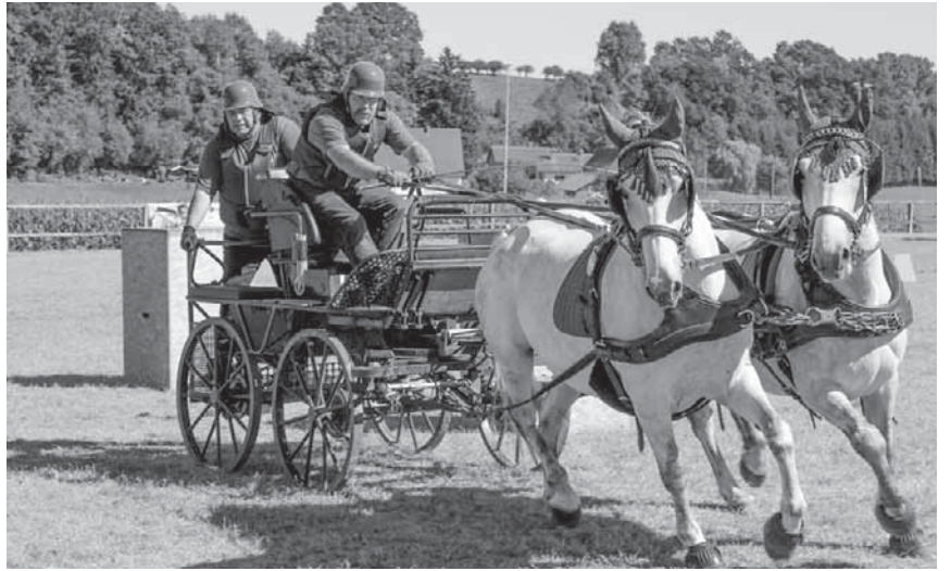
Der Reitverein Aach-Linz konnte beim nachgeholten Turnier mehr Fahrer und Reiter begrüßen als in früheren Jahren.