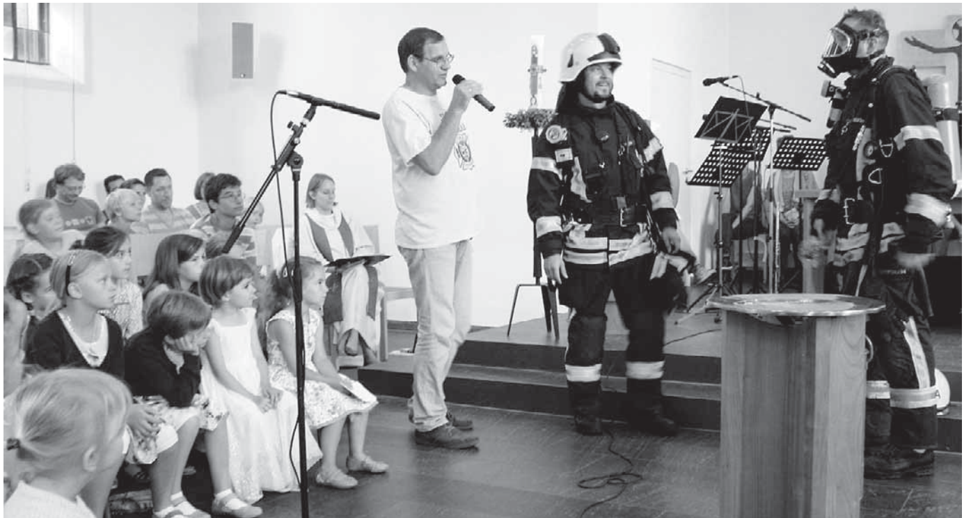
Im Familiengottesdienst stellten Feuerwehrleute ihre Ausrüstung vor.