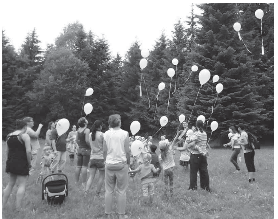
Die Kinder und Eltern des Montessori Kinderhauses ließen Wunschluftballone in den Himmel steigen.

Aach-Linz/pa - Die Kinder und Eltern des Montessori Kinderhauses unternahmen eine Familienwanderung zum Sportplatz in Aach-Linz. Nach der Begrüßung durften die Eltern und ihre Kinder ihre Füße aufmalen und anschließend die Füße in einem Kneipp-Bad erfrischen. Mit kühlen Füßen bewegte sich die muntere Wanderschar in Richtung Waldhütte. An der