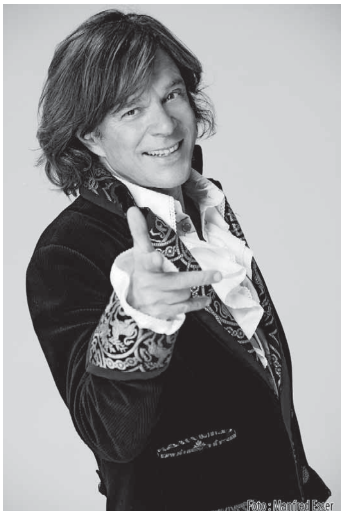
Jürgen Drews und Papi's Pumpels heizen dem Publikum bei der SWR Sommerschlagernacht am 31. Juli im Seepark ein.

Pfullendorf/pa - Die aktuelle Ausstellung von Doris Jausly in der Galerie im Grünen Haus geht am Sonntag, 24. Juli mit einer Finissage zu Ende. Die Finissage wird in Form eines literari-