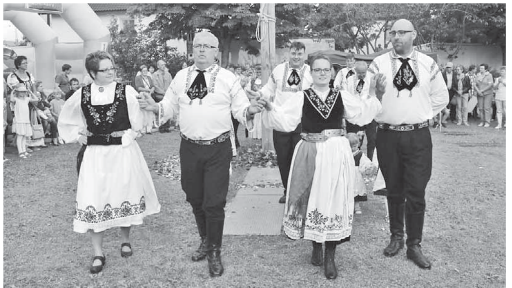
Der siebenbürgisch-sächsische Brauchtumsverein führte die Traditionen des Kronenfestes vor.

im Bregenzerwald an. Es werden täglich je nach Witterung mehrere Wanderungen und Bergtouren mit unterschiedlichen Schwierigkeitsgraden angeboten. Der Verlauf der einzelnen Touren wird jeweils am Vorabend gemeinsam besprochen. Die Touren werden von sektionseigenen Wander- und Tourenführern organisiert und begleitet. Übernachtet wird im Haus Don Bosco in Gemeinschaftsräumen. Die Teilnehmer werden mit Halbpension verköstigt.