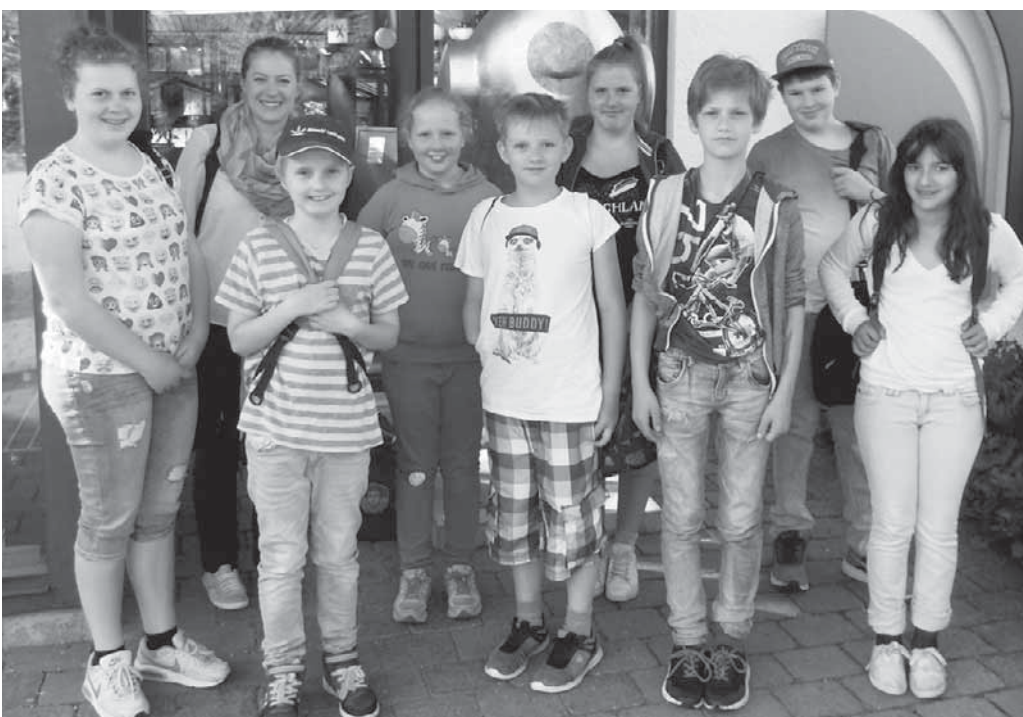
Die Schulsanitäter der Kasimir-Walchner-Schulen unternahmen einen Ausflug in die Therme.