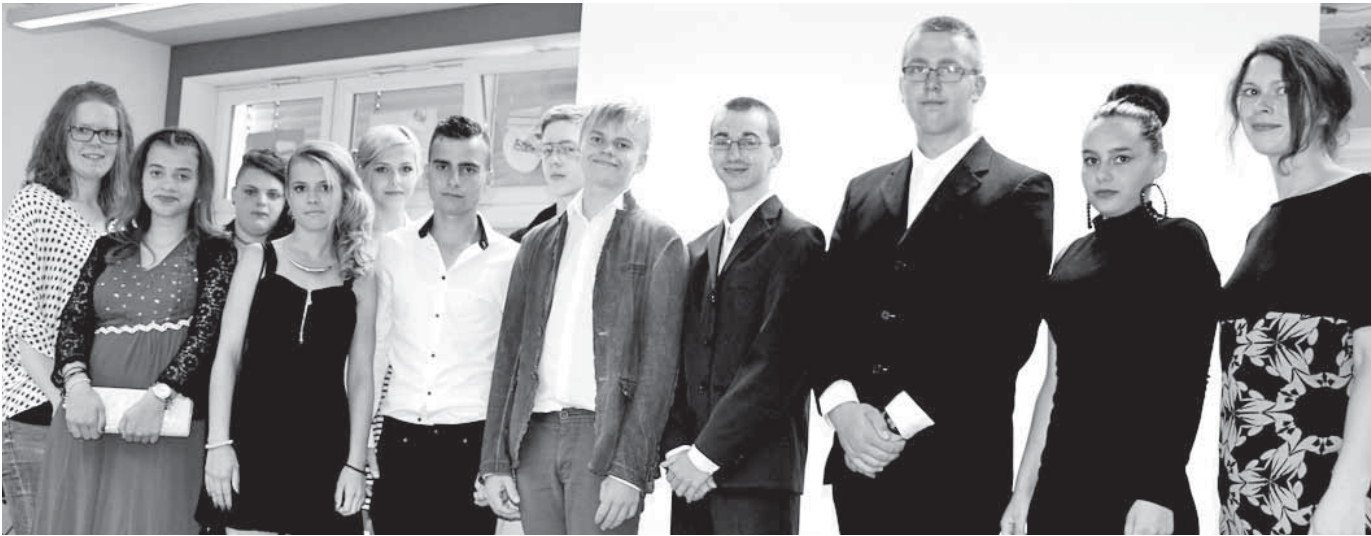
Die Kasimir-Walchner-Schule hat sich von elf Schulabgängern verabschiedet.