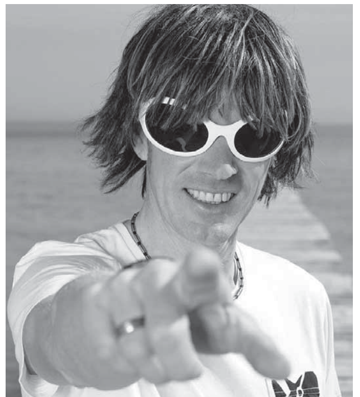
Die besten Stimmungsmacher der Insel Mallorca wie Mickie Krause sind am ersten Augustwochenende im Seepark zu Gast.