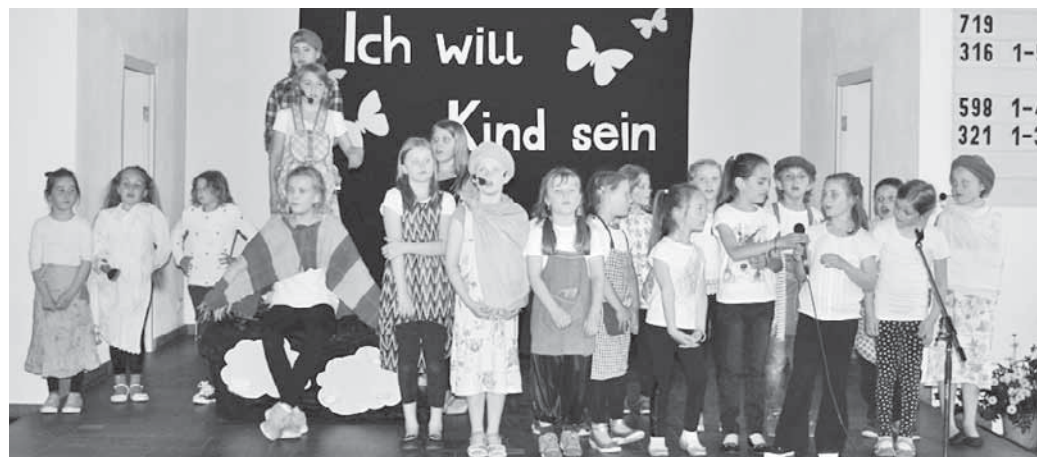
Die Chips & Flips Juniors begeisterten das Publikum mit einer tollen Musicalaufführung.