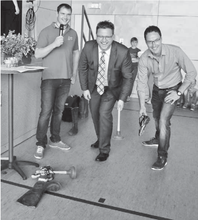
Höhepunkt des Sommerfests war das Schuh- und Pömpelwerfen, an dem sich auch der Ortschaftsrat beteiligte.