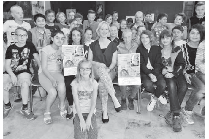
Die Fünftklässler der Realschule lernten bei einer Lesung die Geschichte des Flüchtlingsjungen Salim kennen.

zeugführer beanstandet, die die Fußgängerzone unberechtigt benutzen, sondern auch Radfahrer, die nicht mit der vorgeschriebenen Schrittgeschwindigkeit fahren. Bedingt durch die Hanglage fahren viele Radfahrer von der oberen Hauptstraße kommend verhältnismäßig schnell über den Marktplatz, wodurch Fußgänger gefährdet werden können und eine erhebliche Unfallgefahr entsteht. Vor allem kleine Kinder werden dann oft erst recht spät wahrgenommen. Zu schnelles Fahren in der Fußgängerzone kann mit einer Geldbuße geahndet werden.