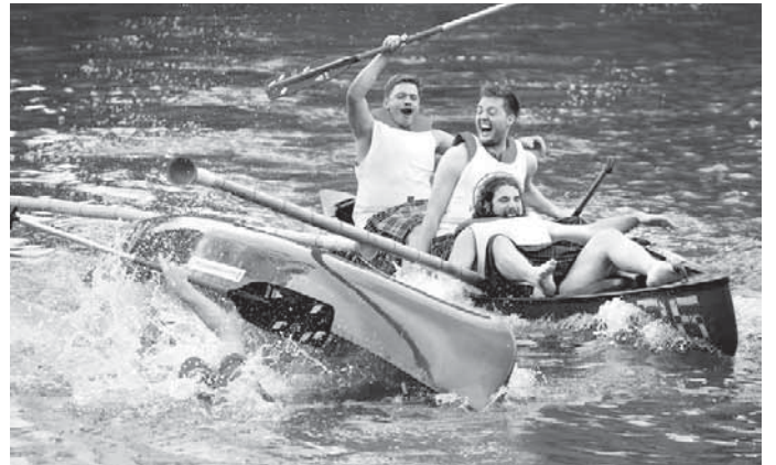
Das Fischerstechen auf dem Stadtsee bereitete Teilnehmern und Zuschauern gleichermaßen Spaß.