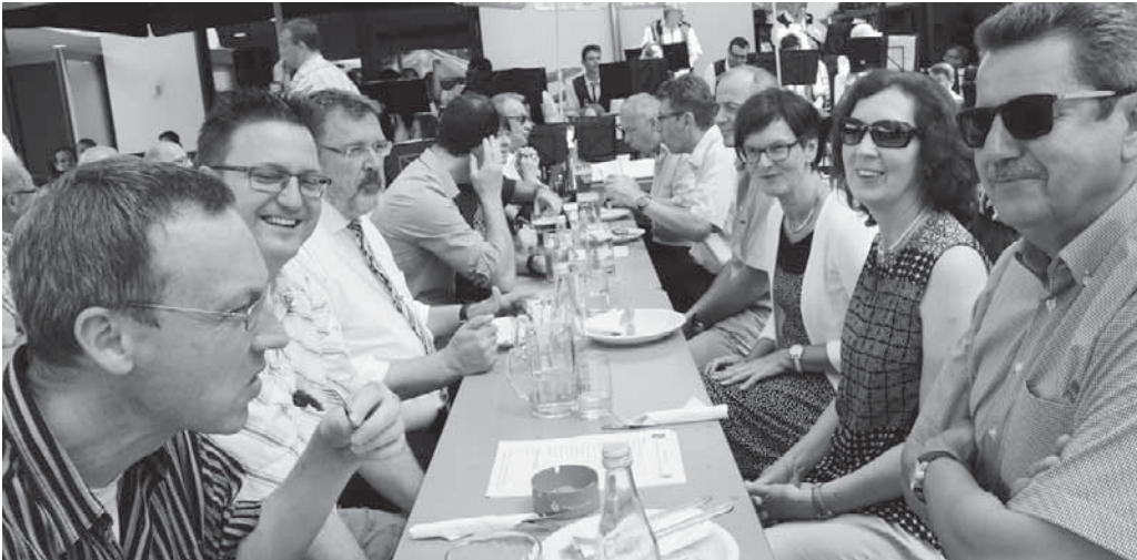
Neben vielen Gästen aus der näheren und weiteren Ferne kamen auch die Vertreter der anderen Teilorte und die Gemeinderäte, um mit den Otterswangern zu feiern.