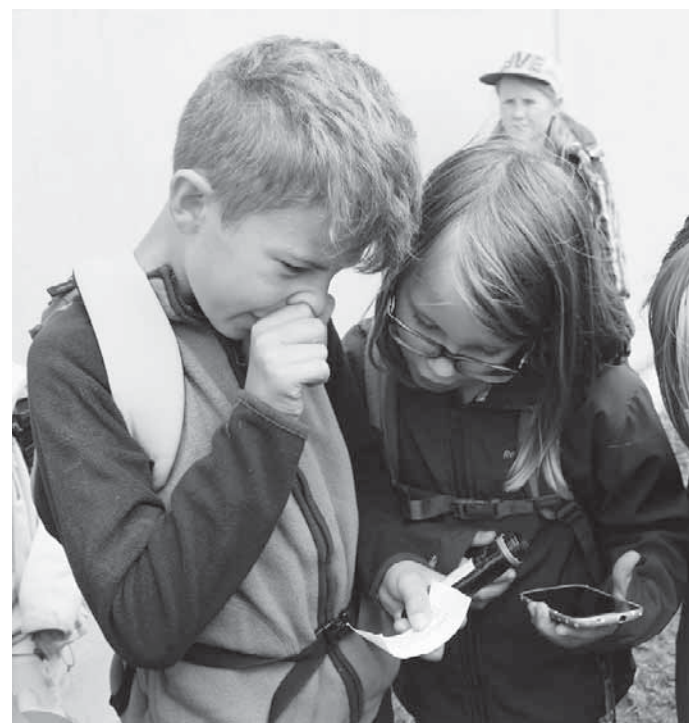
Die Dritt- und Viertklässler begaben sich mit Hilfe von GPS auf eine Schatzsuche.

Pfullendorf/pa – Die zehn Pfullendorfer Schulen haben von der