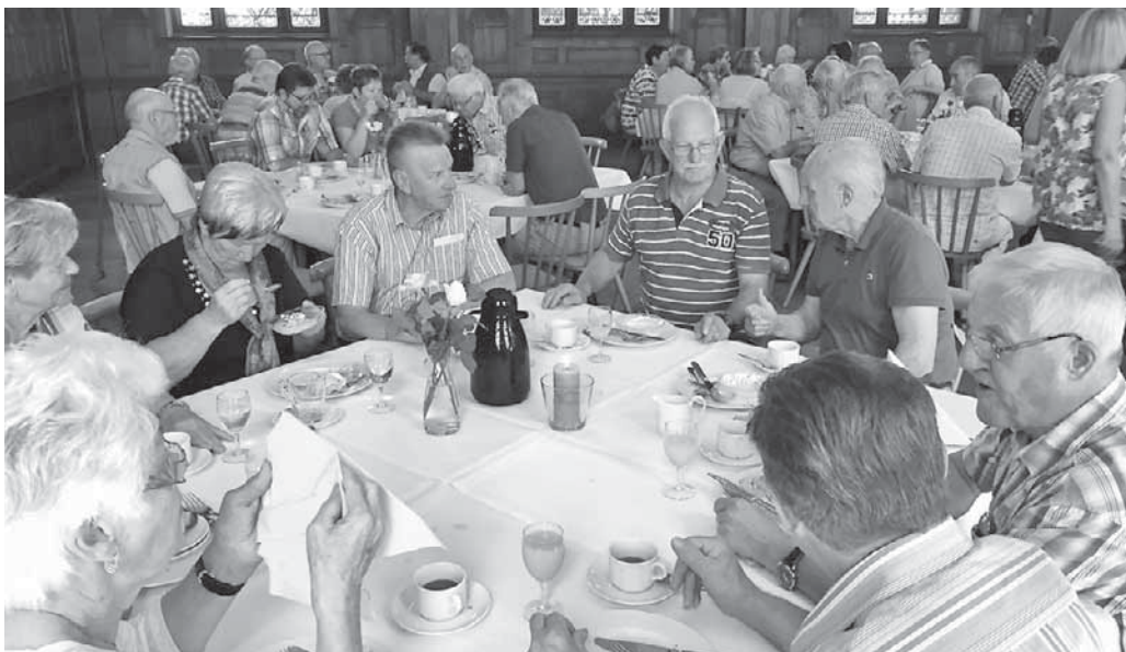
Die Geberit-Rentner unternahmen einen interessanten Ausflug nach Rottweil.