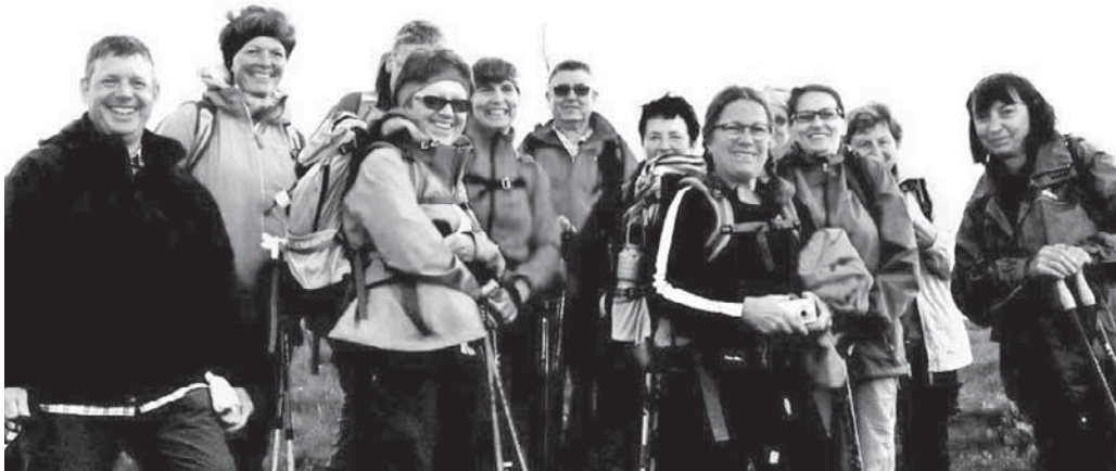
Die Bergfreunde des DAV unternahmen eine Wanderung im Allgäu.