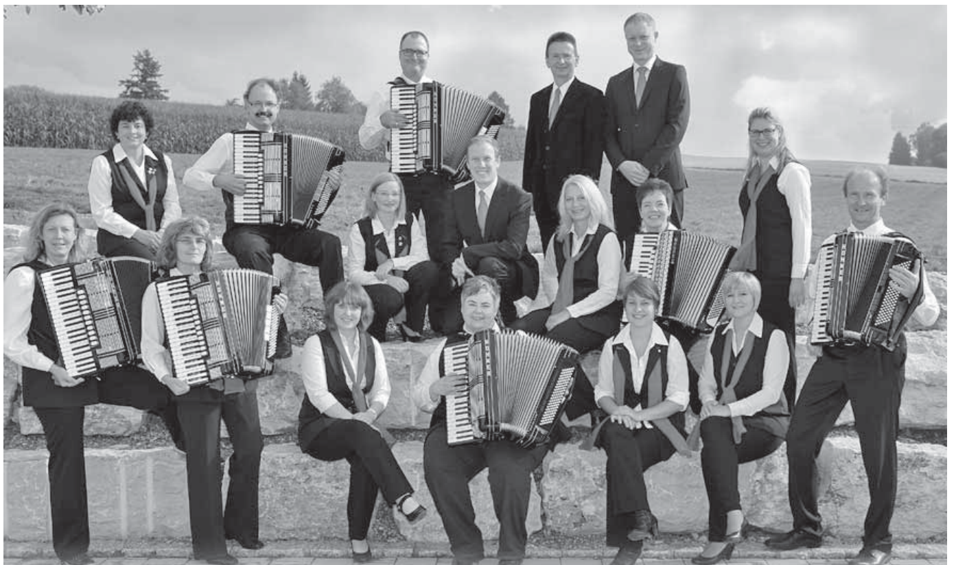
Das Akkordeon-Orchester lädt wieder zu einem Herbstkonzert ein.