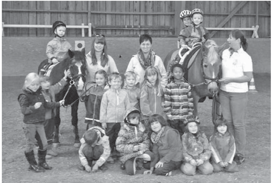
Die Kinder des Evangelischen Tagheims lernten beim Reitverein den Umgang mit Pferden kennen.

Pfullendorf/pa - „Pferde für unsere Kinder“. Unter diesem Motto fiel der Startschuss für die gleichnamige Initiative. Das Ziel: In zehn Jahren soll jedes Kind in Deutschland die Möglichkeit haben, in seiner persönlichen Entwicklung durch den positiven Einfluss des Pferdes unterstützt zu werden. Bereits im Rahmen des großen Reitturniers im August hat das erste Holzpferd den Weg ins Kindertagheim nach Pfullendorf gefunden. So sollen in der nächsten Zeit weitere zehn Pferde samt Sättel an die Kindergärten übergeben werden. Kürzlich haben sich 18 Kinder des Kindertagheims samt ihren Erzieherinnen auf der Reitanlage des Reit- und Fahrvereins in Brunhausen eingefunden, um die echten Pferde kennenzulernen. Betreut von zwei Trainern des Reitvereins konnten die Kinder spielerisch mit Pferd und Pony in Kontakt treten. Gleichzeitig lernten sie den Umgang mit den Tieren und ganz nebenbei noch viele interessante Dinge rund um das Thema Pferd und Reiten. Die Ponys und Pferde wurden geputzt, gestriegelt, gesattelt und aufgetrennt. Anschließend durften die Kinder erste Erfahrungen auf dem Rücken der vereins-eigenen Schulpferde Tamina und Speedy machen. Die Kinder waren begeistert.