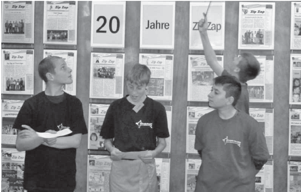
Die Schüler der Zip Zap-Redaktion stellten die 20-jährige Geschichte der Schulzeitung vor.