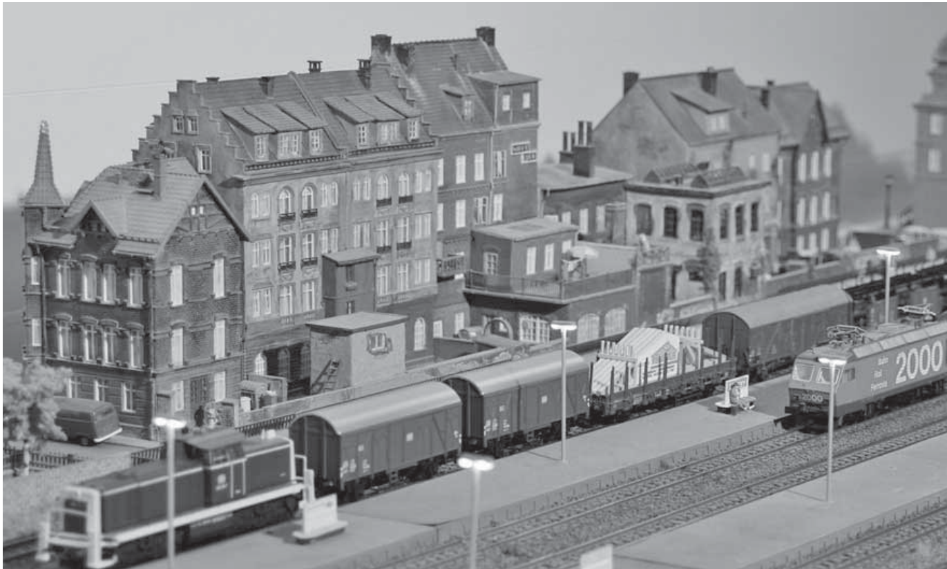
Der Modelleisenbahn-Club lädt am Wochenende wieder zur beliebten Ausstellung mit zahlreichen Modelleisenbahn-Anlagen und einem abwechslungsreichen Rahmenprogramm in die Stadthalle ein.

Sonntag, 15. November, jeweils von 10 bis 17 Uhr in der Stadthalle statt. Die Mitglieder des Modelleisenbahn-Club stellen die vier clubeigenen Anlagen vor, an denen seit der letzten Ausstellung zahlreiche Veränderungen vorgenommen wurden. Als Gäste sind außerdem dem MEC Landsberg am Lech mit seiner Anlage, auf der ausschließlich Züge der königlich bayrischen Staatsbahn fahren, der Verein Ottobeuren mit seiner Günzthal Museumsbahn in Spur N und die Freunde aus Ortenau mit einer dem Kinzigtal