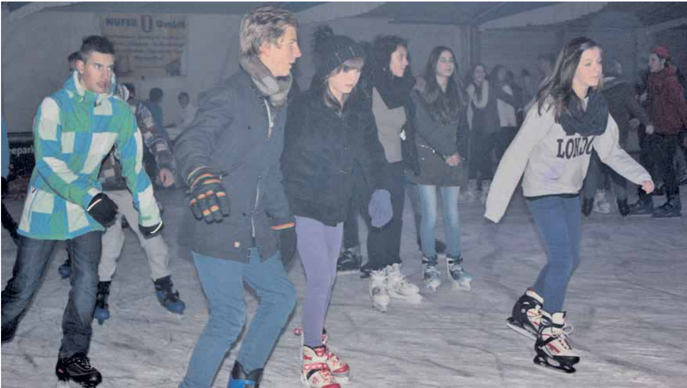
Das Eiszelt im Seepark lädt wieder zu coolem Schlittschuhvergnügen ein. Am Freitag geht es mit der beliebten Eisdisco los. Voraussichtlich bis 31. Januar bleibt das Eiszelt geöffnet.

Amtliches Mitteilungsblatt der Stadt Pfullendorf und ihrer Stadtteile Aach-Linz, Denkingen, Gaisweiler, Großstadelhofen, Mottschieß, Otterswang, Zell a. A.