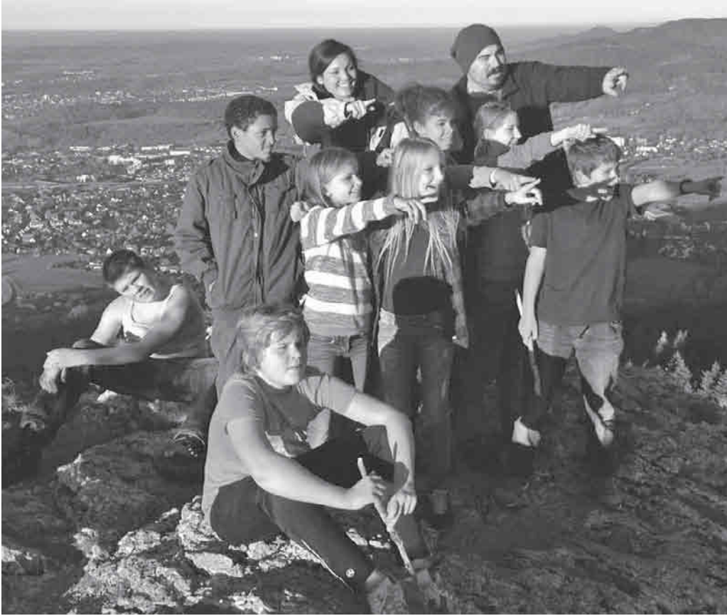
Die Mitarbeiter des Kinder- und Jugendbüros gestalteten ein spannendes Herbstferienprogramm für die Kids.

nahe zu sein. Die Jugendlichen stellten sich der Herausforderung, eine Nacht im Matratzenlager zu verbringen, die Hütte mit Holz zu beheizen und mit einfachsten Hilfsmitteln ganz ohne Strom, fließend Wasser, ohne Toilette und ohne jegliche Technik auf einer Berghütte überleben zu können. Erschöpft aber sehr zufrieden, stolz und mit zahlreichen neuen Erfahrungen kehrten die Abenteurer wieder zurück nach Pfulleendorf. Für zwanzig Kinder im Grundschulalter hieß es „Natur pur“. Nach einer Wanderung zum Neidlinger Grillplatz warteten bei strahlendem Sonnenschein viele Spiele, Spaß und verschiedene Aufgaben zum Thema Wald auf die Kinder. Nach dem Erkunden des Waldes und einer spannenden Schatzsuche wurde als Abschluss zusammen an der Grillstelle gegrillt.