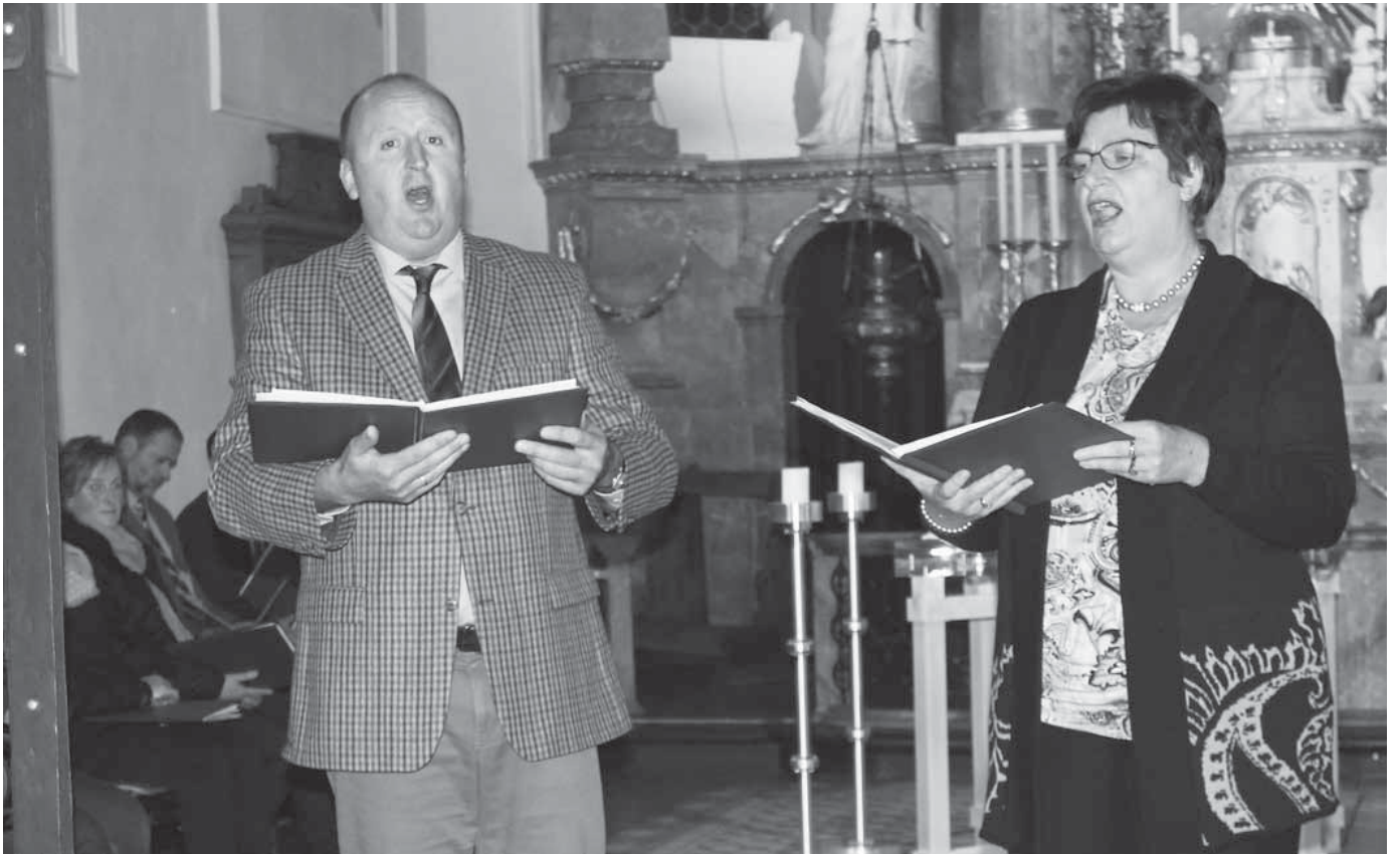
Der Kirchenchor Otterswang erfreute sein Publikum mit einem abwechslungsreichen Konzert, zu dem auch Gesangssolisten und Instrumentalspieler beitrugen.