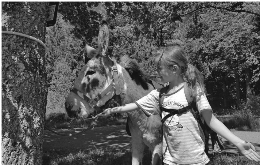
Am Dienstag, den 3. Oktober geht es gemeinsam mit sechs Eseln als Wanderführer auf Tour.

an tourist-information@stadt-pfullendorf.de erforderlich. Wer sich angemeldet hat und leider doch nicht kann, sagt bitte ab!