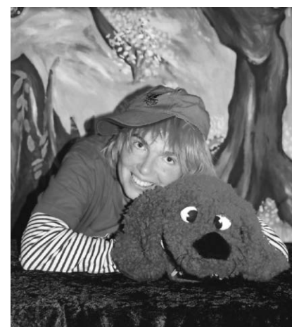
Die Puppenbühne in Ostrach startet ab 8. Oktober in die neue Saison.

Pfullendorf/pa - Bald ist es wieder soweit. Ab Oktober öffnet die Puppenpühne Ostrach wieder regelmäßig ihren Vorhang. Die erste Aufführung findet am Sonntag, 08.10. um 15 Uhr statt. Es wird das Stück „Die Geschichte vom Wackelzahn“ für Kinder ab 4 Jahren aufgeführt. Um telefonische Platzreservierung wird gebeten unter: 07585 / 3315. Weitere Informationen sind im Internet unter: www.puppenbuehne-ostrach.de zu finden.