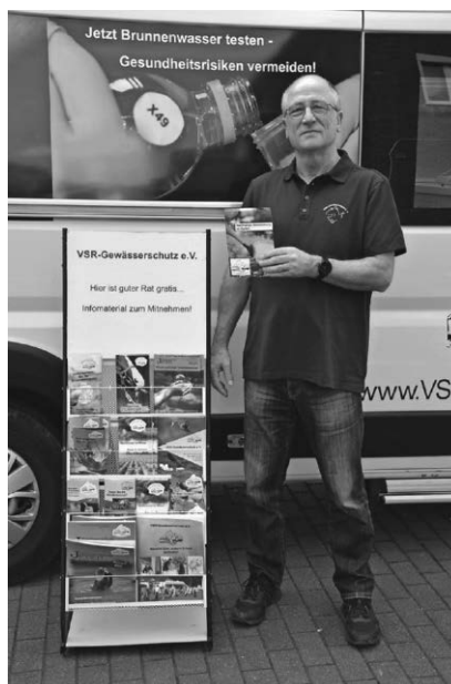
Der VSR Gewässerschutz informierte am 4. September in Sigmaringen zum nachhaltigen Umgang mit Wasser.

Sigmaringen/pa - Insgesamt 17 neue Auszubildende, Studierende und eine Freiwillige haben am 1. September ihre Ausbildung, ihr