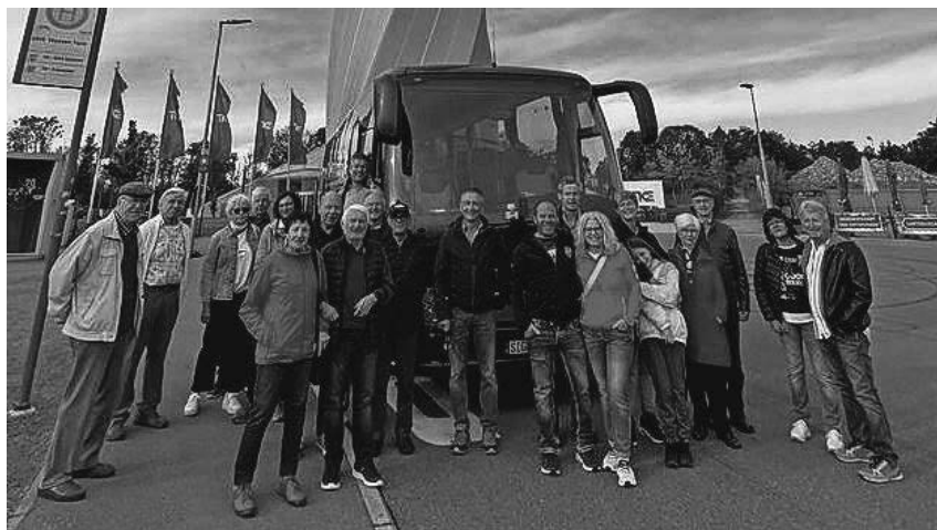
Für die Mitglieder des Eisstockvereins ging es nach Rottweil.

Pfullendorf/pa - Die Sektion Pfullendorf im DAV veranstaltet am Dienstag, 03. Oktober eine Bergwandertour auf das Buochserhorn am Vierwaldstätter See. Ausgangspunkt ist an der Bergbahn in Dallenwil. Die Wanderung (BM) erfordert gute Kondition, die Laufzeit beträgt etwa 5-6 Stunden. Bei einer Streckenlänge von ca. 13 Km überwindet man 1.350 Höhenmeter und 750 m Abstieg, der weitere Abstieg erfolgt mit einer Seilbahn. Abfahrt zur Tour in Fahrgemeinschaften ist am Dienstag um 7 Uhr am Stadtgartenparkplatz. Die Wanderung findet nur bei gutem Bergwetter statt. Tour-Info und Anmeldung bis