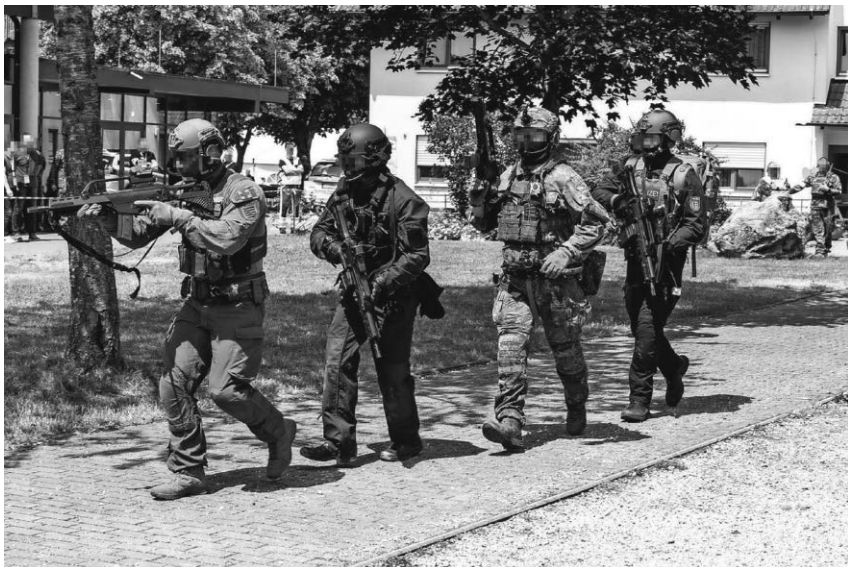
Polizei und Bundeswehr beim gemeinsamen Vorgehen.