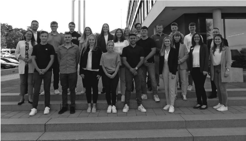
Für die neuen Auszubildenden standen in der ersten Woche beim Landratsamt die Einführung und das gegenseitige Kennenlernen im Vordergrund.