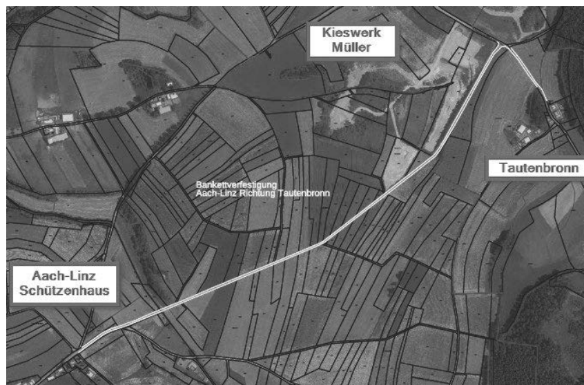
Die Verbindungsstraße zwischen Tautenbronn und Aach-Linz wird ab 9. Oktober aufgrund von Bankettverfestigungsarbeiten voll gesperrt. Grafik: Stadt

sowie die hohe Verkehrsbelastung machen in diesem Streckenabschnitt eine Bankettverfestigung notwendig. Die Umleitung erfolgt über die L194 Kreisverkehr Überlingerstraße & Stockacherstraße in Richtung Aach-Linz sowie auch in Richtung Pfullendorf. Die Anlieger von Tautenbronn können die Ortschaft in Richtung Aftholderberger