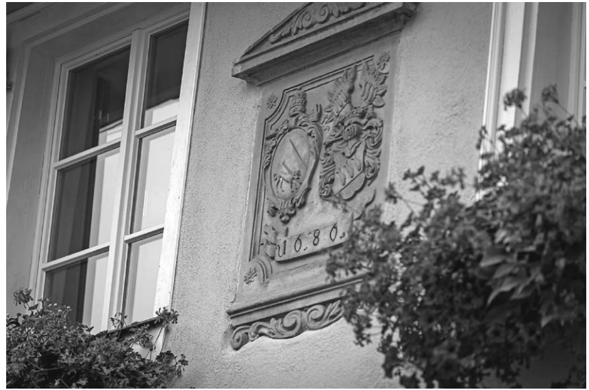
Die Tourist-Information lädt am 8. Oktober zu einer Themenführung „Klostergeschichten aus Pfullendorf“ ein.

Diese Themenführung findet am Sonntag, den 08. Oktober um 17:00 Uhr statt. Die Führung dauert ca. eine Stunde. Die Kosten liegen bei 5,00 € pro Person, Kinder unter 12 Jahren sind kostenfrei. Beginn der Führung ist beim ehemaligen Franziskanerinnenkloster, heute bekannt als Notariat oder Musikschule. Eine Anmeldung ist nicht erforderlich.