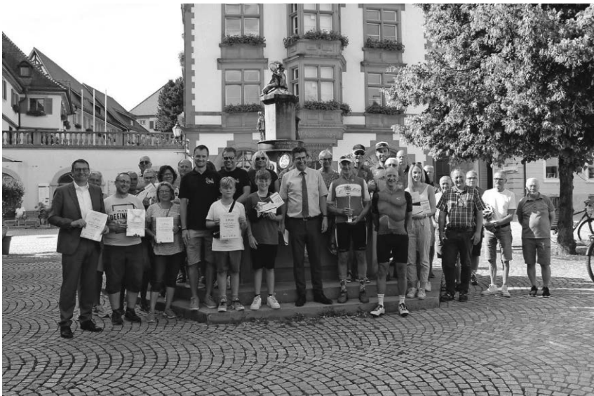
Bürgermeister Gerster ehrt die Pfullendorfer Teilnehmer am Stadtradeln auf dem Marktplatz.