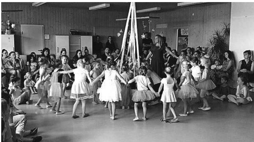
Die Kinder des Familienzentrum Neidling begeisterten ihr Publikum mit einer Ballettaufführung.

Im Anschluss an die Tanzaufführung konnte das Publikum die Kunstwerke der Künstlerinnen und Künstler bewundern und gegen eine Spende erwerben. Jede Spende trug dazu bei, eine positive Veränderung in das Leben von den Kindern des Kindergartens in Paternoster zu bringen. Insgesamt kam ein Betrag von 520 Euro zusammen. Das Projekt „Tanzen und Malen für Südafrika“ ist ein inspirierendes Beispiel dafür, wie kleine Schritte große Veränderun-