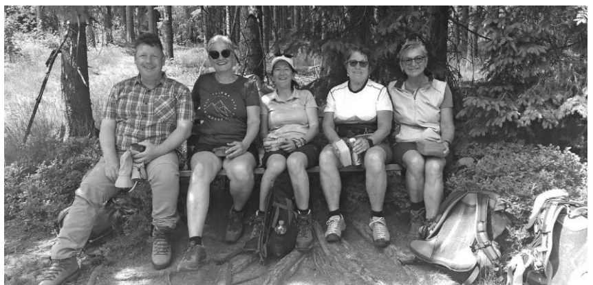
Die Mitglieder des DAV auf dem WasserWeltenSteig.

Pfullendorf/pa - Am Sonntag, den 18. Juni 2023, haben sich 6 Wanderer und Wanderinnen der Sektion Pfullendorf des Deutschen Alpenvereins getroffen, um die erste Etappe des neuen WasserWeltenSteigs zu bewandern. Ausgangspunkt war der Parkplatz an der Martinskapelle an der alten Passstraße von Furtwangen im Schwarzwald. Vorbei ging es am imposanten Güntherfelsen, hinab ins Katzensteigtal, vorbei an der Piuskapelle und danach talaufwärts zum Doldenhof bzw. zur Katharinenhöhe. Es folgte ein kurzer Abstieg ins Weissenbachtal, ein Bummel durch Wiesen und Weiden und durch das nette Städtchen Schönwald im Schwarzwald wieder hinauf Richtung Reinertonishof. Nach einer kurzen Vesper in einem netten, alten Küferhäusle kam man in den Wald um den Blindensee und schließlich zur Aussichtsplattform am kreisrunden dunklen Moorsee. Über die Weissenbacher Höhe geht's zurück zum Ausgangspunkt. Die Wanderung war, obwohl fast