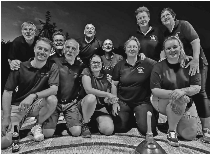
Die drei Siegermannschaften des diesjährigen Eisstockturniers.

mannschaft das Turnier gewonnen; und zwar die Kehlbachratten aus Otterswang, gefolgt von den Hexen und den DreiPluseins. Dies wurde im Anschluss an die Siegerehrung natürlich gefeiert und alle waren sich einig, dass sie nächstes Jahr wieder kommen.