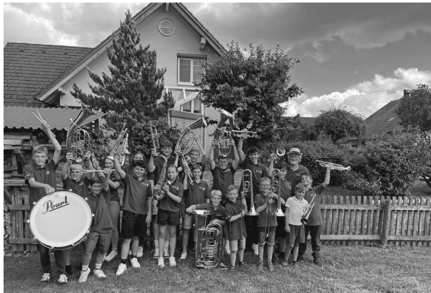
Der musikalische Nachwuchs des Musikverein Otterswang lud zum Vorspielnachmittag ein.

Otterswang/ pa - Der musikalische Nachwuchs des Musikverein Otterswang zeigte vor den Sommerferien sein musikalisches Können und lud alle Interessierten zum diesjährigen Vorspielnachmittag ins Dorfgemeinschaftshaus Otterswang ein. Die 20 Jungmusikantinnen und Jungmusikanten des Musikverein Otterswang präsentierten verschiedene Musikstücke, ehe das Jugendorchester