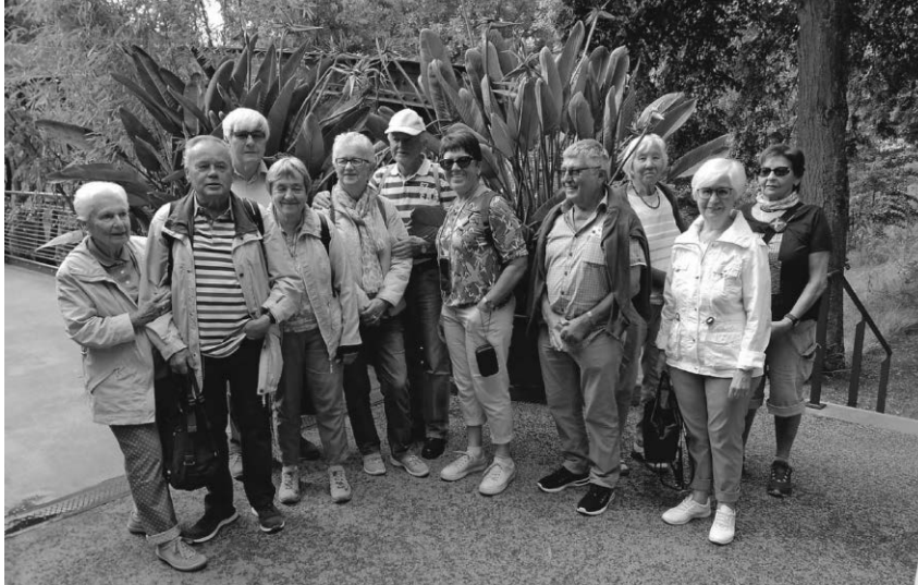
Mitglieder und Gäste der Ortsgruppe Pfullendorf des SAV haben die Landesgartenschau in Balingen besucht.

Pfullendorf/pa - Die katholische Landjugendbewegung (KLJB) und die Musikkapelle Aach-Linz ver-