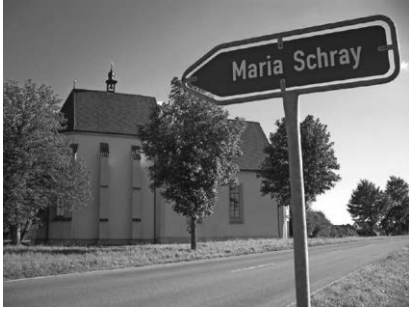
Die Kirche Maria Schray ist Teil der Kirchentour am 20. August.