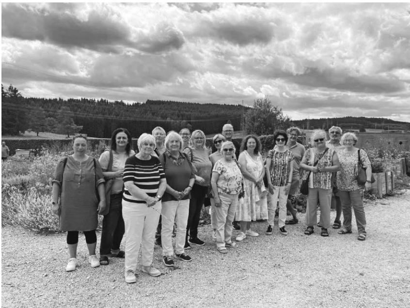
Am Tag des Dankes besuchen die Menschen, die sich ehrenamtlich für Geflüchtete engagieren, den Kräutergarten der Firma Alb-Gold in Trochtelfingen.