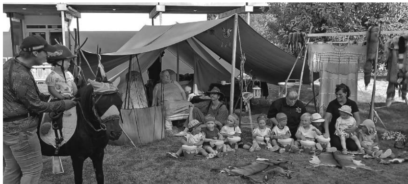
Bei den Knuddelstrolchen sind die Indianer los.