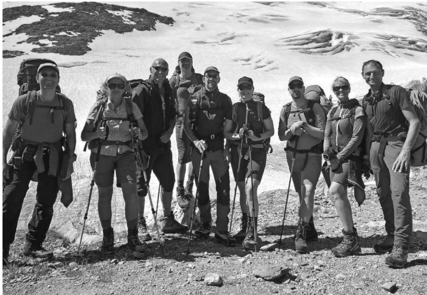
Die Teilnehmer des DAV-Gletscherkurses.