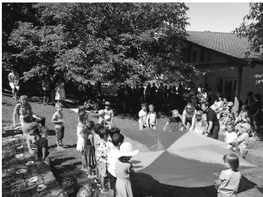
Der Kindergarten St. Christophorus feiert nach langer Pause wieder ein Sommerfest. Foto: privat

Pfullendorf/pa - Unlängst hatte der Kindergarten St. Christophorus Pfullendorf seine Türen nach einer pandemiebedingten Pause für das diesjährige Sommerfest geöffnet. Seit 2019 konnte kein gemeinsames Sommerfest stattfinden und somit war es für das ganze Team des Kindergartens St. Christophorus ein gelungener Abschluss für das zu Ende gehende Kindergartenjahr. Eltern, Großeltern und die Geschwister der Kindergartenkinder waren hierfür zu einem gemeinsamen Picknick im Garten der Einrichtung eingeladen. Dank der reichlichen Speisen- Spende durch die Eltern, war für alle gesorgt und für jede*n etwas dabei.