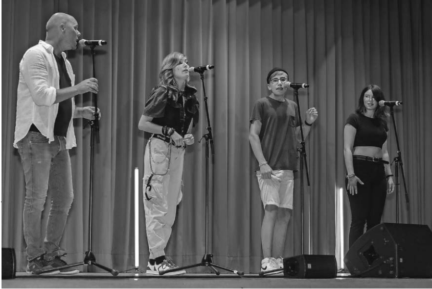
Die Gesangsgruppe „Klanglichter“ vom Haus Nazareth in Sigmaringen präsentiert Lieder über Vertrauen und Miteinander.

Die pädagogischen Fachkräfte hatten mit den Kindergartenkindern diverse Lieder einstudiert und am Sommerfest für die Familien mit Euphorie aufgeführt.