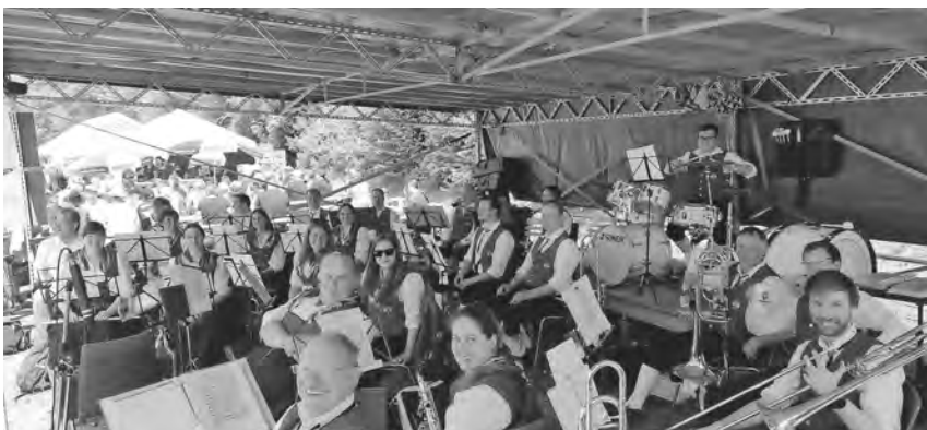
Der Musikverein Denkingen hat bei den Musikkameraden in Wißgoldingen aufgespielt.

Pfullendorf/pa - Seit knapp einem Jahr bietet der Turnverein 1860 Pfullendorf e.V. immer Freitag nachmittags Basketballtraining für Kinder zwischen 6 und 12 Jahre an. Gerne möchte die Trainerin den Basketballsport weiter ausbauen und fest etablieren. Für dieses Vorhaben braucht sie dringend Unterstützung und sucht in Pfullendorf nach Co-Trainer*innen. Dafür kommen alle Erwachsenen und Jugendliche in Frage, die sich für diesen Ballsport begeistern und eventuell Erfahrungen im Spiel haben. Dies ist jedoch keine Voraussetzung, denn im Jugend- und Erwachsenenbereich gibt es sehr gute Möglichkeiten, sich über den Basketball Verband Baden-Württemberg (BBW) als Trainer*innen aus- und fortzubilden. Interessierte wenden sich gerne telefonisch an die Geschäftsstelle unter 07552-409630 oder per Mail an info@turnverein-pfullendorf.de