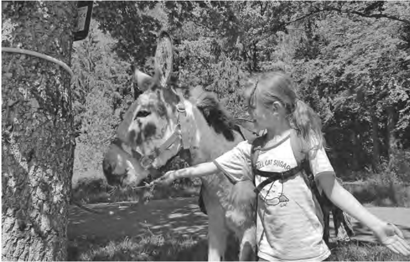
Am Sonntag, den 16. Juli geht es gemeinsam mit sechs Eseln als Wanderführer auf Tour.

dürfen abwechselnd in die Kutsche sitzen und sich ziehen lassen. Am Ziel haben die Zwei- und Vierbeiner Zeit für eine ausgiebige Rast. Ein tierischer Ausflug für die ganze Familie! Start und Treffpunkt ist der Pfullendorfer Bahnsteig am Stadtgarten um 10:15 Uhr, passend zum Eintreffen der Räuberbahn.