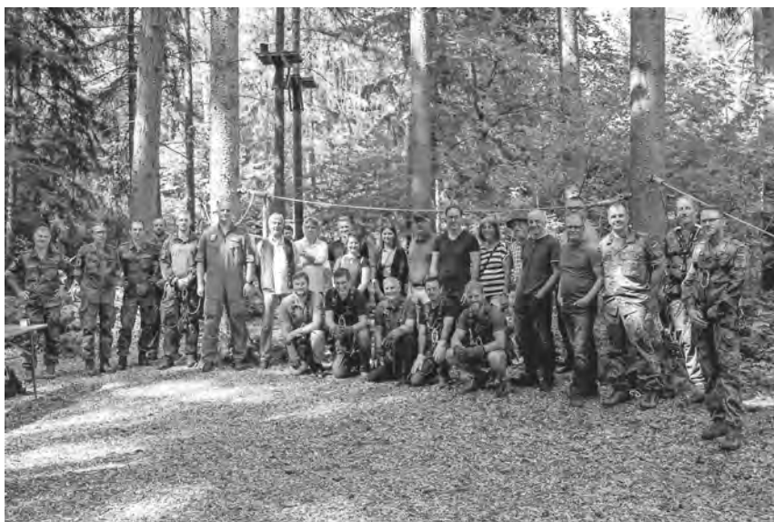
Informations- und erlebnisreich war die Führung für den Pfullendorfer Gemeinderat und Vertreter der Verwaltung durch die Ausbildungseinrichtung.