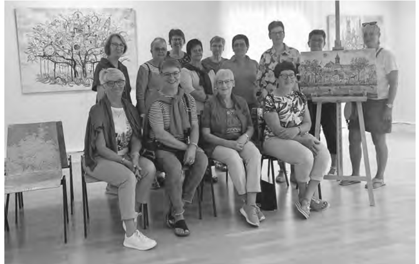
Mittwochsturnerinnen vom TVP besuchen Tüten-Thitz-Ausstellung.

Denkingen/pa - Die Jugendkapelle Burgweiler/Denkingen sowie die Musikvereine Burgweiler und Denkingen laden am Sonntag, 16. Juli, erstmals zu einem Familientag ein. Er findet in der Riedhalle in Burgweiler statt und beginnt um 14 Uhr. Die Besucher erwarten verschiedene Stationen mit viel Spiel und Spaß rund um das Thema Musik. Es besteht die Möglichkeit, Blasinstrumente kennenzulernen und auszuprobieren. Für das leibliche Wohl ist mit Kaffee und Kuchen und Erfrischungsgetränken gesorgt. Alle interessierten Familien sind herzlich willkommen. Eine Anmeldung ist nicht notwendig. Zusätzlich findet am Freitag, 21. Juli, um 19 Uhr eine öffentliche Probe der Jugendkapelle mit anschließender Instrumentenvorstellung im Probelokal in Denkingen statt. Kinder, Jugendliche und Erwachsene erhalten alle Informa-