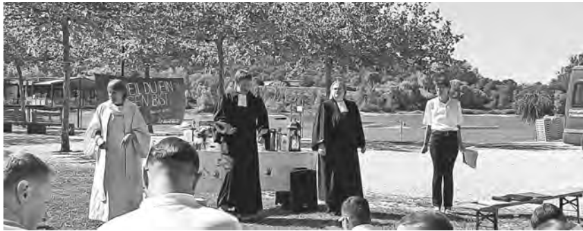
Die evangelischen Kirchengemeinden Pfüllendorf und Meßkirch feierten im Seepark ein Taufest.

Pfüllendorf/pa - Die Evangelische Kirche in Deutschland (EKD) startete im Frühsommer die Aktion #DEINETAUFE. Rund um den Johannistag am 24. Juni wurden Taufen gottesdienstlich oder Taufgottesdienste gefeiert. Die Evangelischen Kirchengemeinden Pfüllendorf und Meßkirch feierten ein großes Taufest unter dem Thema „Weil Du ein Segen bist“ im Seepark. Die Kirche mit Altar unter freiem Himmel war beim Strandbad aufgebaut. Bei strahlend blauem Himmel feierten die beiden Gemeinden den Gottesdienst zum Taufest. Die Erinnerung an die eigene Taufe und die Taufe von zehn Kindern, Jugendlichen und Erwachsenen waren der Höhepunkt. Die Täuflinge wurden von