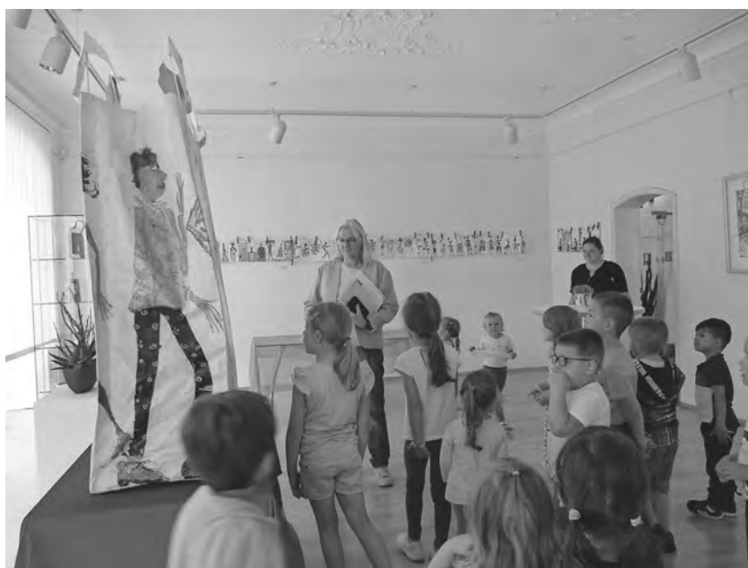
Die Kinder des evangelischen Tagheims besuchten die Bag Art Ausstellung in der Galerie Alter Löwen.