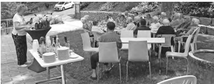
22 Seniorinnen und Senioren feierten gemeinsam vor der evangelischen Kirche.

Leiterin des neuen Fachbereichs für Migration und Integration ist Simone Kurz aus Münsingen. Die Diplom-Finanzwirtin hat an der Fachhochschule für öffentliche Verwaltung und Finanzen in Ludwigsburg studiert und arbeitete zuletzt beim Landratsamt Reutlingen, wo sie die Abteilung „Leistungen nach