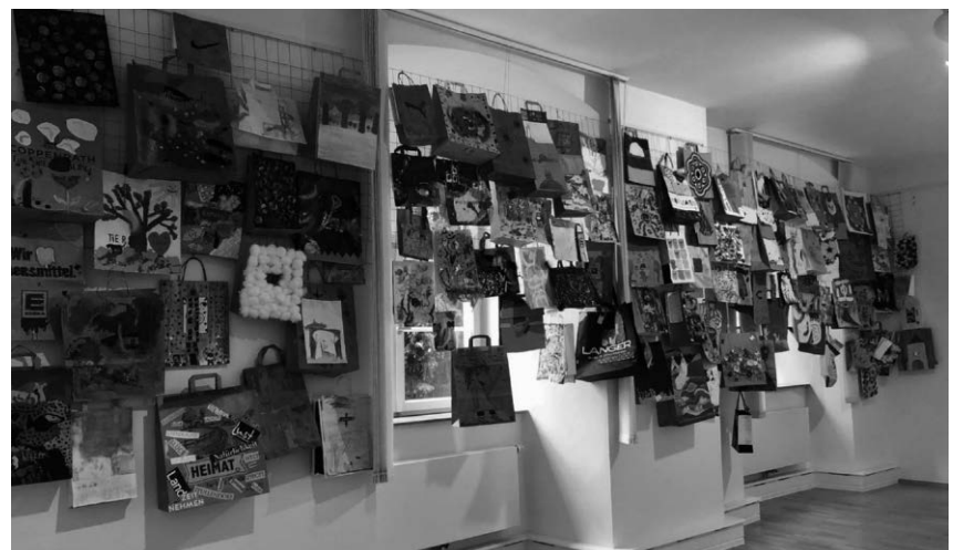
Die Tüten-Kunst-Aktion zur großen Thitz Bag-Art-Ausstellung in der Städt. Galerie „Alter Löwen“ erhält eine riesige Resonanz.