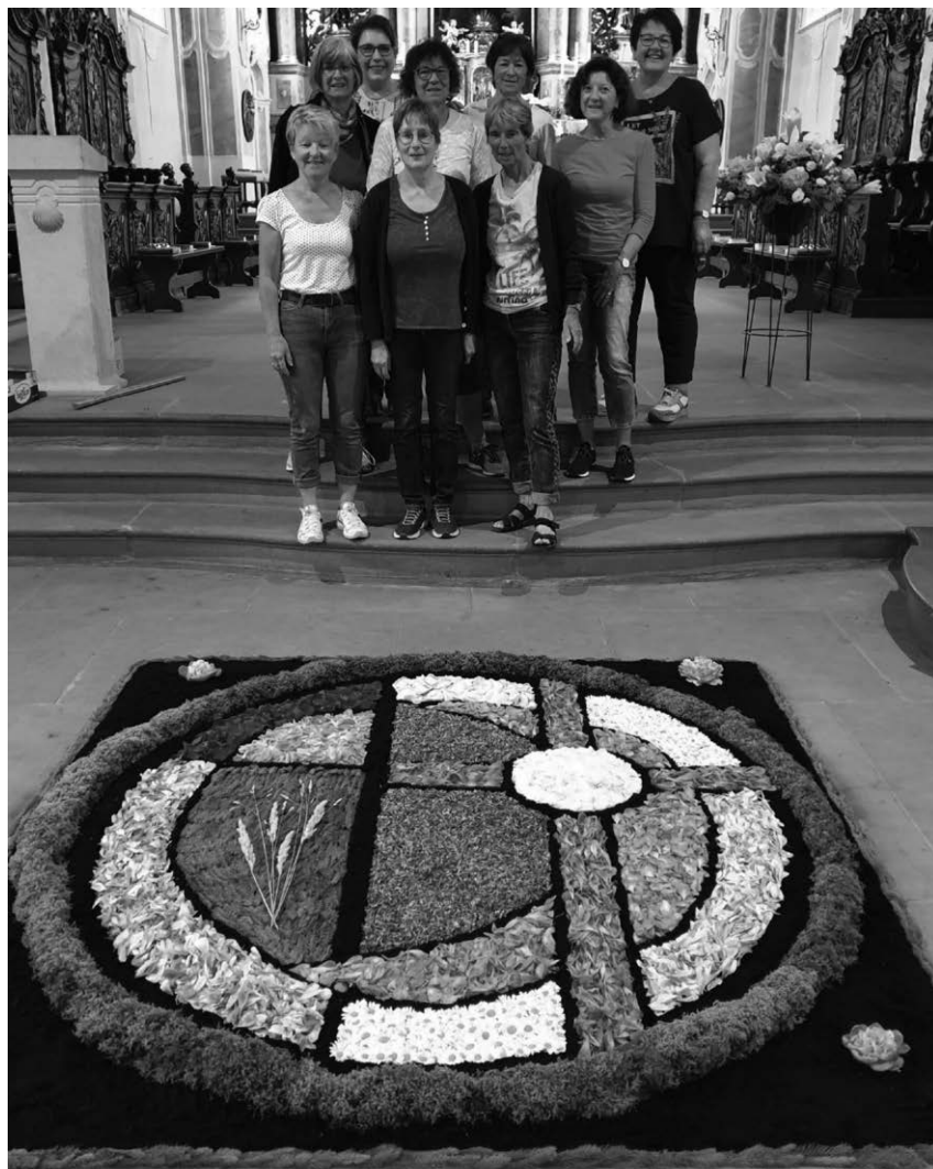
Das Mitarbeiterteam der Katholischen Frauengemeinschaft hat wieder schöne Blumenteppeiche zu Fronleichnam gelegt.

Pfullendorf/pa - Die Frauen im Mitarbeiterkreis der Katholischen Frauengemeinschaft haben auch in diesem Jahr die Blumenteppeiche für Fronleichnam gestaltet. Ein Teppich entstand in der Stadtkirche St. Jakobus. Weitere Blumenteppeiche entlang des Prozessionswegs wurde im Innenhof der Spitalpflege und auf dem Marktplatz gelegt. Begleitet wurde die Prozession nach dem Festgottesdienst von der Stadtmusik Pfullendorf. Ein herzliches Dankeschön der Frauengemeinschaft gilt den Helfern, den Spendern der Blumen, darunter auch die Klosterfloristik und Blumen Schorer und an Helmut Rebholz, der die Vorlagen gezeichnet hat.