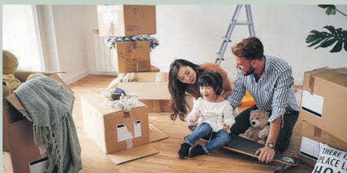
Den Traum vom eigenen Zuhause können Familien auch in der aktuellen Zinssituation noch verwirklichen.