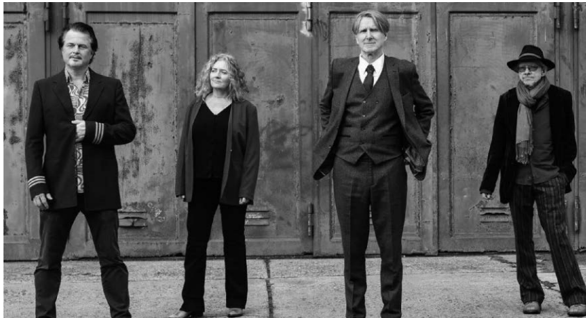
Der Sänger Lüül ist mit seiner Band am Freitag im Maison du Lac im Seepark zu Gast.

Pfullendorf/pa - Die Stadt Pfullendorf lädt in Kooperation mit dem Maison du Lac am Freitag, 23. Juni, zu einem Konzert mit Lüül ein. Beginn ist um 19 Uhr. Karten zu 16 Euro gibt es im Café Moccacoffee, Telefon 07552/408893, oder bei der Tourist-Information, Telefon 07552/251131. Der Berliner Musiker stellt sein neues Album „Der stille Tanz“ vor. Die Band wandelt zwischen Krautrock, Weltmusik und modernen Liedern. Lüüls Songs zeigen musikalische Vielfalt und mitreißenden Charme, eigenwillig und authentisch im Spagat zwischen Tiefgang und Humor, Alltagswahrnehmung und bewegenden Momenten. Begleitet wird der Sänger und Gitarrist Lüül von Kerstin Kaernbach an