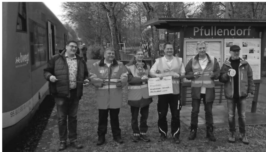
Die Räuberbahn ist in die Saison 2023 gestartet. Sie fährt als erste Bürgerbahn in Baden-Württemberg mit viel ehrenamtlicher Unterstützung.

Pfullendorf/hsg - Auf der Räuberbahn zwischen Pfullendorf und Altshausen ist die erste Bürgerbahn in Baden-Württemberg erfolgreich gestartet: Erstmals werden dort planmäßige Nahverkehrszüge nicht von einem beauftragten und bezahlten Eisenbahnverkehrsunternehmen gefahren, sondern von einer ehrenamtlich organisierten und betriebenen Bürgerbahn. Betriebsstart dieses besonderen Projekts war am 16. April. „Unsere Bürgerbahn-Züge