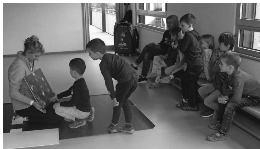
Die Vorschulkinder im Familienzentrum Sonnenschein lernten das sichere Verhalten im Verkehr kennen.

Pfullendorf/pa - Aufregenden Besuch erhielten die Vorschulkinder im Familienzentrum Sonnenschein. Bei ihnen war der Allgemeine Deutsche Automobilclub (ADAC) mit der Aktion „Aufgepasst mit Adacus“ zu Gast. Die Erzieherinnen hatten den Besuch vorher angekündigt, denn das Thema Verkehrssicherheit ist von großer Bedeutung, insbesondere für Kinder und Familien, die jeden Tag auf dem Weg zum Familienzentrum Sonnenschein den Straßenverkehr meistern müssen und natürlich auch im Hinblick auf den bald bevorstehenden Schulweg. Die Mitarbeiterin des ADAC wurde von den Kindern herzlich begrüßt. Sie ist, wie alle Mitarbeiter des ADAC eine ausgebildete Fachkraft und verfügt über umfangreiche Kenntnisse im Bereich der Verkehrssicherheit. Im Rahmen der Aktion wurden den Vorschülern in zwei aufeinander folgenden Gruppen verschiedene Themenbereiche nahegebracht, darunter beispielsweise das richtige Verhalten im Straßenverkehr sowie das Tragen von Sicherheitskleidung.