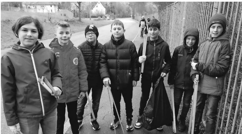
Die Sechstklässler des Staufer-Gymnasiums sammelten im Bereich der Kasernenstraße Müll ein.