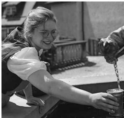
Die Tourist-Information lädt am 9. Mai zu einer Schauspielführung mit der Schankmagd Josepha ein.

Pfullendorf/hsg - Die Tourist-Information veranstaltet am Dienstag, 9. Mai, die Schauspielführung „Von Bürgern, Bier und alten Zeiten – die Schankmagd Josepha erzählt“. Beginn ist um 17 Uhr auf dem Marktplatz. Josepha schwätzt wie ihr der Schnabel gewachsen ist und plaudert so manche Geheimnisse der Stadt oder Eigenheiten von deren Bewohnern aus. Der Stadtrundgang zeigt, wie das Leben im Pfullendorf des Jahres 1774 war. Die Teilnahmegebühr beträgt fünf Euro für Erwachsene, Kinder bis zwölf Jahre sind frei. Die Teilnehmerzahl ist begrenzt. Eine Anmeldung bei der Tourist-Information, Telefon 07552/25-1131 oder E-Mail: tourist-information@stadt-pfullendorf.de ist deshalb unbedingt erforderlich. Weitere Erlebnisführungen