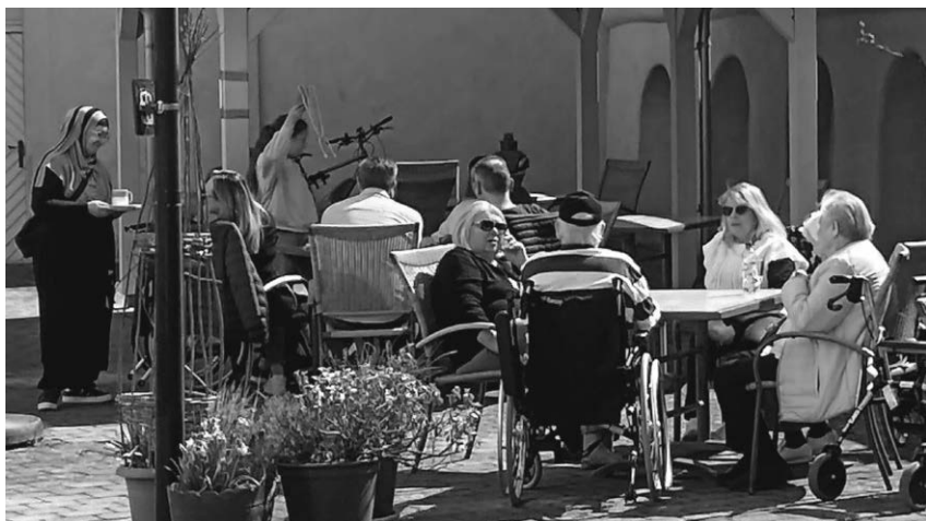
Nach langer Corona bedingter Unterbrechung öffnet das Café der Spitalpflege wieder seine Pforten für die Bewohner, deren Angehörige und die Bürger. Im Wintergarten des Pflegeheims und bei schönem Wetter auch im Freien gibt es Kaffee und Kuchen. Die nächste Öffnung ist am 18. Juni.