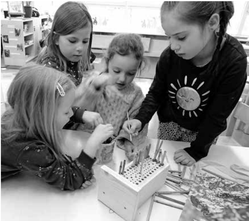
Die Kinder im Denkinger Kindergarten haben sich mit Insekten beschäftigt und ein Insektenhotel gebaut.