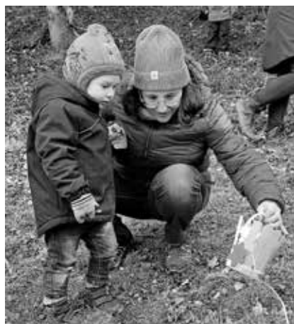
Bei der Osterfeier des Montessori Kinderhauses suchten die Kinder gemeinsam mit ihren Eltern Osterneuste.

melten sich die Teilnehmer zu einem Bewegungsspiel, bevor es wieder zurück ging.