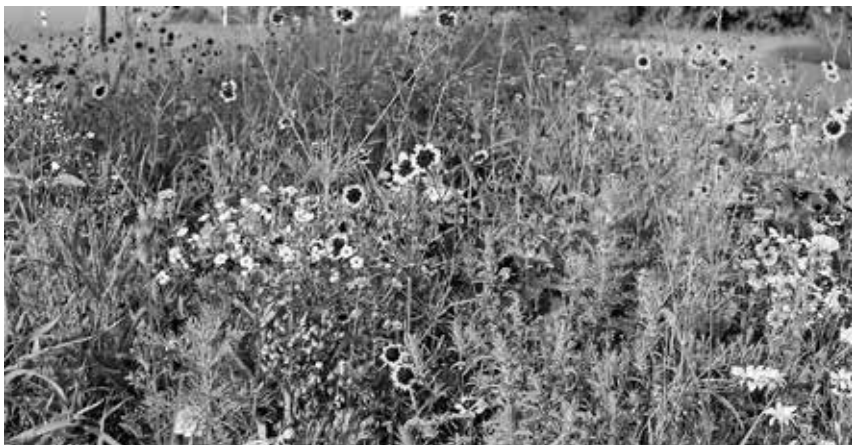
Die Samenmischung „Gönninger Sommerpracht“ für den bunt blühenden Garten ist bei der Tourist-Information erhältlich.

Pfullendorf/pa - Der Bürgerbusverein weist darauf hin, dass Hunde, die im Bürgerbus mitfahren, grundsätzlich angeleint sein müssen und einen Maulkorb tragen müssen. Diese Regel gilt unabhängig von der