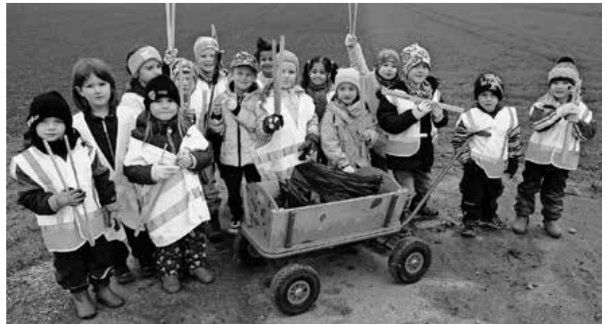
Die Kinder des Denkinger Kindergartens haben sich an der Stadtputzete beteiligt und in Denkingen Müll eingesammelt.

eine Summe in Höhe von 165 000 Euro für die Finanzierung von Projekten zur Verfügung, die der sozialen Inklusion, der gesellschaftlichen Teilhabe und der Bekämpfung der Armut dienen. Der regionale Arbeitskreis ESF Sigmaringen, der für den bedarfsgerechten Einsatz der Mittel verantwortlich ist, hat seine Förderschwerpunkte festgelegt und ruft zur Einreichung von Projektanträgen bis spätestens Mittwoch, 31. Mai 2023, auf. Der Europäische Sozialfonds Plus stellt in der Förderperiode 2021 bis 2027 das zentrale beschäftigungs- und arbeitsmarktpolitische Förderinstrument der Europäischen Union dar. Mit seinen Interventionen soll eine Förderung der aktiven Inklusion mit Blick auf die Verbesserung der Chancengleichheiten, Nichtdiskriminierung und aktiven Teilhabe sowie einer Erhöhung der Beschäftigungsfähigkeit, insbesondere von benachteiligten Gruppen, erreicht werden. Förderfähig sind dabei ausschließlich Projekte, die die Chancengleichheit der Geschlechter unterstützen. Die Frist für die Einreichung von Anträgen endet am Mittwoch, 31. Mai 2023. Interessierte Institutionen, Vereine und Bildungsträger, die eine Projektidee haben, können sich unter Telefon 07571/102-1030 und per E-Mail: Guenter.Kessel@irasig.de an Günter Kessel von der Geschäftsstelle des regionalen Arbeitskreises ESF wenden. Bei ihm können auch eine Zusammenfassung der Förderschwerpunkte und eine detaillierte Fassung der Arbeitsmarktstrategie des Arbeitskreises angefordert werden. Die gleichen Informationen