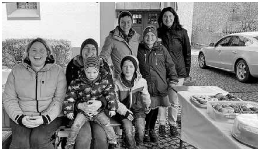
Die Eltern des Montessori Kinderhauses boten auf dem Bauern- und Wochenmarkt Palmsträuße und Kuchen zum Kauf an. Den Erlös erhielt das Kinderhaus für besondere Wünsche.

aufgesammelt werden. Die fleißigen Sammler waren erschrocken, wie viel Müll gefunden wurde. Das Montessori Kinderhaus will auch bei der nächsten Sammelaktion mitmachen, um den Kindern die Problematik mit dem achtlos in die Umwelt geworfenen Müll näher zu bringen.