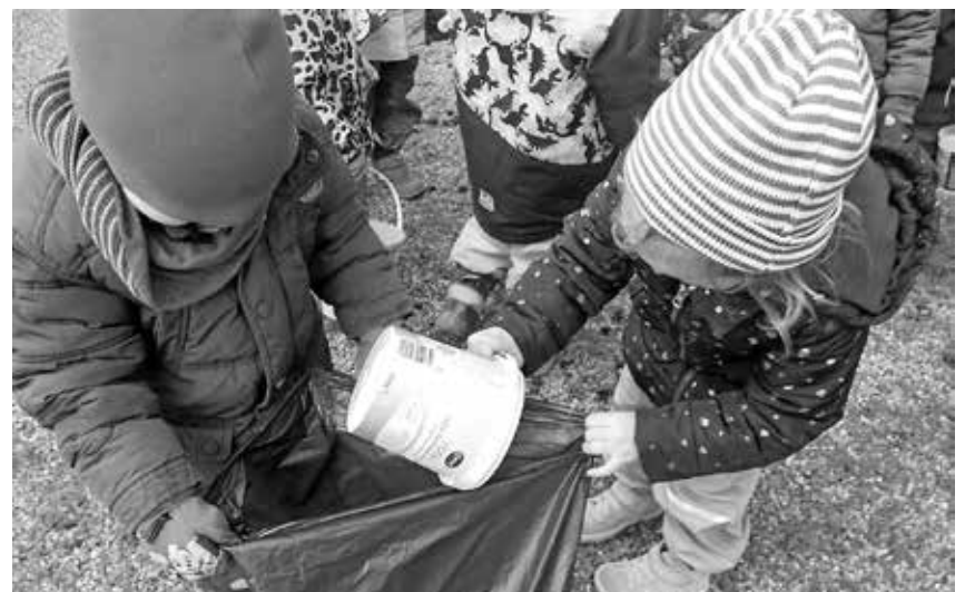
Die Kinder des Montessori Kinderhauses in Aach-Linz sammelten viel Müll rund um das Kinderhaus und die Schlossgarten-Halle ein.

Aach-Linz/pa - Das Montessori Kinderhaus in Aach-Linz hat sich an der städtischen Aktion „Stadtputzete“ beteiligt. Alle Kinder haben mit viel Freude und Spaß den Müll rund um das Kinderhaus und die Schlossgarten-Halle gesammelt. Sie waren mit Handschuhen und Eimern gut ausgestattet und mit Hilfe der Müllzangen, die die Stadt zur Verfügung stellte, konnte der komplette Müll