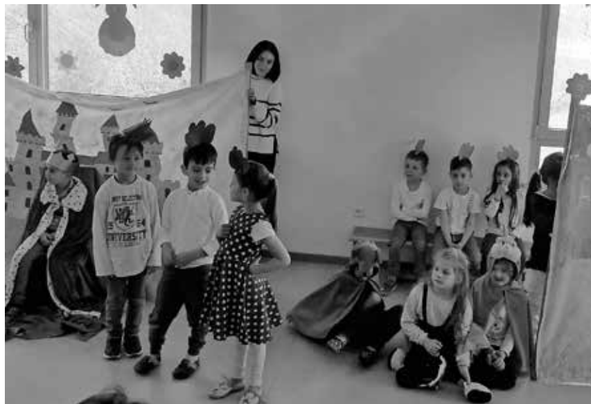
Die Vorschüler des Familienzentrums Sonnenschein führten bei der Osterfeier ein Theaterstück vor.

Pfullendorf/pa - Zu Beginn der Osterzeit haben sich die Vorschüler des Familienzentrums Sonnenschein etwas ganz Tolles überlegt, nämlich ein Ostertheater aufzuführen. Die Geschichte dazu war das Bilderbuch „Das schönste Ei der Welt“, das den Kindern vorab gezeigt und gemeinsam gelesen wurde. Anschließend ging es daran die Rollen zu verteilen. Jedes Kind suchte sich die Rolle heraus, die es am besten fand. Die Kostüme und Requisiten bastelten und stellten die Erzieherinnen und die Kinder her. Jedes Kind sollte seiner Rolle entsprechend gekleidet sein. Danach folgten Proben für das Theaterstück. Voller Vorfreude übten und probten die Vorschüler ihre Rolle und den Ablauf des Theaters. Von Mal zu Mal wurden sie sicherer