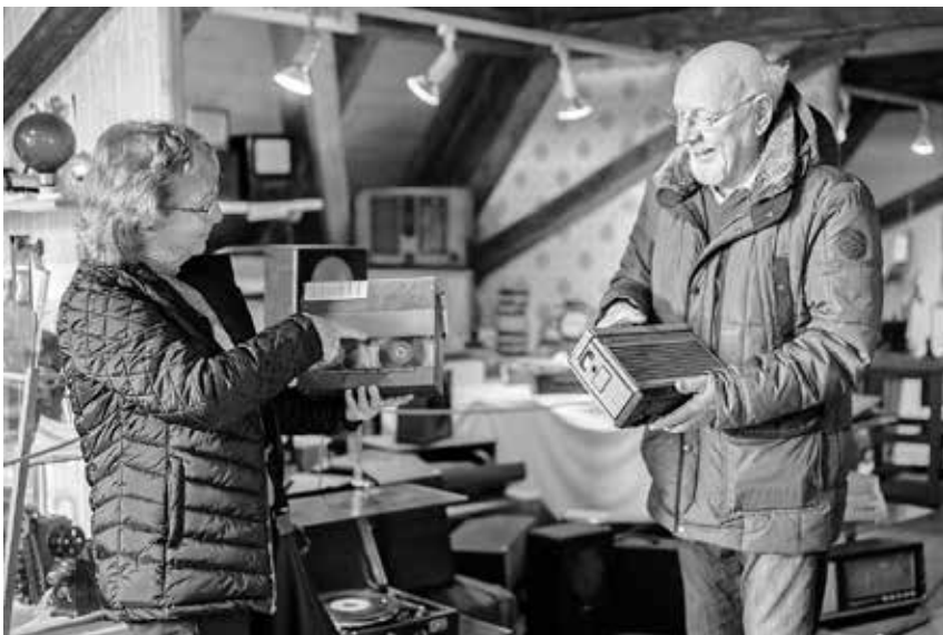
Die Mitglieder des Heimat- und Museumsvereins haben die Städtischen Museen für die neue Saison vorbereitet. Das Stadtmuseum im Alten Haus und das Heimatmuseum im Bindhaus öffnen erstmals am 6. Mai von 14 bis 17 Uhr.

Thema „Pfullendorfer Zunftverfassung“ eröffnet. Ausgestellt werden die historischen Zunftlaternen der Stadt, die in ihrem Zustand und Umfang einmalig sind. Zudem finden die Besucher im Obergeschoss eine Sonderausstellung der Schnellergilde Pfullendorf, die in diesem Jahr das Jubiläum 100 Jahre Preisschnellen feiern konnte. Komplettiert wird der Eröffnungstag mit einem historischen Vortrag um 17 Uhr. Frieder Kammerer, stellvertretender Vorsitzender des Fördervereins Ramsberg St. Wendelin und interessierter Historiker, spricht zum Thema „Graf Rudolf von Pfullendorf und das Geheimnis der Schweinshut“. Umrahmt wird die Öffnung der Häuser um 14 Uhr von Musikern der Big Band des Staufer Gymnasiums.