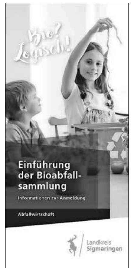
Der Landkreis führt zum Jahresende die Bioabfallsammlung ein. Die Bürger können wählen, wie sie ihren Bioabfall entsorgen wollen.