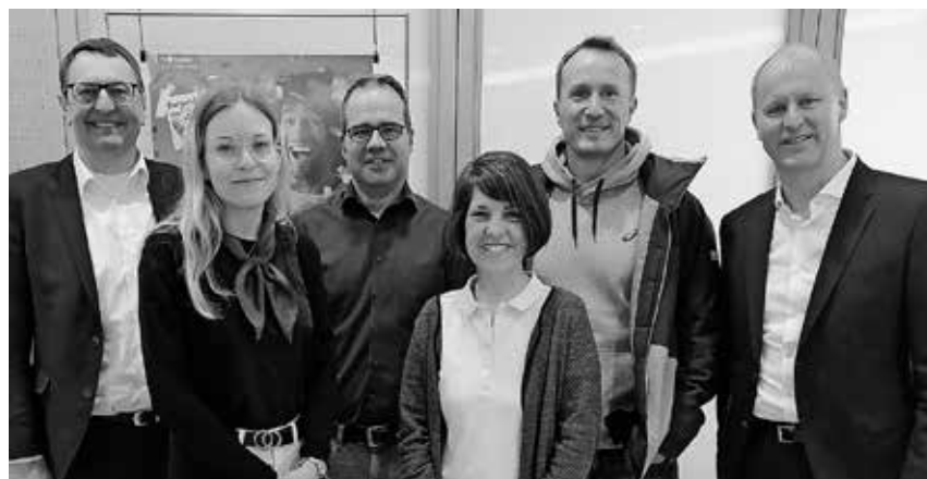
Die Sparkasse Pfullendorf-Meßkirch und die Realschule am Eichberg haben die seit zehn Jahren bestehende Bildungspartnerschaft nun um einige Einheiten erweitert.

Pfullendorf/pa - Der Pferdezuchtverein Pfullendorf/Bodensee lädt alle Interessierten am Sonntag, 23. April, zur Stutbucheintragung mit Züchterstammtisch und Weißwurstfrühstück auf die Reitanlage in Brunnhausen ein. Beginn ist 9 Uhr. Es werden 30 Stuten aller Rassen erwartet,