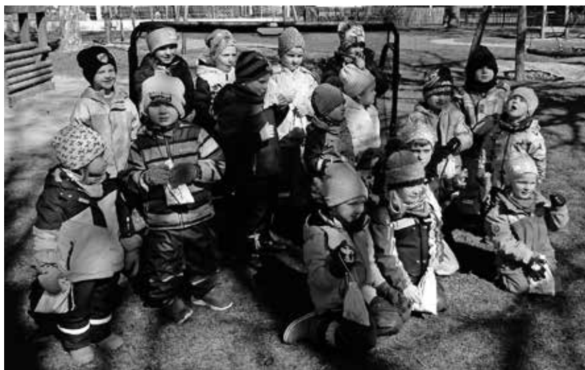
Der Osterhase hat für die Kinder im Denkinger Kindergarten kleine Säckchen im Garten versteckt.